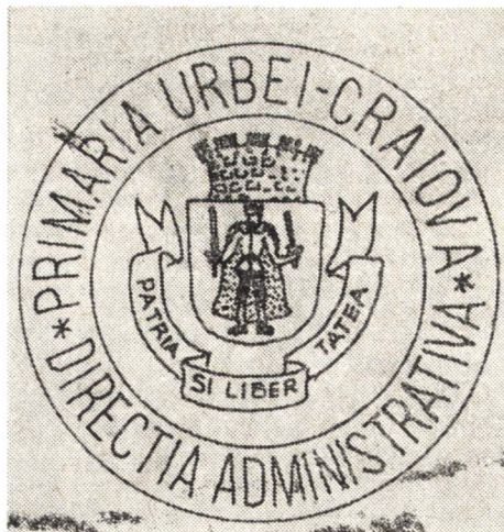
4. a și 4. b Sigiliul Primăriei orașului Craiova — 1867.