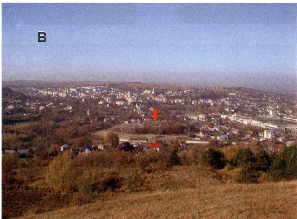
7 - A. Malul Nistrului și amplasamentul fortificației de la Perebykovci (foto autorul); B. În plan central, amplasamentul fostei fortificații din locul „Horodiște” de la Siret, actualmente cimitir evreiesc (foto autorul).