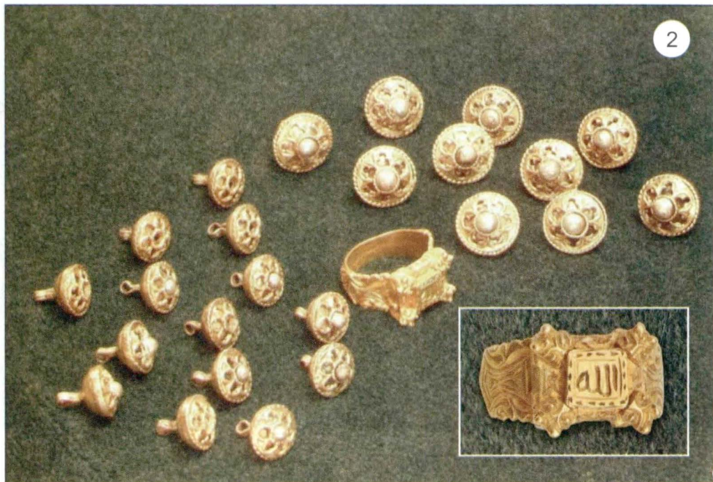
8 - 1 - inelul de aur din mormântul lui Bogdan; 2 – nasturi de argint aurit și inelul de aur din mormântul lui Lațcu (după L. și A. Bătrâna).