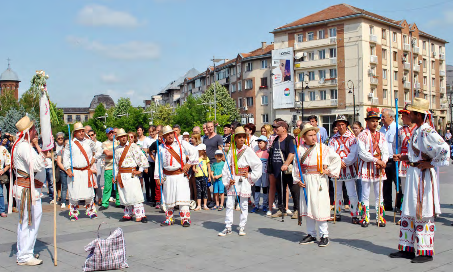
Foto 147 – 2018, Piața Mihai Viteazul, Coțofenii din Dos (sat Potmelțu)