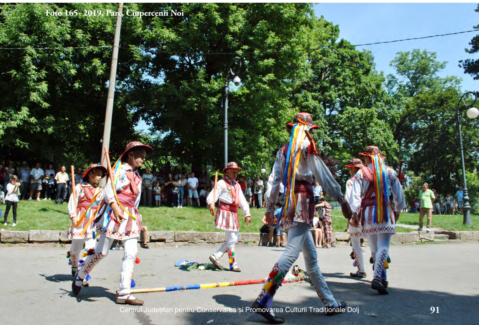
Foto 165- 2019, Parc, Ciupercenii Noi