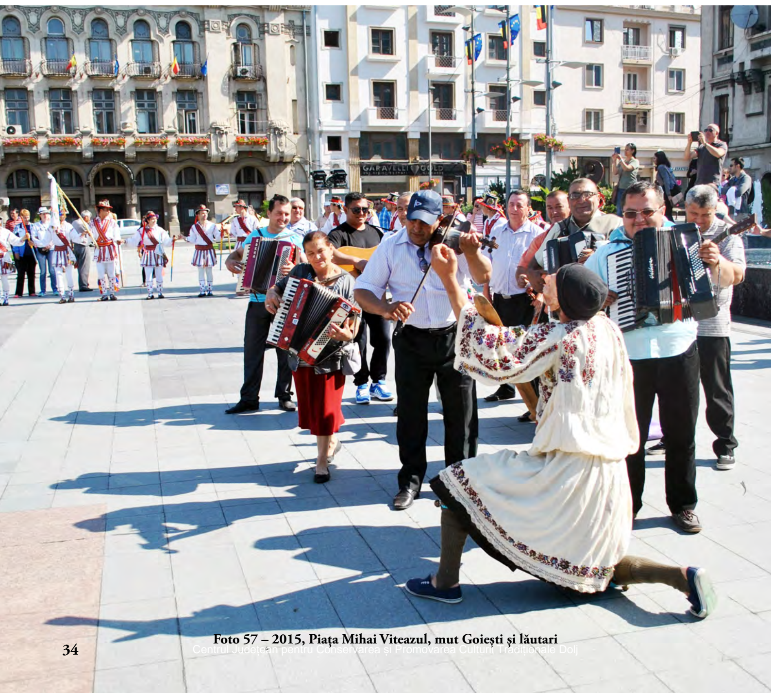
Foto 57 – 2015, Piața Mihai Viteazul, mut Goiești și lăutari Centrul Județean pentru Conservarea și Promovarea Culturii Tradiționale Dolj