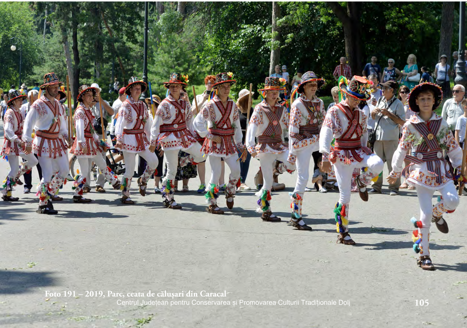
Foto 191 – 2019, Parc, ceata de călușari din Caracal Centrul Județean pentru Conservarea și Promovarea Culturii Tradiționale Dolj