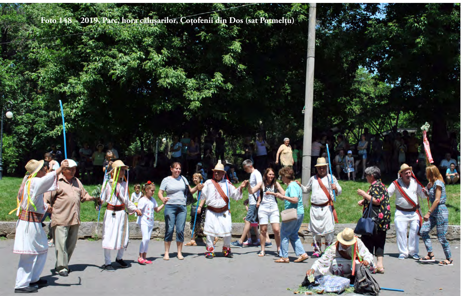
Foto 148 – 2019, Parc, hora călușarilor, Coțofenii din Dos (sat Potmelțu)