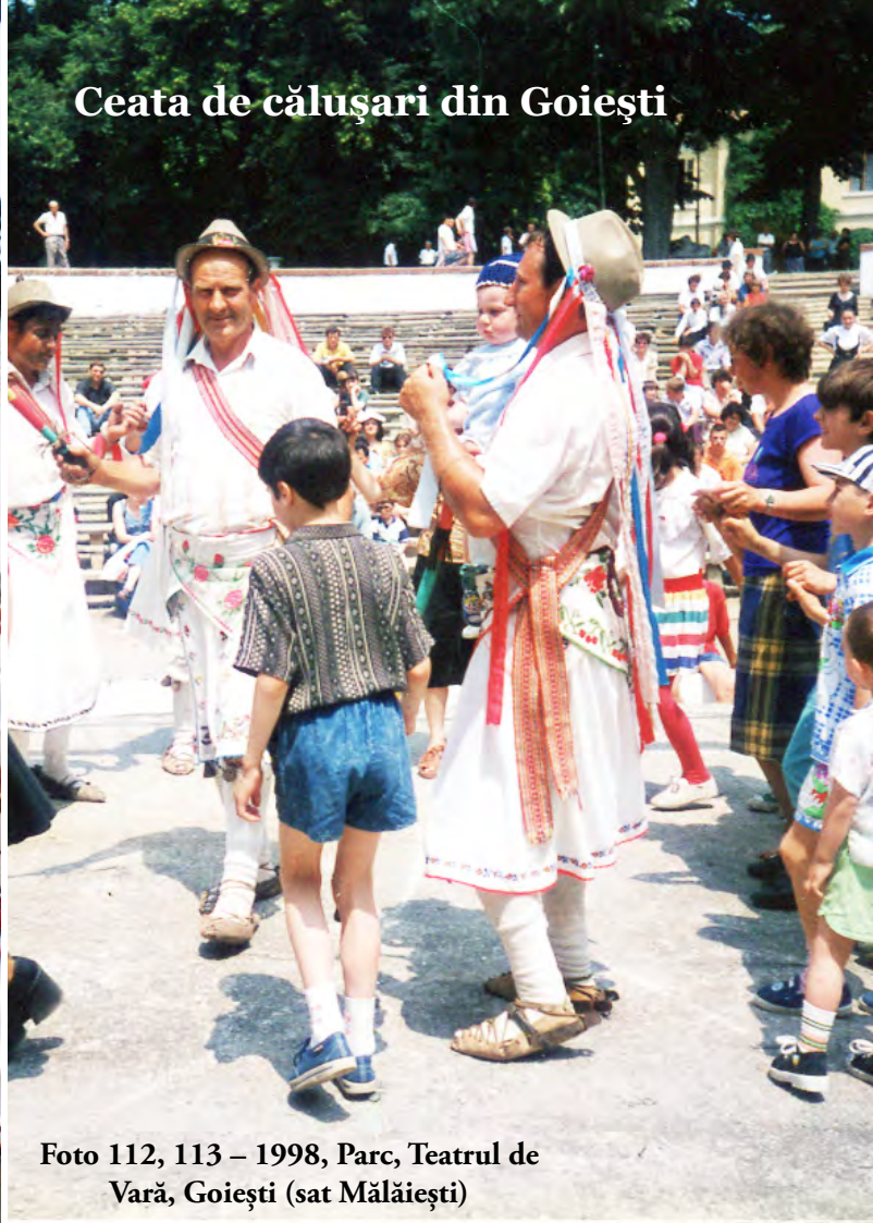
Foto 112, 113 – 1998, Parc, Teatrul de Vară, Goești (sat Mălăiești)