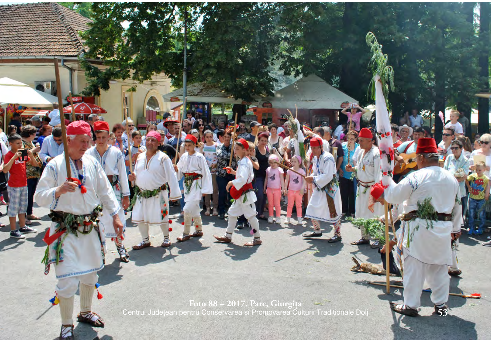
Foto 88 – 2017, Parc, Giurgița Centrul Județean pentru Conservarea și Promovarea Culturii Tradiționale Dolj