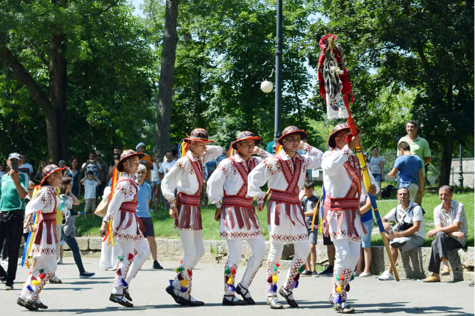
Foto 164- 2019, Parc, Ciupercenii Noi