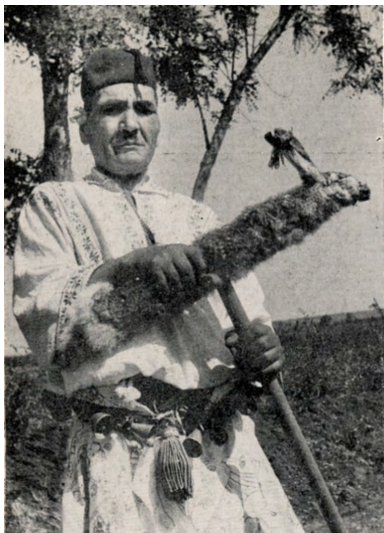
Foto 48 – 1960, vătaf cioc, Giurgița, foto volum „Călușarii” – Oprișan Horia Barbu