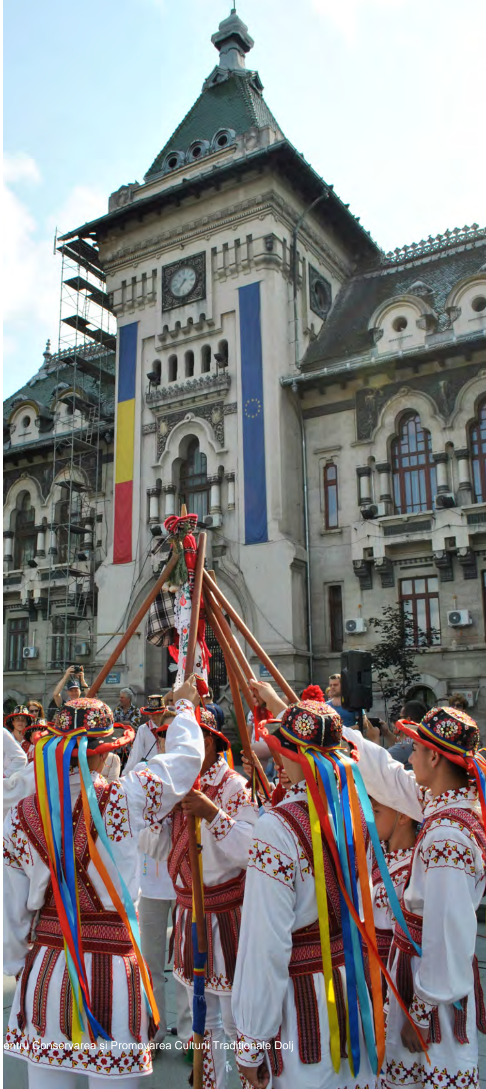
Foto 25 – 2018, Piața Mihai Viteazul, jurământul călușarilor din Ciupercenii Noi

Grupurile și cetele de călușari care practică călușul coregrafic au inclus în repertoriul lor și depunerea jurământului.