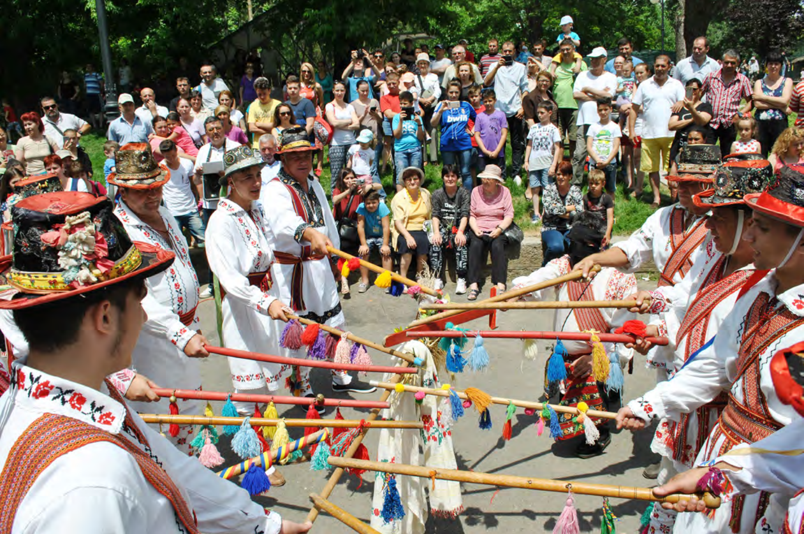
Foto 26 – 2017, Parc, jurământul cetei din Conțești, Teleorman Foto 27 – 2013, Parc, jurământul cetei din Pielești