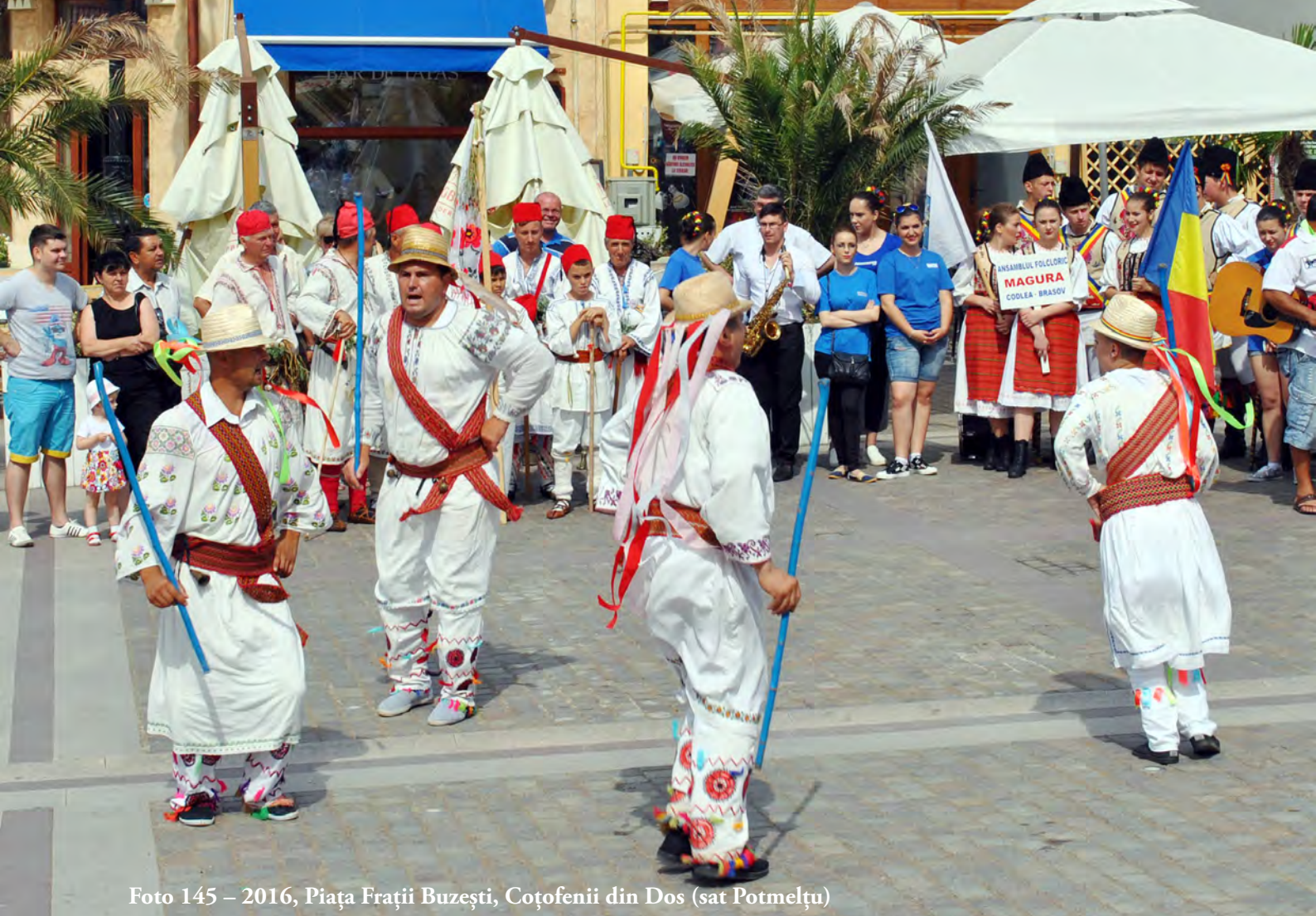
Foto 145 – 2016, Piața Frații Buzești, Coțofenii din Dos (sat Potmelțu)