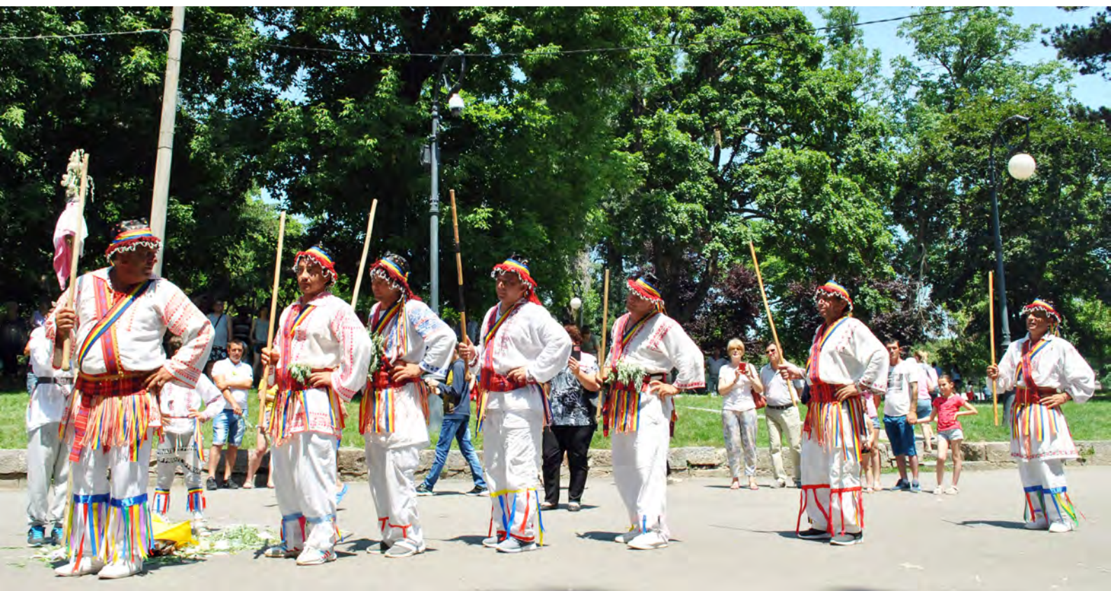
Foto 34 – 2019, Parcul „Nicolae Romanescu“, ceata de călușari din Pietroaia, comuna Sopot

Fiecare călușar devine un om respectat și după terminarea Călușului, mai ales că ei se legau să facă parte din ceată un număr de ani de-acum încolo iar puterile lor paranormale se manifestau numai în ceată, dansul lor având încărcătură magică.