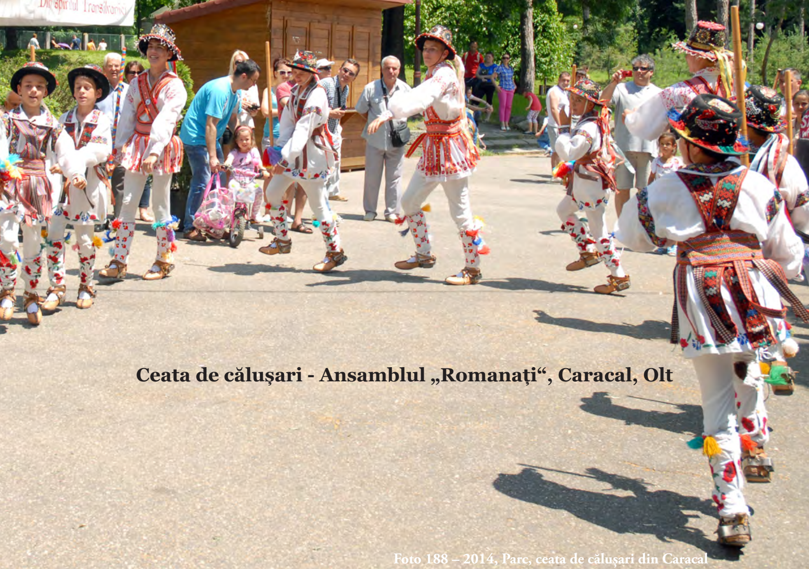
Ceata de călușari - Ansamblul „Romanați“, Caracal, Olt

Foto 188 – 2014, Parc, ceata de călușari din Caracal