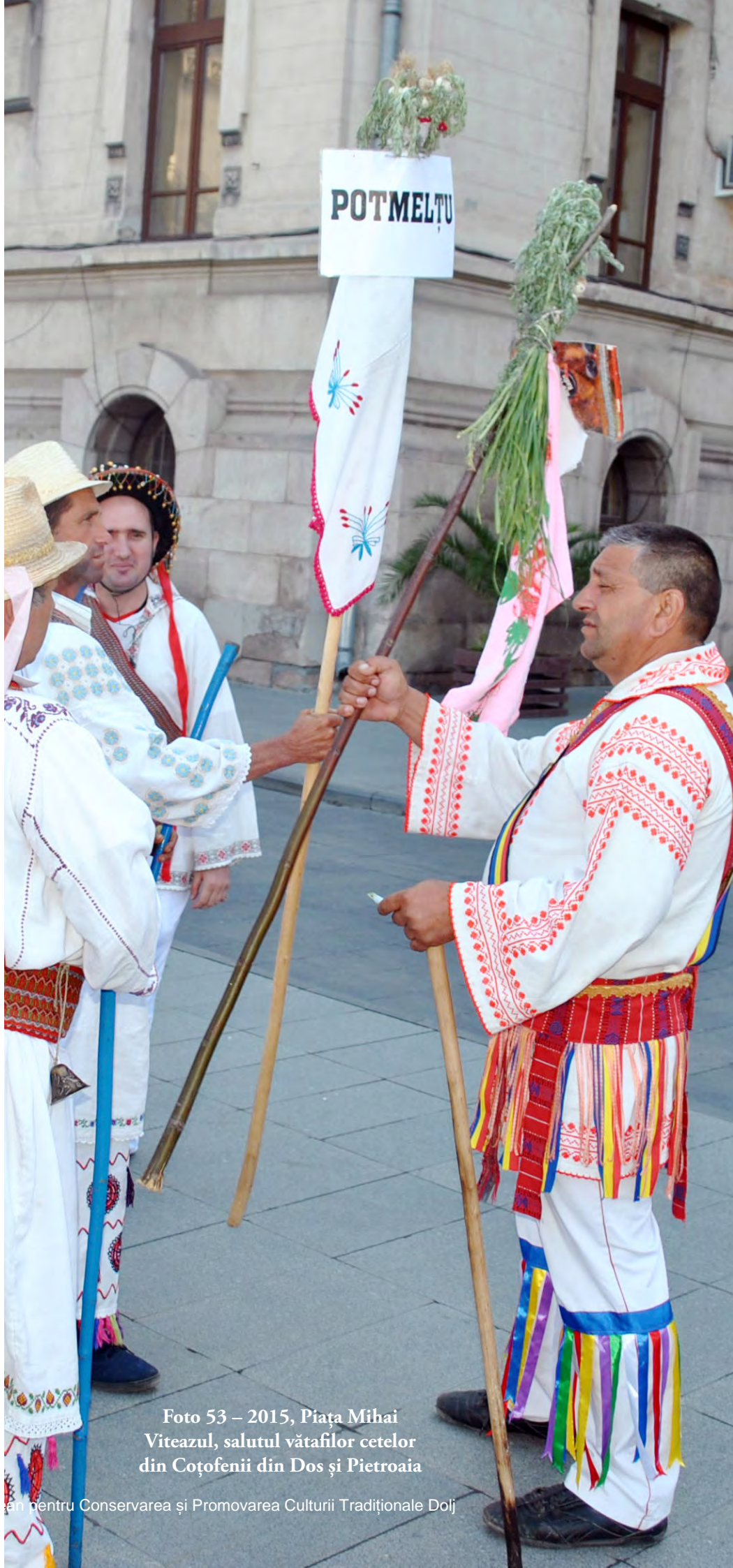
Foto 53 – 2015, Piața Mihai Viteazul, salutul vătafilor cetelor din Coțofenii din Dos și Pietroaia

În secolul XXI, întâlnirea dintre cetele de călușari la „Alaiul Călușului Oltenesc“ se desfășoară pașnic, după următorul ritual - atunci când două cete se întâlnesc prima oară pe anul acela în Piața „Mihai Viteazul“ din Craiova - vătafii se salută înclinând steagurile și cicocnindu-le și își dau unul altuia câte o bancotă care să le poarte noroc.