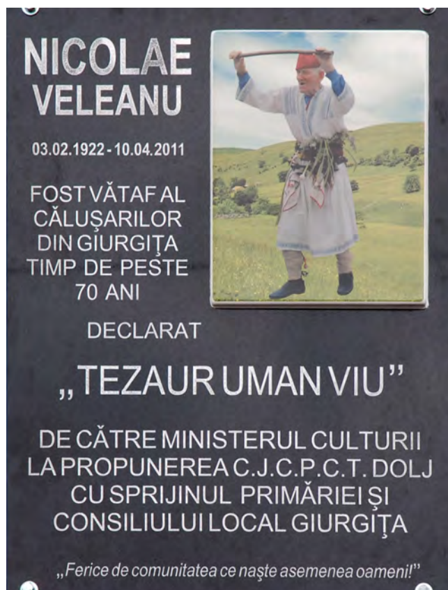
Foto 74 – 2013, Căminul Cultural din Giurgiuța, placă comemorativă - Nicolae Veleanu