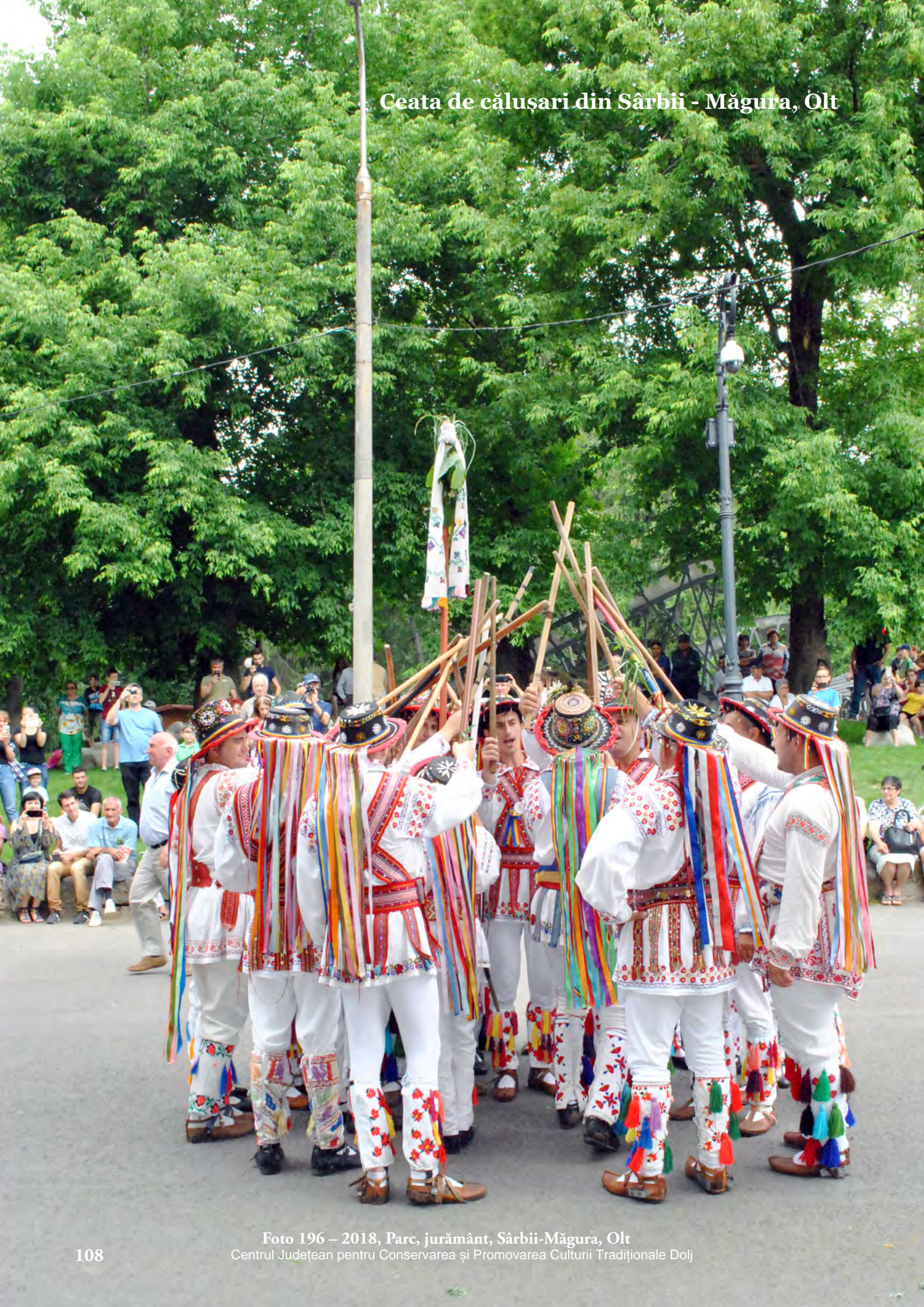
Foto 196 – 2018, Parc, jurământ, Sârbii-Măgura, Olt Centrul Județean pentru Conservarea și Promovarea Culturii Tradiționale Dolj