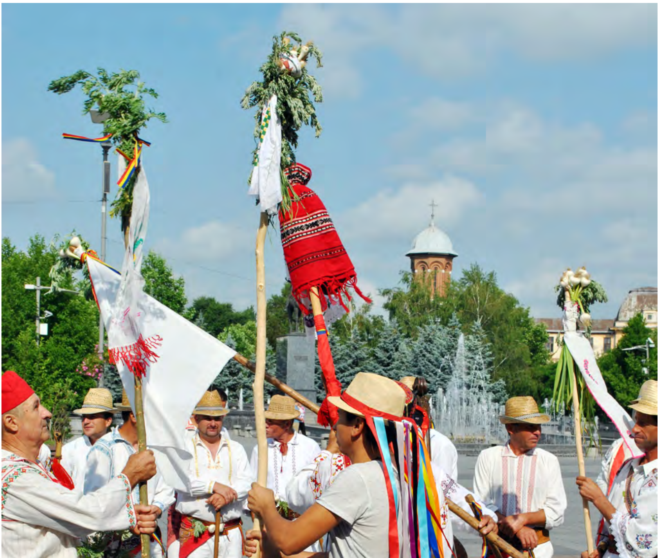
Foto 24 – 2018, Piața Mihai Viteazul, Întâlnirea cetelor de călușari din Dolj