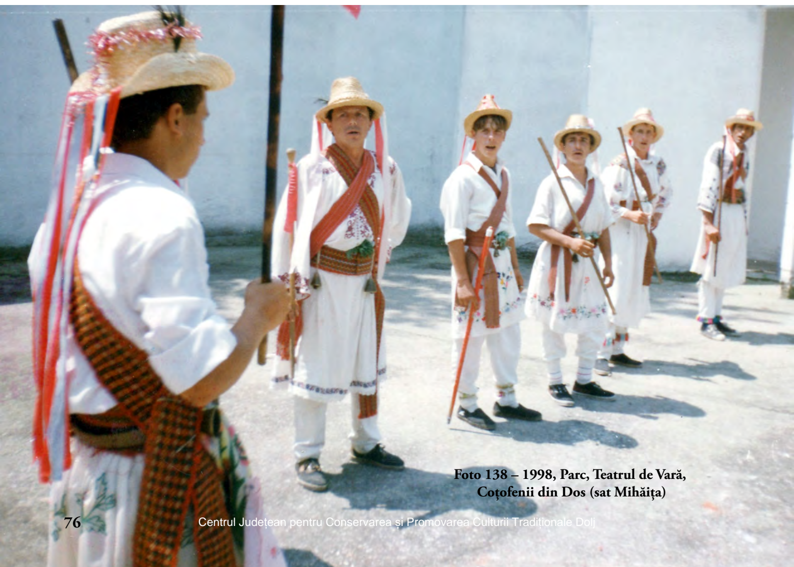
Foto 138 – 1998, Parc, Teatrul de Vară, Coțofenii din Dos (sat Mihăița)