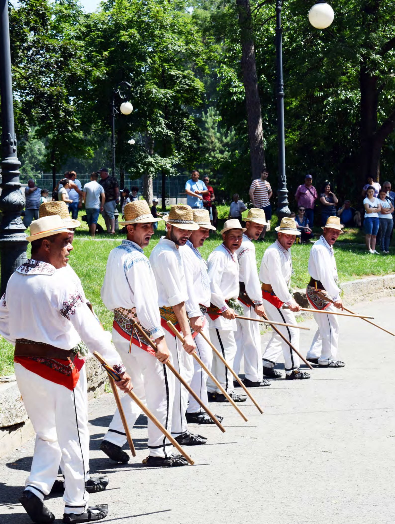
Foto 35 – 2019, Parcul „Nicolae Romanescu“, ceata de călușari din Dăbuleni Centrul Județean pentru Conservarea și Promovarea Culturii Tradiționale Dolj