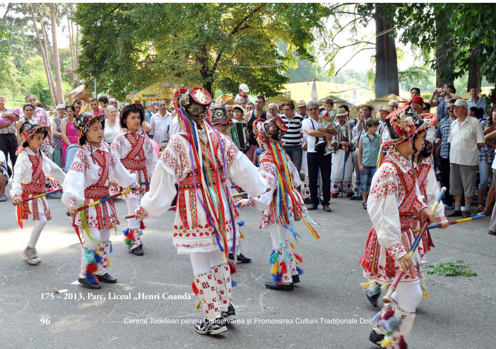
175 – 2013, Parc, Liceul „Henri Coandă”