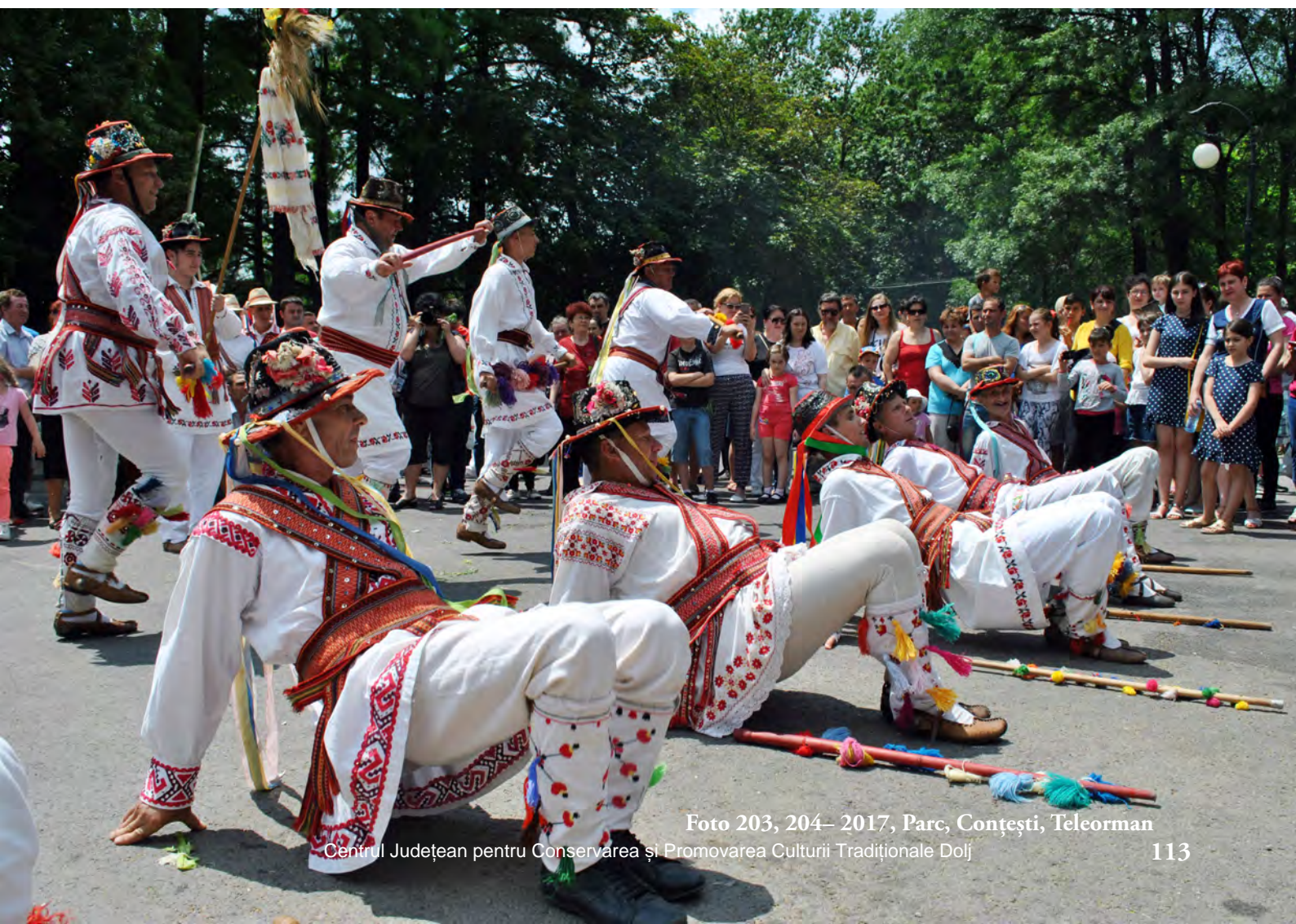
Foto 203, 204– 2017, Parc, Conțești, Teleorman Centrul Județean pentru Conservarea și Promovarea Culturii Tradiționale Dolj