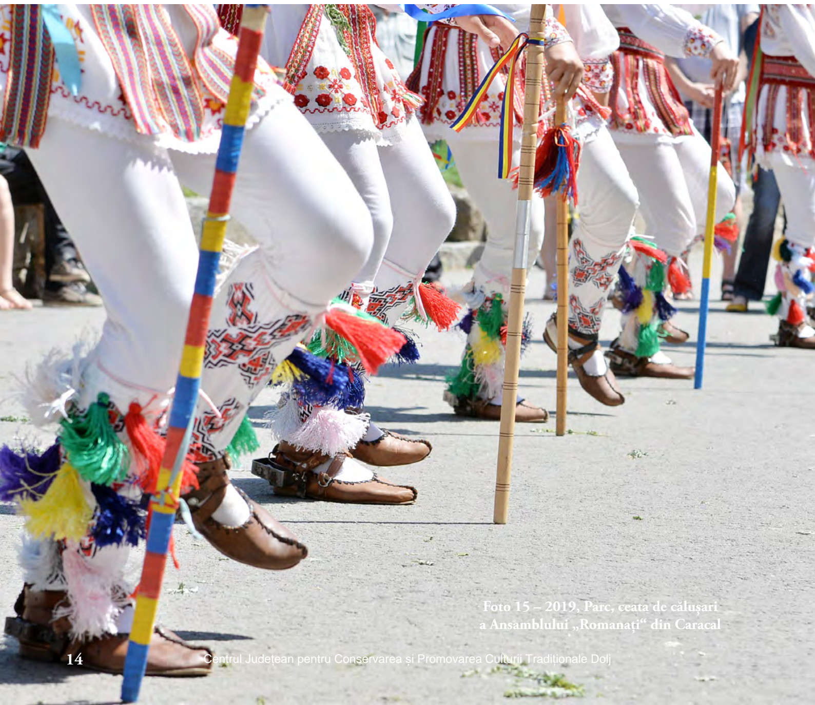
Foto 15 – 2019, Parc, ceata de călușari a Ansamblului „Romanați“ din Caracal

În „Calendarul Popular“ lor le este dedicată o