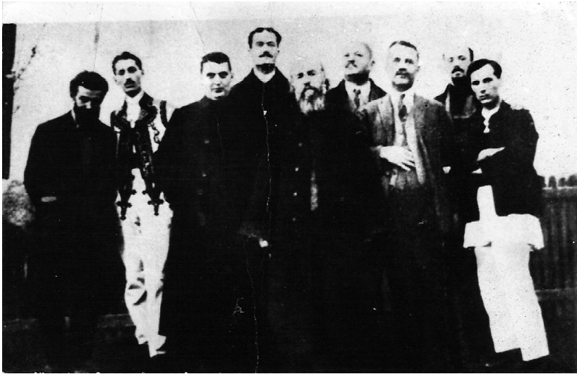
4 ianuarie 1927: membrii fondatori ai „Tovărășiei folcloriștilor olteni“ la Ștefănești – Vâlcea.