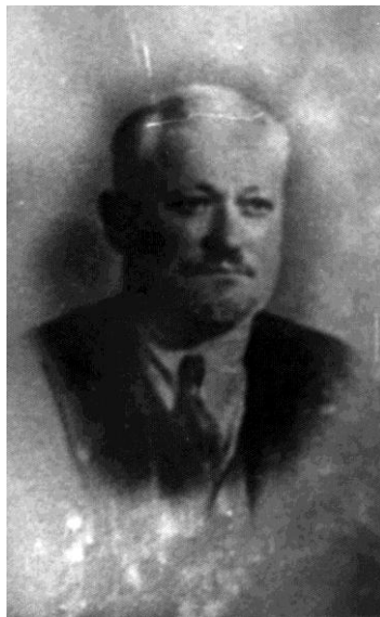
Poză din 1935