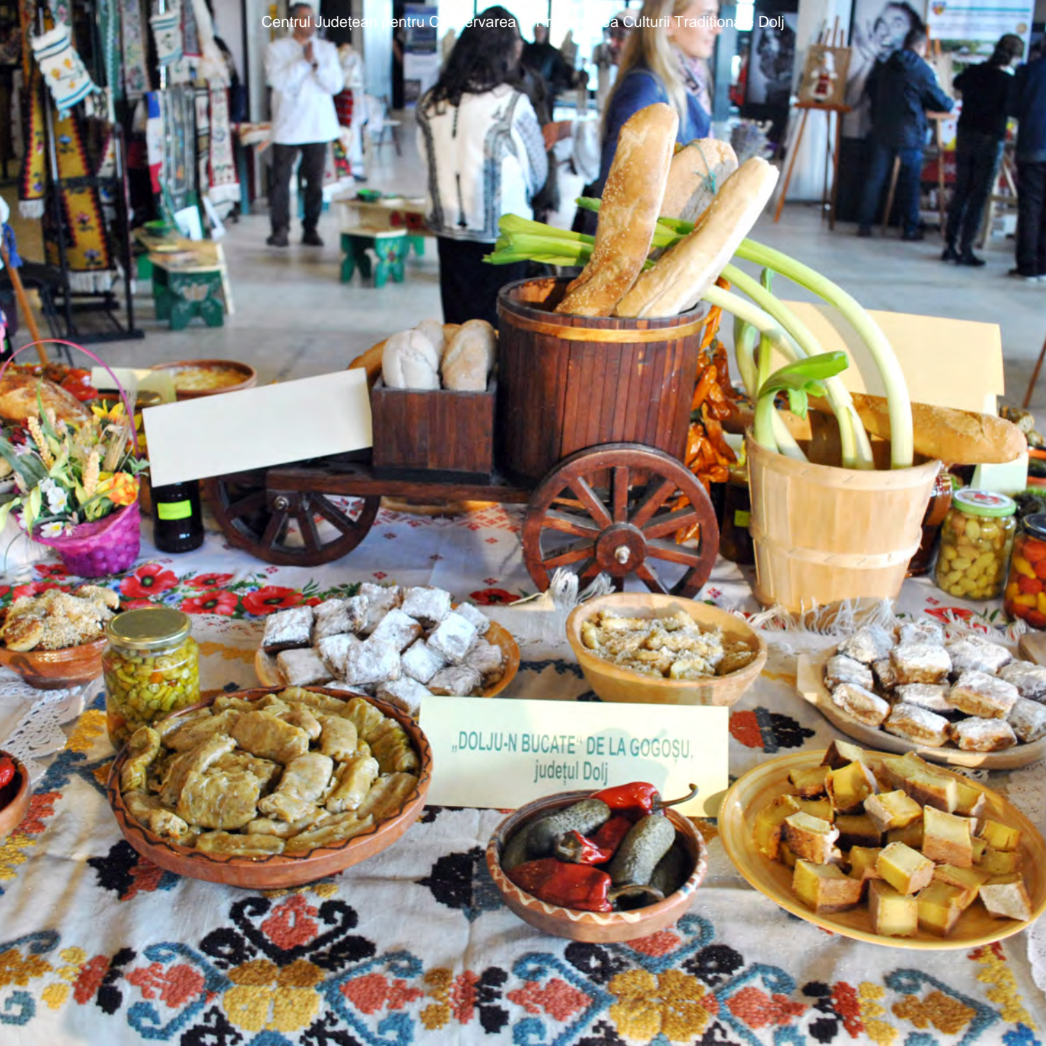
„DOLJU-N BUCATE” DE LA GOGOȘU, județul Dolj