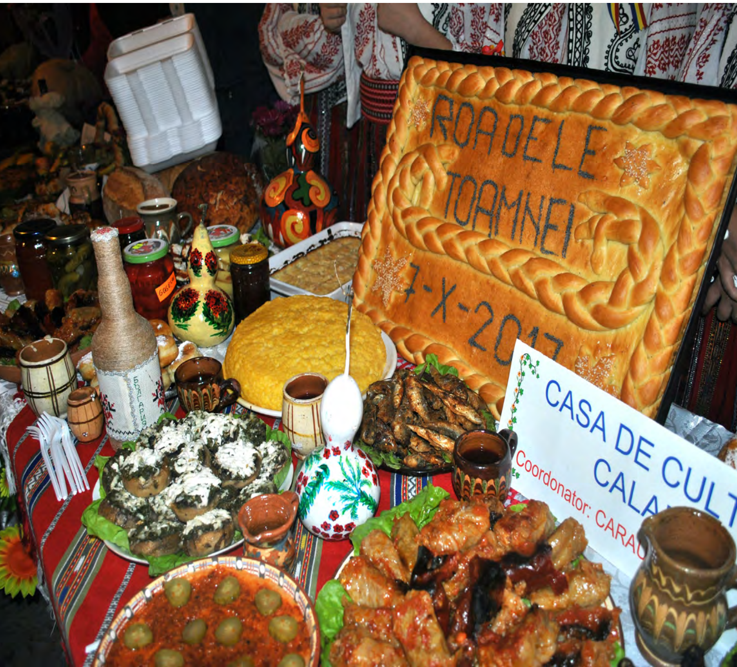
Festivalul „Roadele Toamnei”, Calafat, 7 octombrie 2017