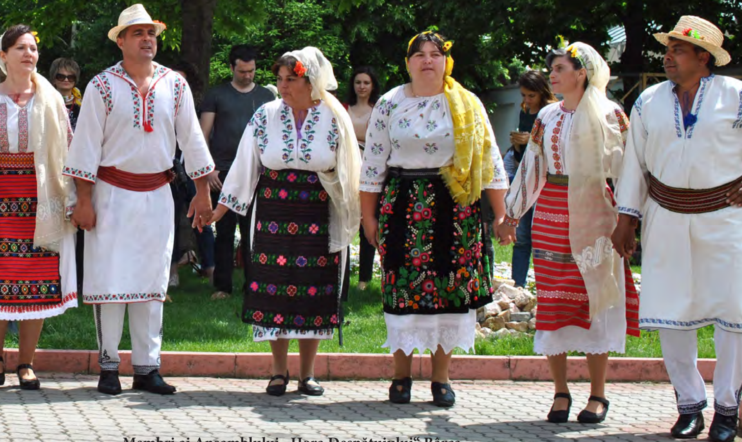
Membri ai Ansamblului „Hora Desnațuiului“ Bârca