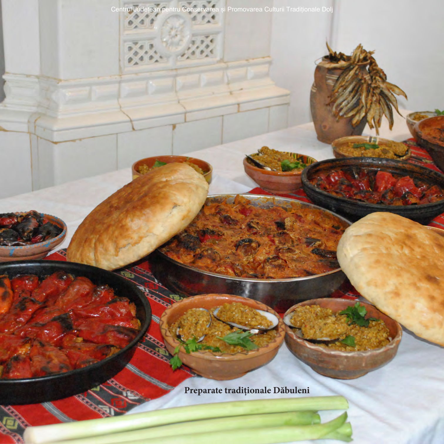
Preparate tradiționale Dăbuleni