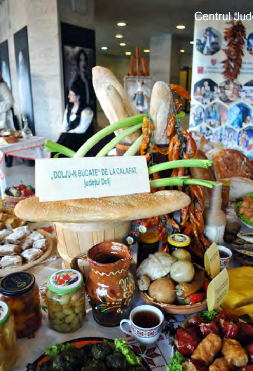
Ziua Olteniei, Teatrul Național „Marin Sorescu”, 21 martie 2018