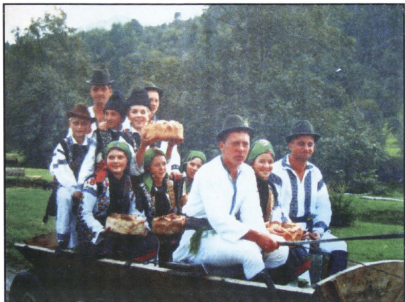
Cu faetonul după mireasă.