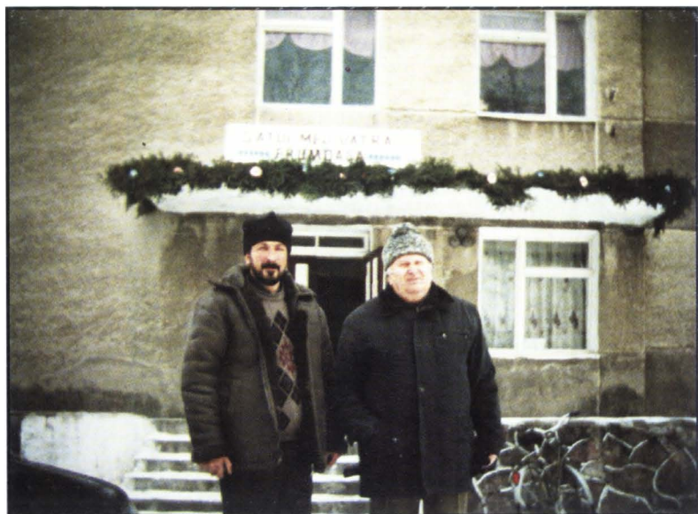
Sărbătoarea „Satul meu vatră frumoasă” la Casa Culturii din Ropcea.