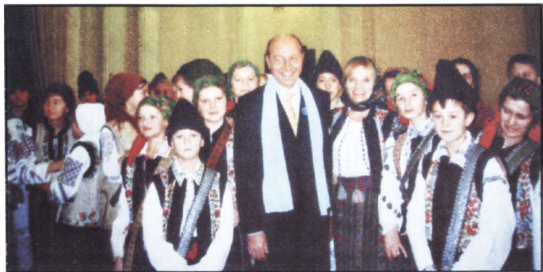
Colectivul folcloric 'Izvoarașul' al copiilor ropcenii l-a colindat pe Președintele României Traian Băsescu (2006).

Citiți în paginile următoare câteva episoade privind calvarul ropcenilor.