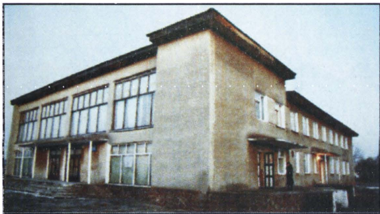
Casa de Cultură din Ropcea.