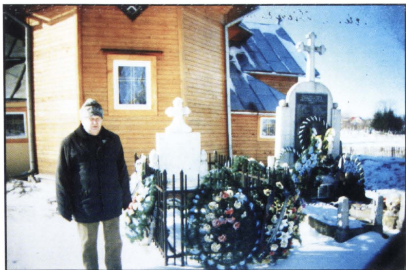
La mormântul lui Iancu Flondor, unificatorul, Storojineț.