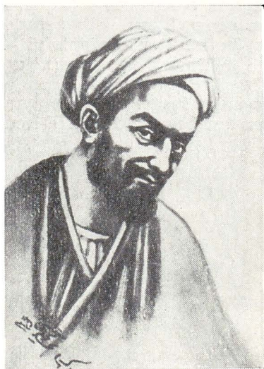
Marele poet persan Saadi

Dacă în Orient a cunoscut o răspîndire rar întîlnită, nu înseamnă nici pe departe că lumea de la apusul hotarelor vechii Persii n-a cunoscut de timpuriu Golestanul și nu l-a prețuit la adevărata sa valoare. După ce secole de-a rîndul a fost folosit ca o carte pentru învățarea limbii persane, deci, în felul său, un abecedar neobisnuit, Golestanul lui Saadi a devenit un