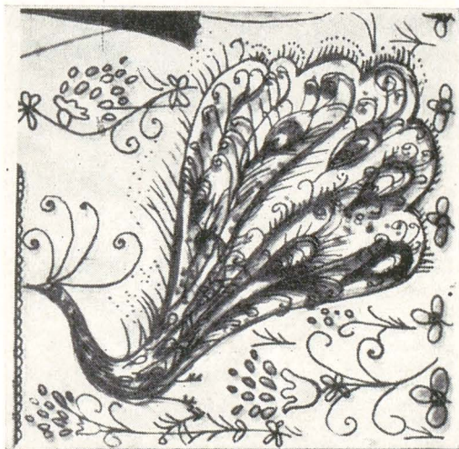
Motive decorative folosite în textele orientale