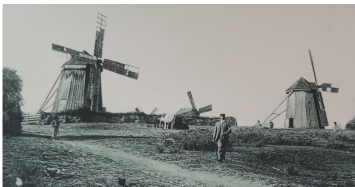
Mori de vânt dobrogene

Și au dărâmat-o prin 1962 pentru că au apărut morile electrice și aceasta nu a mai fost utilă.