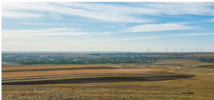
Comuna Topolog

Satul Topolog a fost o așezare turcească numită Topal Ak. În 1573, în Defterul Otoman, se menționa că localitatea era formată din Topal-Ak dar și din Topal-Ava, Topologul român.