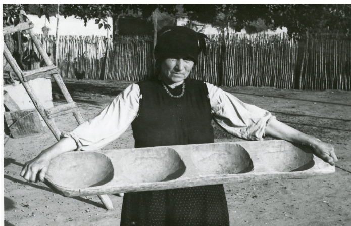
Femeie cu covată

Adăugai făină, te uitai cam în ce tavă vrei să pui pâinea pe care o faci și știai din ochi cât să măsoari, cât să iei în plame și o făceai rotundă sau lungă și o așezai frumos în tavă; și când erau toate gata le ungeai cu ulei; cine își permitea, le ungea și cu ou. Mai creșteau în tavă și când focul era gata trecut, când nicio flacără nu mai era, trebuia să vezi că s-a albit podul cuptorului. Trăgeai cu dârgul cu o coadă lungă jarul, așteptai să treacă văpaia aia puternică, acopereai jarul cu tabla - jarul era tras pe pragul din fața cuptorului - și făceai așa loc ca să poți să treci cu lopata.