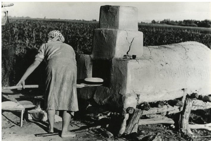
Cuptor de pâine

Puneai pe lopată tava aceea cu pâine, sau o puneai direct pe vatră, după preferințe.