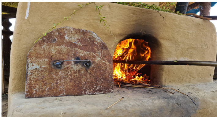
Gură cuptor de pâine, abiva Muzeului ASTRA

porționarea aluatului și se întoarce o bucată cu mâinile pe fundul de lemn uns cu ulei. Se poate umple după preferință cu nucă măcinată, cu cacao, cu rahat sau stafide. Se rulează apoi ca să stea umplutura înăuntru și se așază cu dibăcie în tavă. Între timp, se trage jarul cu dârgul. Dârgul este o unealtă din tablă cu o coadă foarte lungă din lemn, nelipsită din casele dobrogene.