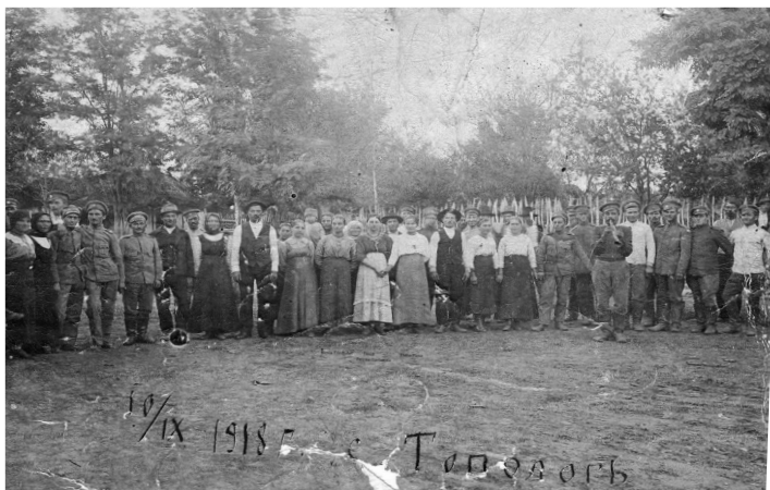
Săteni din Topolog - 1918, arhiva Muzeului Satului Topolog