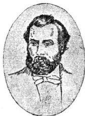
AL. PAPIU ILARIANU 1827—1877

Vere Ioji. — Astăzi între 10—11 ore de dimineață am ajuns aici, și cu toate că-s mai morbos (aproape bolnav), totuș mă proper (grăbesc) a-ți scrie cum am venit pân' aci. Două nopți mai n'am închis ochii de loc; dar, mai ales astă noapte, eram să pier de frig; asta ți-o însemnez pentru aceea, ca de acasă să te îmbraci bine... In două locuri pân' la Trieste vei veni cu Post-wagen , întâia oară ai grijă să nu șezi înainte în căruț, ci înlontrul căruțului, pentrucă nici nu e așa frig, apoi mai poți închide și ochii puțin; ci, când te vei sui în căruț dela Laibach încoace, e mai bine să șezi înainte, mai ales de vei fi și bine îmbrăcat, căci numai șezând înainte, poți să vezi bine locurile cele romantice; și mai vârtos în stațiunea ultimă pân' la Triest, poți să vezi într'adevăr, ca într'o panoramă reală, teritoriul triestin și marea — din