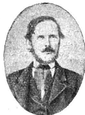
GH. BARIȚ 1812—1893

Dv. ați mai aveà să observați: 1. O grabă mare, pentruca nu cumvã Senatul să se închiză fără veste. — 2. Să tăiați toate acele puncturi care nu vă ating și pe DV. imediate, și să puneți altele, de ex.: Cauza munților DV., dacă aceea încă nu e terminată, ceea ce noi nu știm. (Să lăsați afară de ex.: pp — punctele — însemnate cu Non la margine, — scrie în paranteze Bariț). — 3. Să nu vă prea întindeți la comune multe, două, trei mai mari vecine sânt de ajuns, care apoi să fie reprezentate cel mult de 50 subscripțiuni fruntașe . — 4. Rugămîntea să se compună astădată în limba germană; An den Hohen Reichsrath der Oesterreichischen Monarchie. — 5. Să se trimită la un amic, carele să o dea dea-