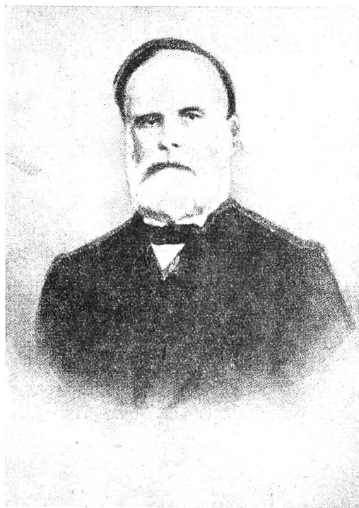
AUG. TREB. LAURIANU 1810—1881