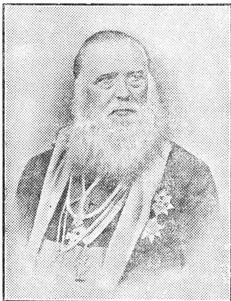
Mitr. A. ȘAGUNA, 1808—1873

și așa fu(ră) silit (siliți) a se întoarce cu pudore. S'a oblicit și ceea, că magh(iarii) vreau să-i facă mitropo(litului) muzică de pisici (Katzenmusik), dară brava tinerime rumână se poartă minunat, în toată noaptea străjuesc pe strada Cisnădiei (astăzi strada Regina Maria), unde se află Mitrop., 40 inși; alții, 50—70, așteaptă aviso la Seminar, și de vor cuteză ceva acei nerușinați,