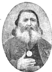
SIMEON BALINT 1810—1880