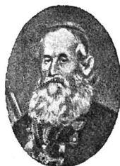
Mitr. AL. ST. ȘULȚ de la Blaj, † 1867

Pentru un așa prea salutar scop dară, am aflat de totului a fi de lipsă ca, în absența Excelenței Sale Episcopului D. Șaguna, să conchiem Eu la o conferință și consultațiune pe 25 Martie (6 April) a. c. în Sibiu pe toți membrii a(i) permanentei Comisiuni naționale române, unde, dacă îmi va păstră Dumnezeu puțina sănătate, mă voi afla și Eu; — pe care ter-