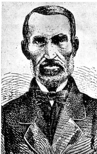
SIMEON BĂRNUȚIU 1808—1864

Adjuncții directorului, doi sau trei, cari eară ar fi montaniști ardeleni, ar avea fiecare 12.000 lei pe an; viaticul încă s'ar da