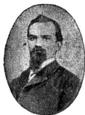
TITU L. MAIORESCU 1840—1917

Titu Maiorescului a perorat (a rostit cuvântul) în limba italiană. El e în a 7. clasă, eminens distinctus, face onoare Românilor. Ieri a plecat la Brașov, la mamă-sa. Tată-so mai rămâne în Viena pe vr'o câteva luni... (Restul lipsește).