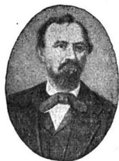
IOAN MAIORESCU 1811—1864

Domnule Balint! — ... DI M(aiorescu) a fost plecat în 16 Iunie la Istria și s'a întors în 26 Iulie. Scopul călătoriei lui a fost limba. Acum șede de vreo câteva zile la mine până ce își va căpăta locuință. Doamne, ce mai pace am cu el în casă, toată noaptea nu dormim; apoi dimineața se scoală înainte de revărsatul zilei, se duce la fântână și mă omoară cu apa. Nu-mi dă pace până ce nu-i beau io lui câte două trei păhare de apă rece pe nemâncat. Ris-am de multe ori... mai ales când ne aducem aminte cum mă îmbătrânise el cu mămăliguța lui înainte de vr'o 7 ani, când am fost la DTa în Roșia. (Când adevă I. Maiorescu întocmea raportul lui Balint din 1848/49, mâncarea sa de seară era de obicei mămăligă cu lapte).