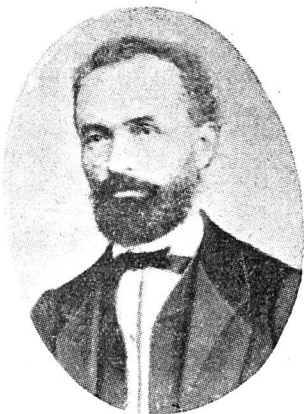
IOS. HODOȘ 1829—1880

depărtare, o vedere de minune frumoasă... Să-ți scoți bilete de drum și pentru ladă (plină mai ales de cărți) deodată pân' la Triest, ca să-ți iei o grijă și să nu mai ai învăluială pe drum... (Urmează lista cărților cerute)... Pân' ce te afli încă în Viena, ocupă-te cu limba italiană, că vei să aibi necaz pe drum... Să cruțăm banii ca lumina ochilor, că va să ne iee dr... în Italia fără bani, că pe aicea toate cele sânt mai scumpe ca în Viena. Și știi că la nîme, nici chiar la muntele pietății, nu te poți duce spre a-ți fi în ajutor. Io am intrat în chibzuri... Până voi scrie mai pe larg poimâne din Padua, spune salutarea mea la toți frații din Viena.