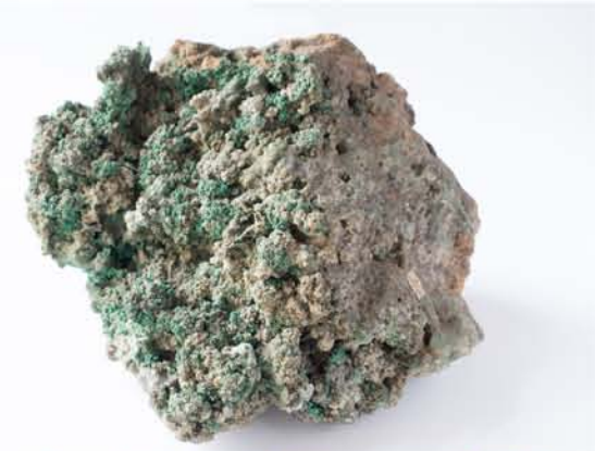
3955 Malahit, Dognecea, CS