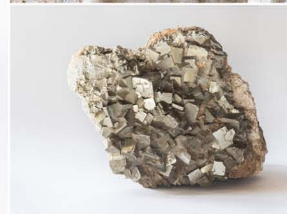
4961 Pirită, Dognecea, CS