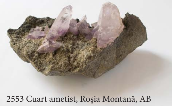
2553 Cuarț ametist, Roșia Montană, AB