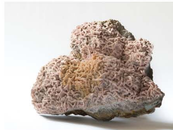
4275 Rodocrozit, Dognecea, CS