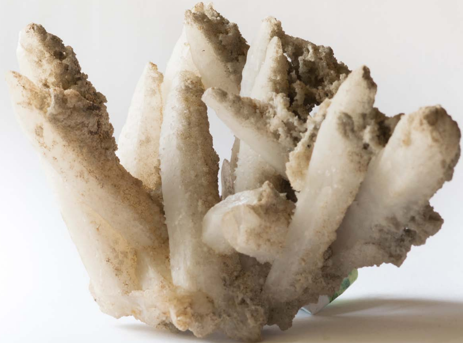
2505 Cuarț cu calcit, Băița, HD