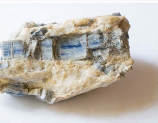
3074 Disten Sebeș, SB