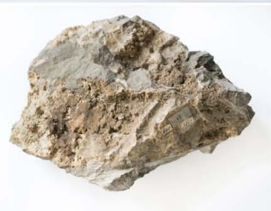
4385 Aur, Roșia Montană, AB