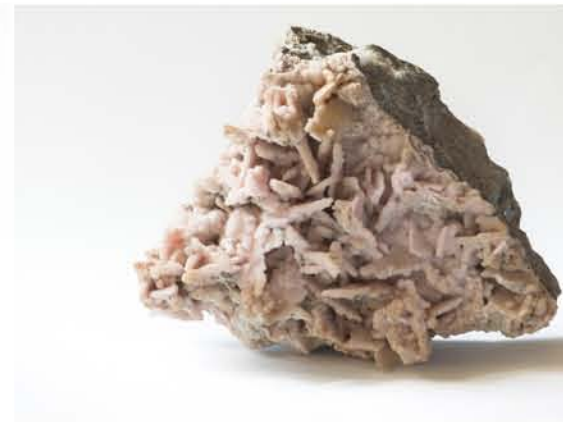
4273 Rodocrozit, Dognecea, CS