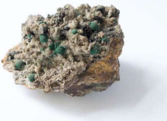
3954 Malahit, Dognecea, CS