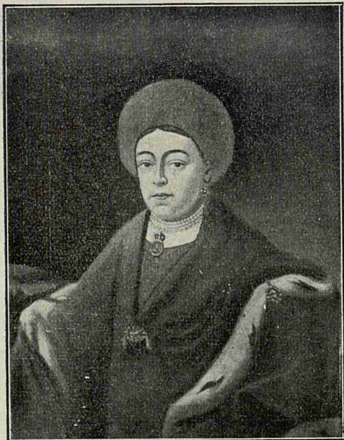
Doamna Casandra a lui Dimitrie Cantemir, mama lui Antioh, marele poet; a fost fiica lui Șerban-Vodă Cantacuzino.