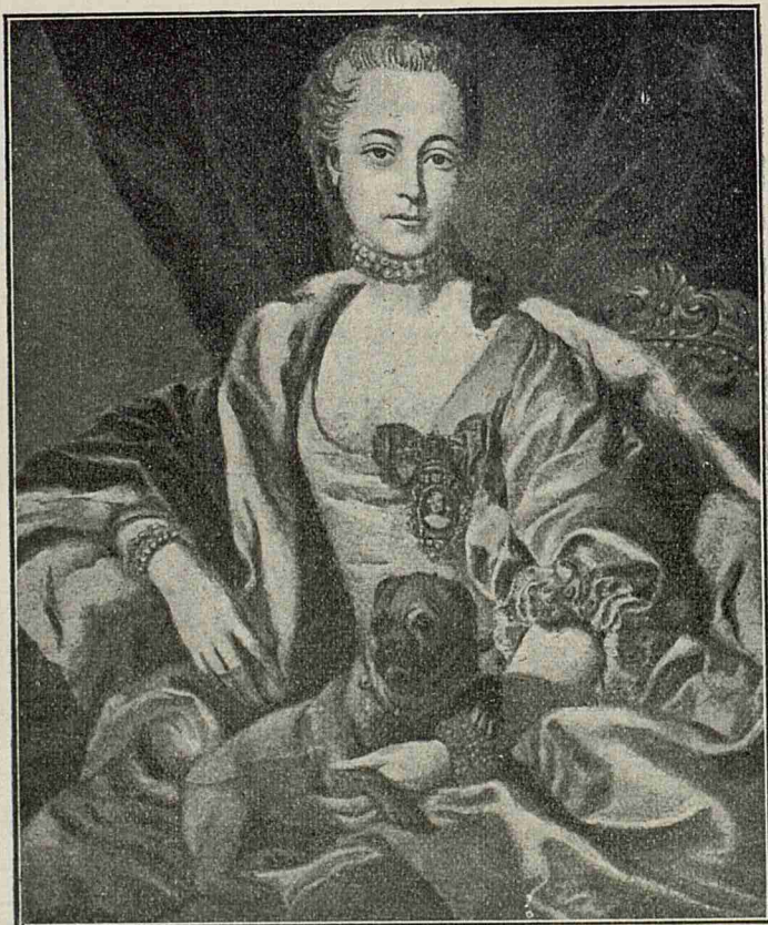
O fiică a lui Dimitrie Cantemir.