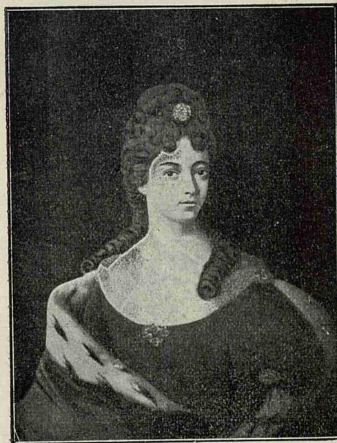
A doua soție a lui Dimitrie-Vodă Cantemir, Anastasia Trubețcoi.