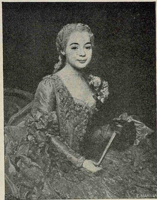
Femeie din neamul lui Dimitrie-Vodă Cantemir.