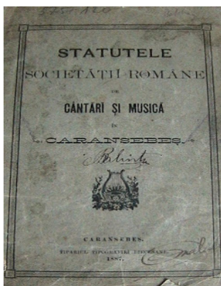
Imaginea 2. Statutele Societății Române de Cântări și Muzică din Caransebeș