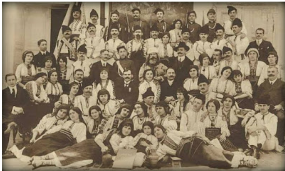
Imaginea 1. Membrii Reuniunii de Cântări și Muzică din Caransebeș.