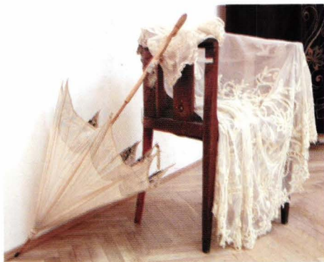
cat.8 și 14