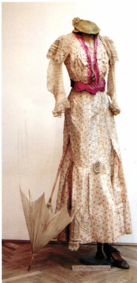
cat.7 și 15