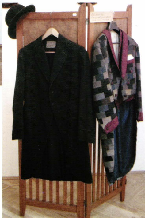
cat.11,13 și 33