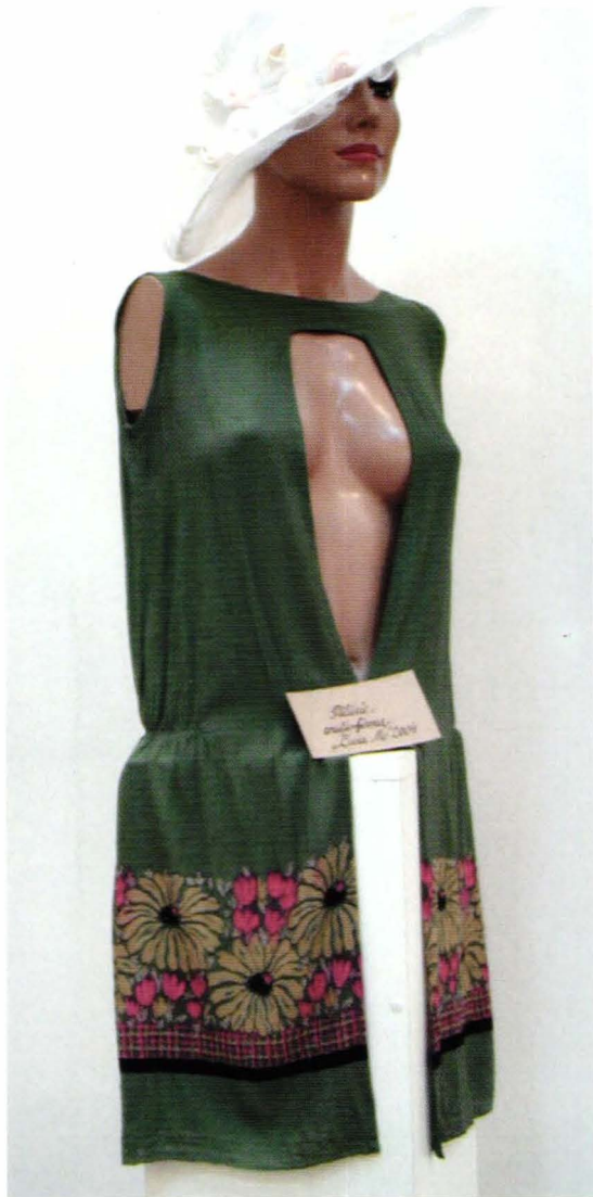
cat.39 și 19