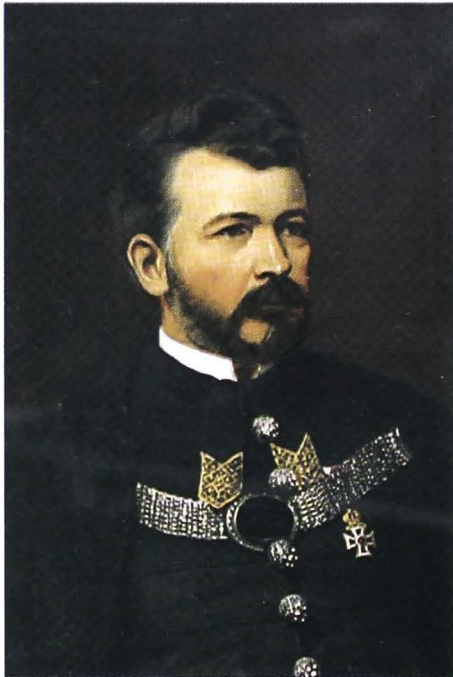
Prefectul Tabajdi Károly (cat. 16)