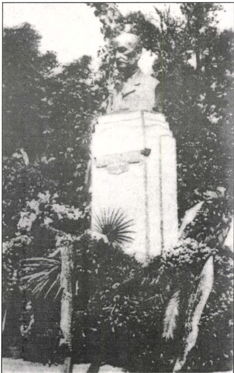
Monumentul închinat lui Emanuel Ungurianu.