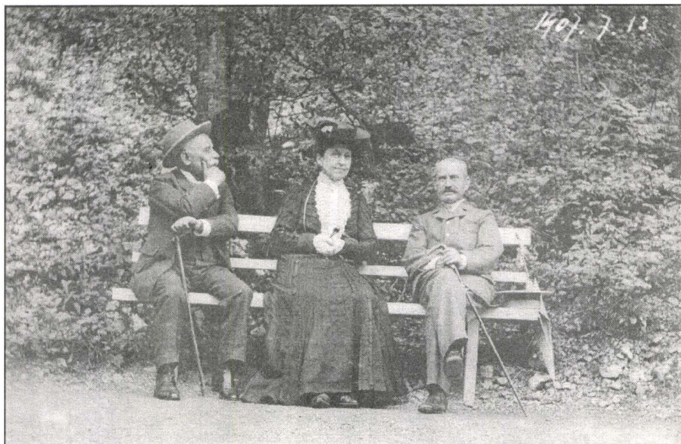
Emanuil Ungurianu în stațiunea Băile Herculane (1907).