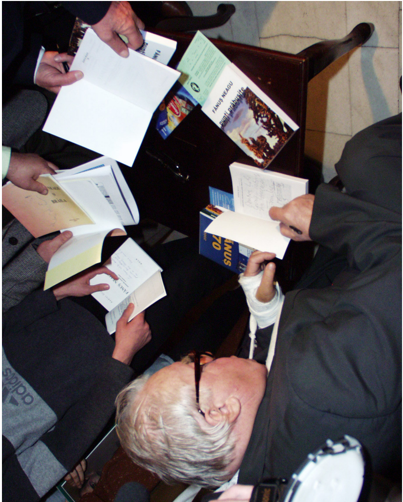
Sesiune de autografe la 70 de ani