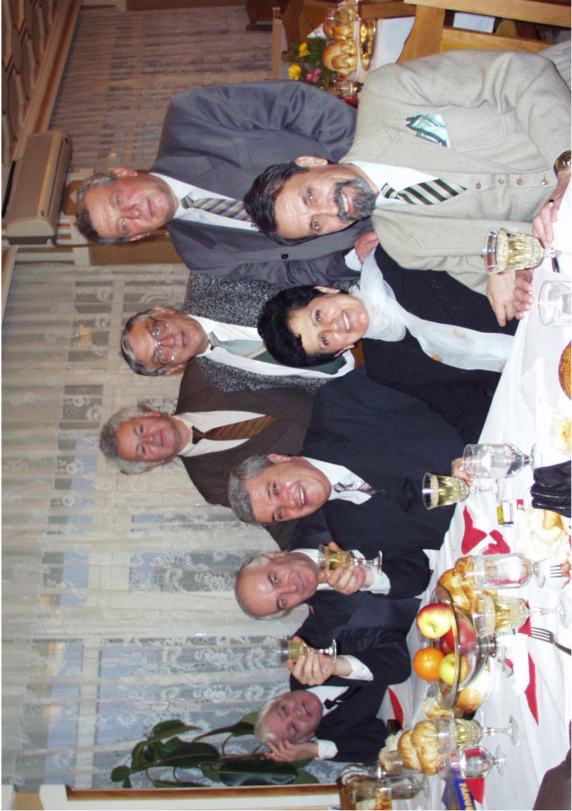
Cu scriitorii brăileni la agapa din 5 aprilie 2002