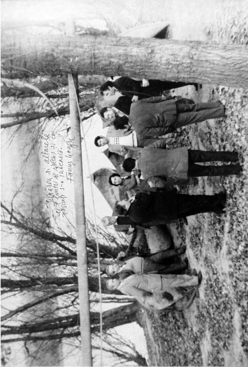
Dunărea și altarele ei...