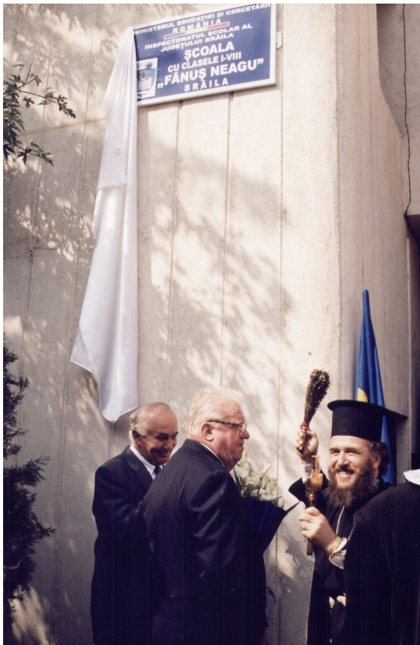
Botezul Școlii nr. 2, Brăila