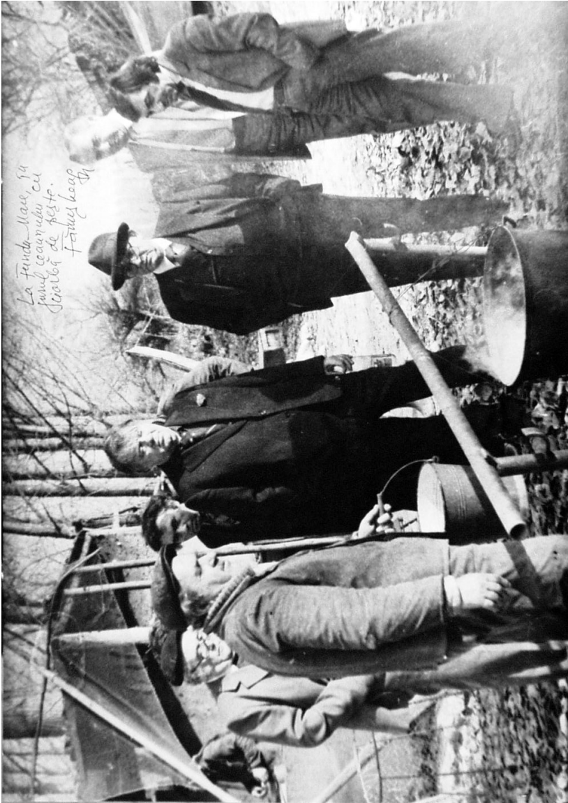
La cherhanaua de la Fundu Mare