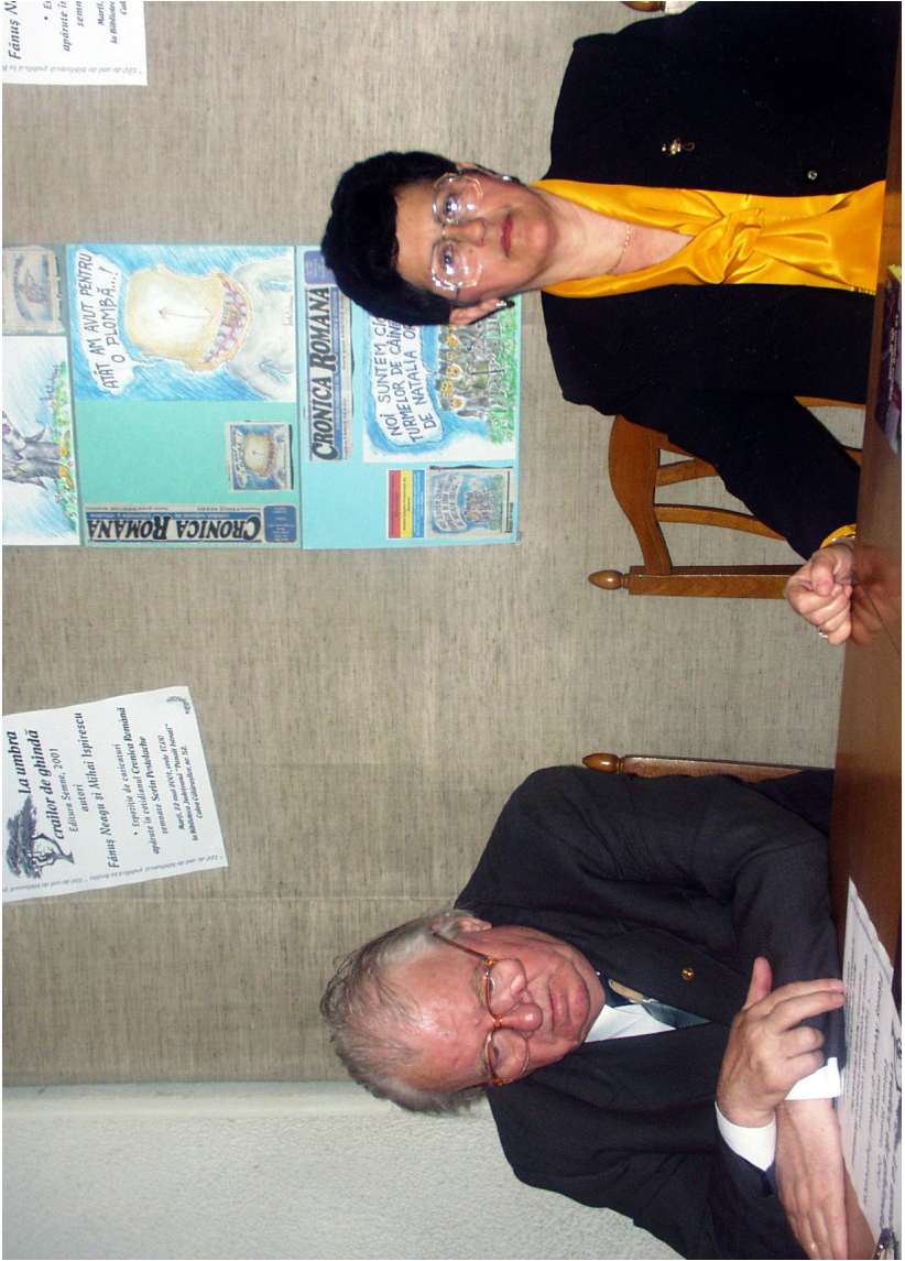
2001- La umbra crailor de ghindă

1752 de ani de la nașterea lui Ștefan cel Mare 1752 de ani de la nașterea lui Ștefan cel Mare Fănuș N - 6 - 6 - 6 - 6 apărând în seria de la Editura Ede