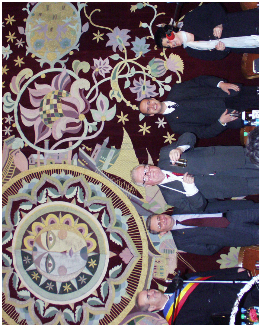
La Brăila mă simt bine și la 70 de ani - pe scena Teatrul Maria Filotti