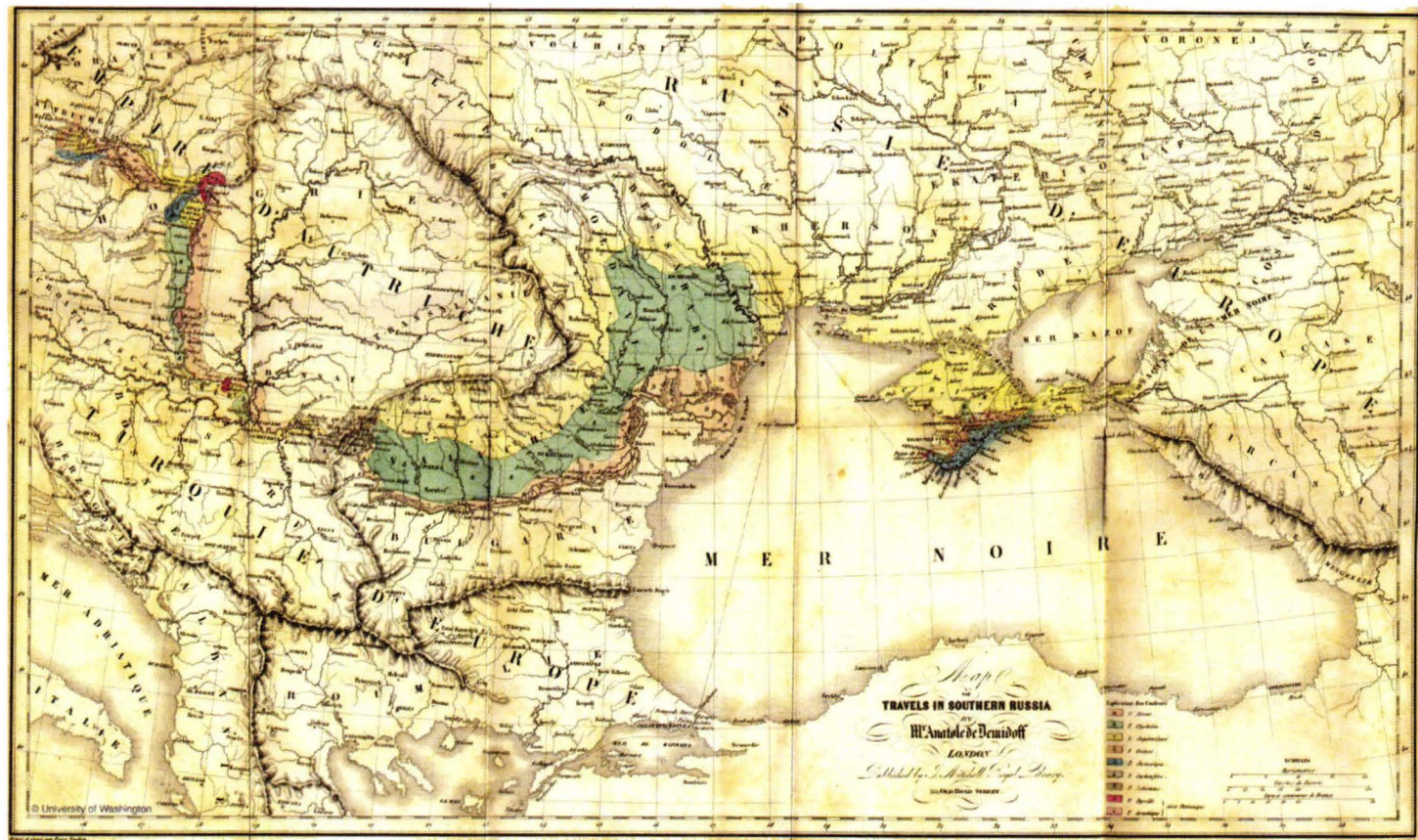
Fig. 4 – Carte du voyage dans la Russie méridionale exécuté en 1837 par Mr. Anatole de Demidoff.

Publiée par Ernest Bourdin Editeur. 1841