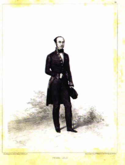
Fig. 2 – Frédéric le Play