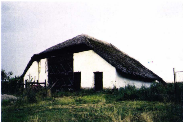
Șură șvăbească - Tășnad - județul Satu Mare România

Schwäbische Scheune - Trestenberg - Kreis Sathmar - Rumänien