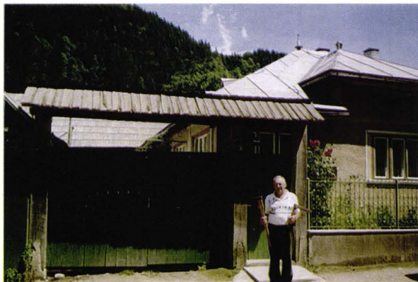
Casă de țipseri cu poartă marmaroseană - Vișeu de Sus - județul Maramureș - România Zipserhaus mit marmaroscher Tor - Oberwischau Kreis Marmarosch - Rumänien