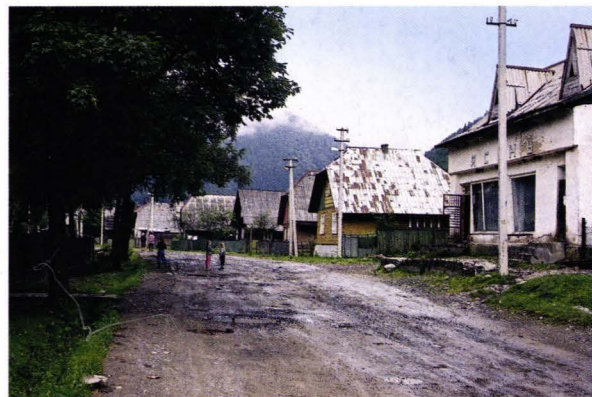
Strada principală din Nimețka Mokra - Ucraina Die Hauptstraße in Deutsch Mokra - Ukraine