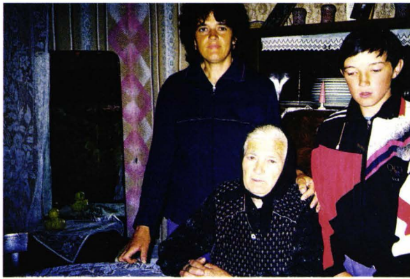
Familie mixtă (șvabi - români) - Craidorolț - județul Satu Mare - România Gemischte Familie (Schwaben-Rumänen) - Darotz - Kreis Sathmar - Rumänien