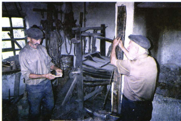
În atelierul fierarului - Hodod - județul Satu Mare România In der Werkstatt des Schmiedes - Kriegsdorf Kreis Sathmar - Rumänien