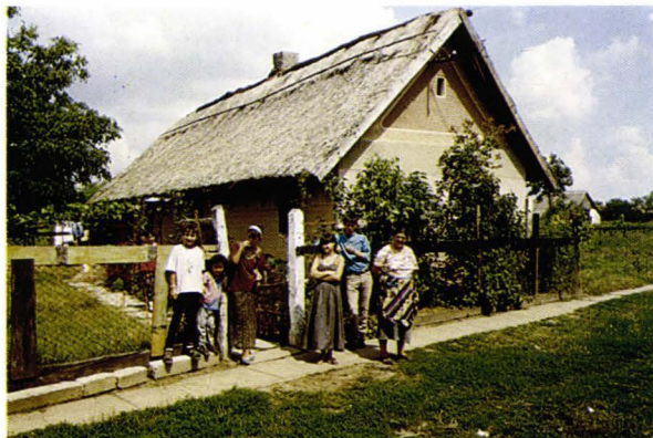
Casă de rromi - județul Satu Mare - România Tigeunerhaus - Kreis Sathmar - Rumänien