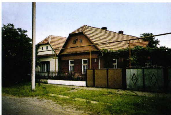
Case șvăbești din Pavsyno - Ucraina Schwabhäuser aus Pauching - Ukraine