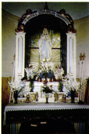
Altarul Sfintei Maria - Biserica romano-catolică - Turulung - județul Satu Mare - România Altar der Muttergottes - Römisch-Katholische Kirche - Turterebesch - Kreis Sathmar - Rumänien