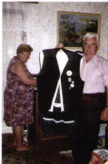
Costum popular slovac din Ungaria Slowakische Tracht aus Ungarn