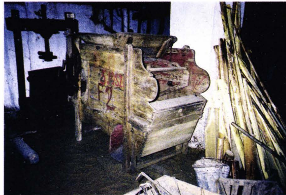
Șură șvăbească. Interior - Tășnad - județul Satu Mare - România

Schwäbische Scheune - Trestenberg - Kreis Sathmar - Rumänien