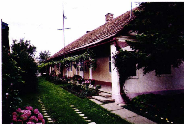
Casă șvăbească - Tășnad - județul Satu Mare - România Schwabenhaus - Trestenberg - Kreis Sathmar - Rumänien