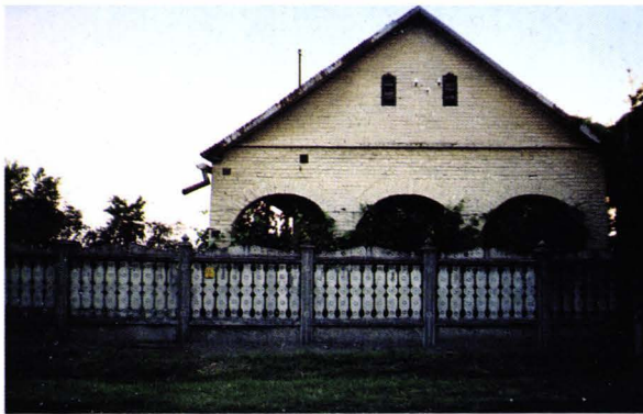
Casă maghiară construită de meșter șvab - Ungaria Ungarhaus von einem schwäbischen Meister gebaut - Ungarn