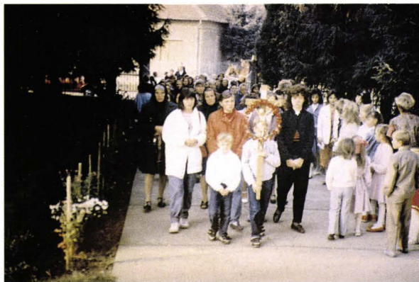
Procesiune. Hramul bisericii - Dindeștiu Mic - județul Satu Mare - România Prozession. Kirchweih - Beschened - Kreis Sathmar - Rumänien