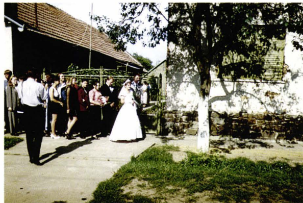
Nuntă șvăbească - județul Satu Mare - România Schwäbisches Hochzeitsfest - Kreis Sathmar Rumänien