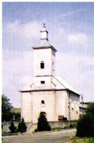
Biserica din Kuceava - Ucraina Die Kirche in Kutschawa - Ukraine