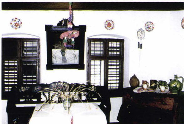
Interior maghiar - Bogdand - județul Satu Mare - România Ungarisches Interieur - Kreis Sathmar - Rumänien