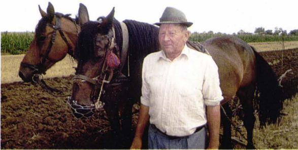
La arat - județul Satu Mare - România Ernte - Kreis Sathmar - Rumäni