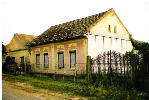
Case șvăbești din Ungaria Schwabhäuser aus Ungarn