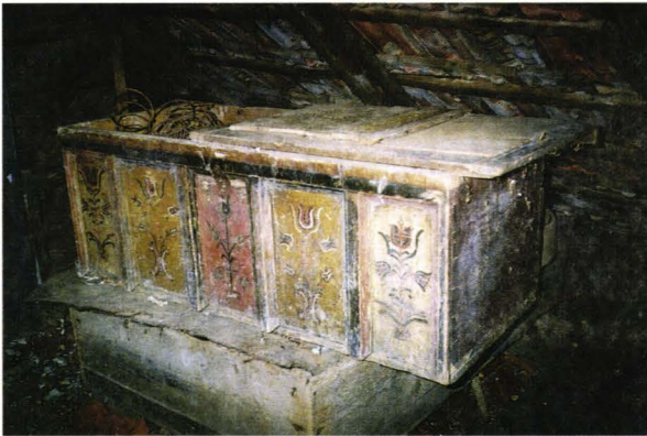
Ladă de zestre șvăbească (Depozitată în podul casei) - Terebești - județul Satu Mare - România Schwäbische Migifttruhe (Im Dachboden gelagert) Terebesch - Kreis Sathmar - Rumänien