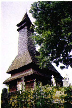
Biserica de lemn din Apșa de Mijloc - Ucraina Die Kirche aus Apșa de Mijloc - Ukraine