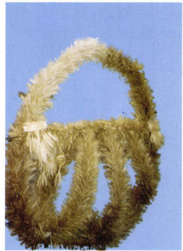
Cunună de seceriș - județul Satu Mare Ährenkranz - Kreis Sathmar