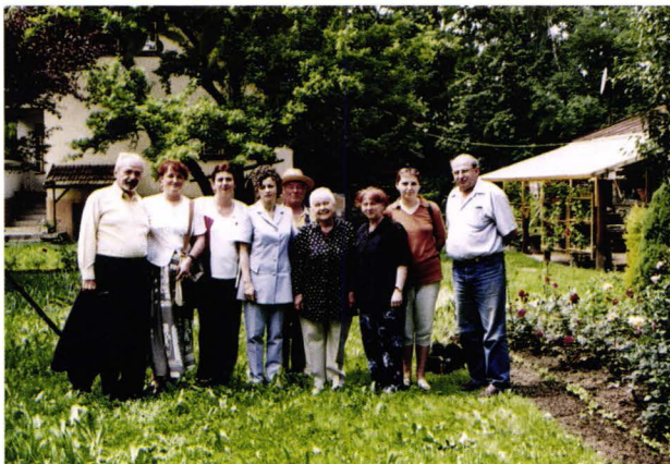
Echipa de specialiști pregătind programul de cercetare - Vișeu de Sus - județul Maramureș - România Das Team der Spezialisten bei der Vorbereitung der Feldforschung Oberwischau - Kreis Marmarosch - Rumänien