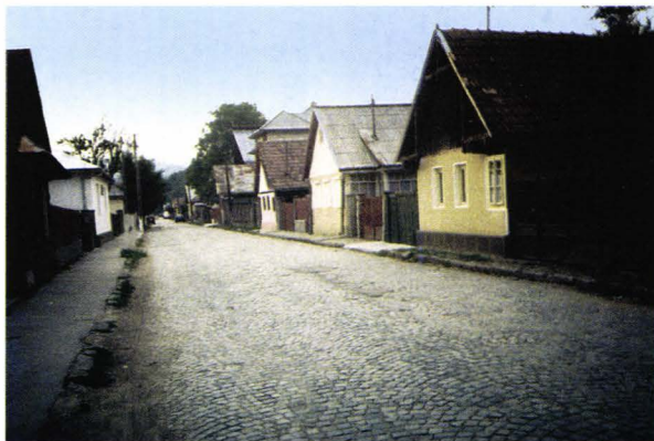
Case din cartierul Țipserai (al germanilor) - Vișeu de Sus - județul Maramureș - România Häuser aus der Zipserei (aus dem deutschen Stadtteil) - Oberwischau - Kreis Marmarosch Rumänien