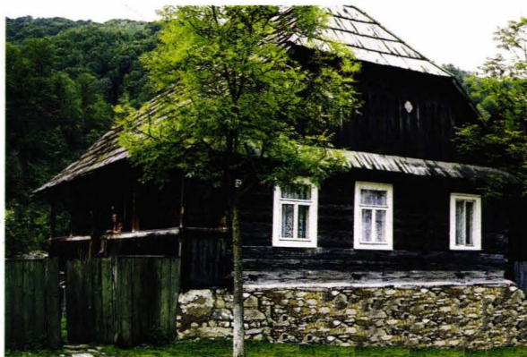
Casă șvăbească din Nimețka Mokra - Ucraina Schwabenhaus aus Deutsch Mokra - Ukraine