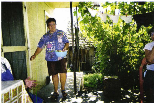
Tânăra de etnie germană - Tășnad județul - Satu Mare - România Deutsches Mädchen - Trestenberg - Kreis Sathmar - Rumänien