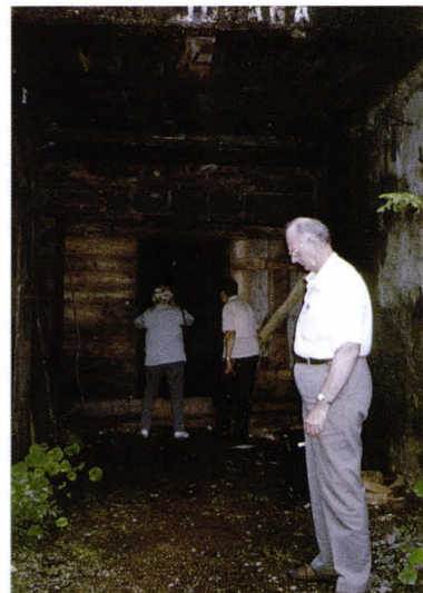
Echipa de specialiști - Smolnik - Slovacia Das Team der Spezialisten - Schmöllnitz Slowakei