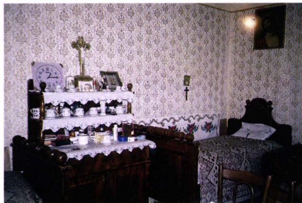
Interior șvăbesc - județul Satu Mare - România Schwäbisches Interieur - Kreis Sathmar Rumänien