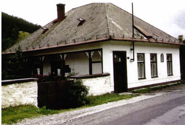
Casă veche de țipseri - Smolnik - Slovacia Altes Zipserhaus - Schmöllnitz - Slowakei