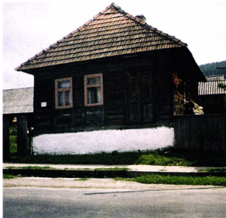
Casă de ucraineni - Ruscova - județul Maramureș - România Ukrainisches Haus - Ruscova - Kreis Marmarosch - Rumänien