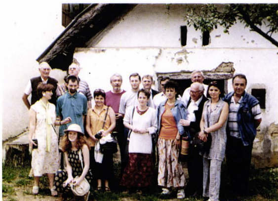
Echipa de specialiști - Belciug - județul Satu Mare România Das Team der Spezialisten - Bildegg - Kreis Sathmar - Rumänien