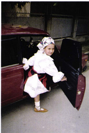
Fetiță în costum popular - Apșa de Jos - Ucraina Mädchen in Tracht - Apșa de Jos - Ukraine