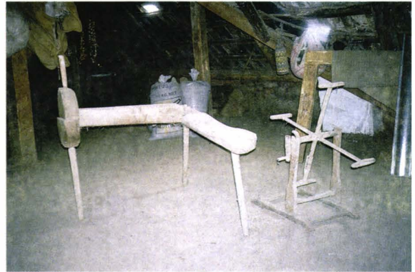
În podul casei. Meliță, vârtelniță. județul Satu Mare - România Auf den Dachboden. Gegenstände für die Verarbeitung des textilen Fader - Kreis Sathmar Rumänien