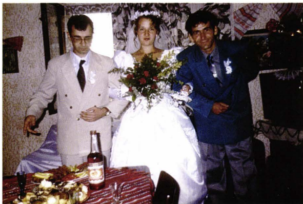
Nuntă românească, zona Codru - județul Satu Mare România Rumänisches Hochzeitsfest, Gebietes Codru Kreis Sathmar - Rumänien