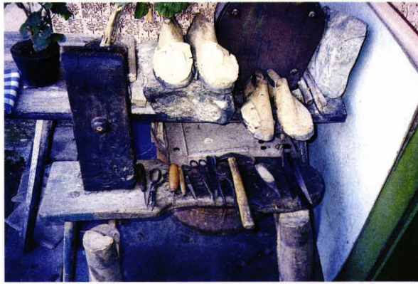
Unelte de pantofar - Craidorolț - județul Satu Mare - România Schusterwerkzeug - Darotz - Kreis Sathmar - Rumänien