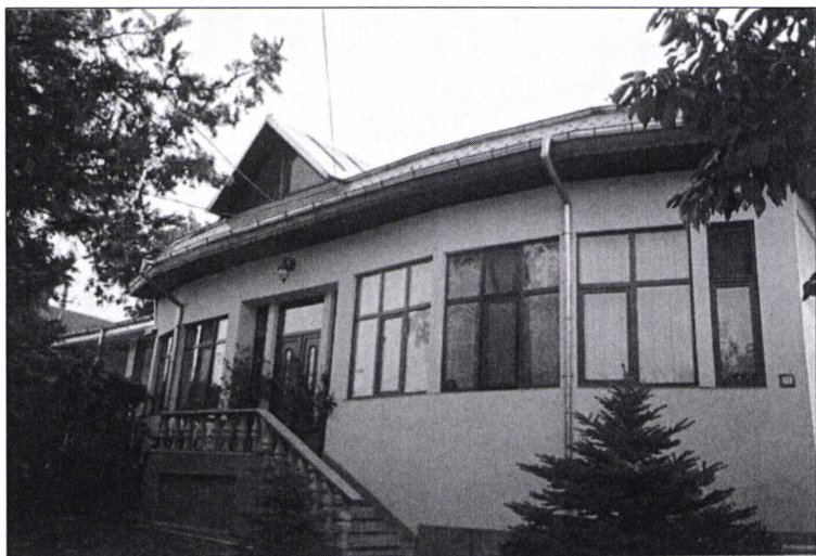
Casa din Bârlad a lui Manolache Costachi Epureanu, care a vândut-o lui Gheorghieș Emandi în 1868. Imaginile casei datează din anul 2000, când imobilul a suferit modificări; în partea stângă se văd stâlpii de la cerdacul din secolul al XIX-lea