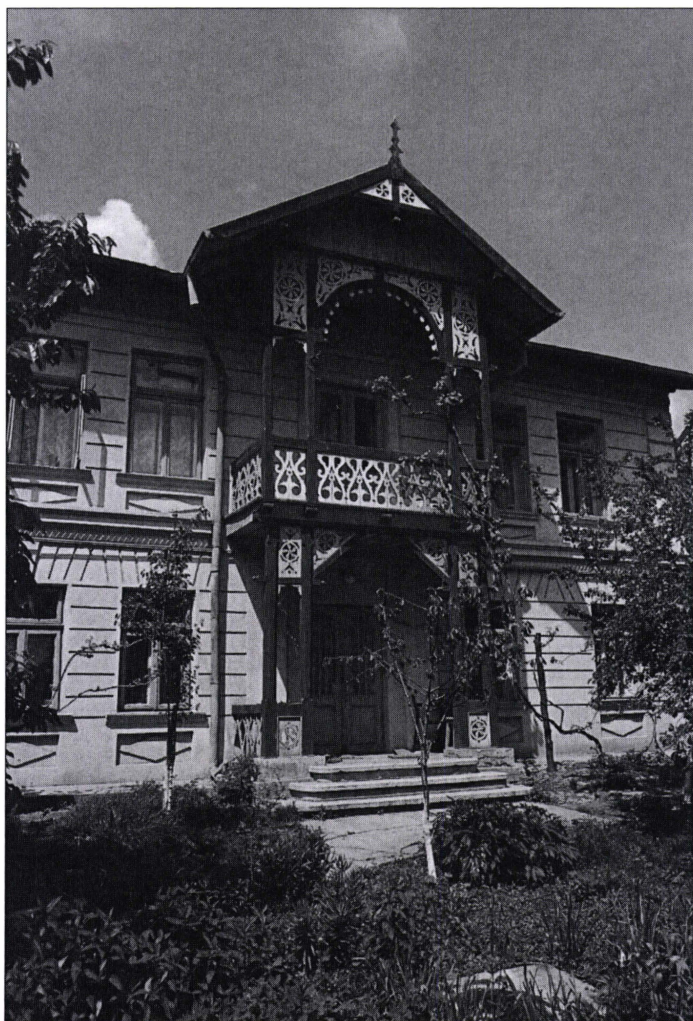
Casa Tuduri, monument istoric, construită pe la 1840 de Iacob Kimber, strada Belvedere (astăzi bulevardul Epureanu nr. 3, Bârlad)