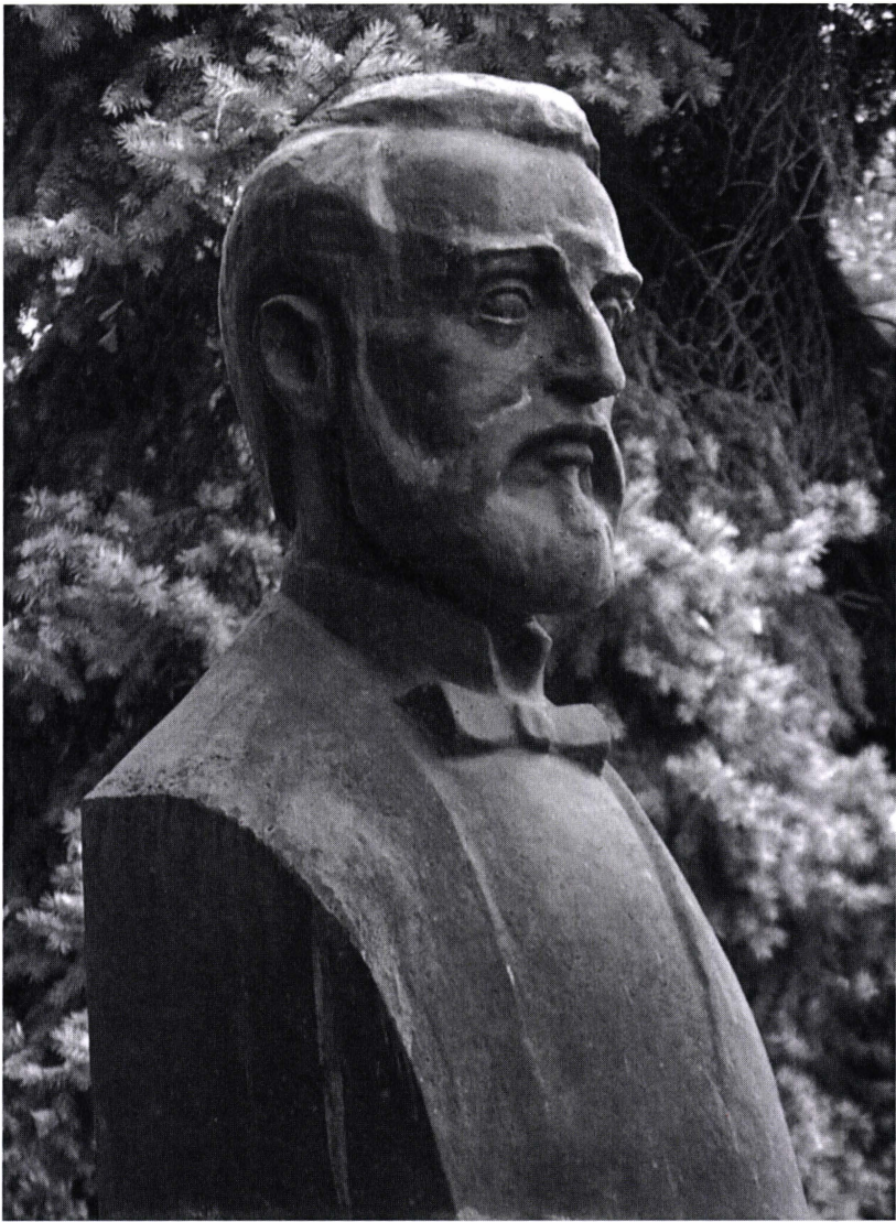
Bustul lui Nicolae Gane (în fața casei-muzeu din Iași) Autor, Dan Covătaru (1993, bronz)