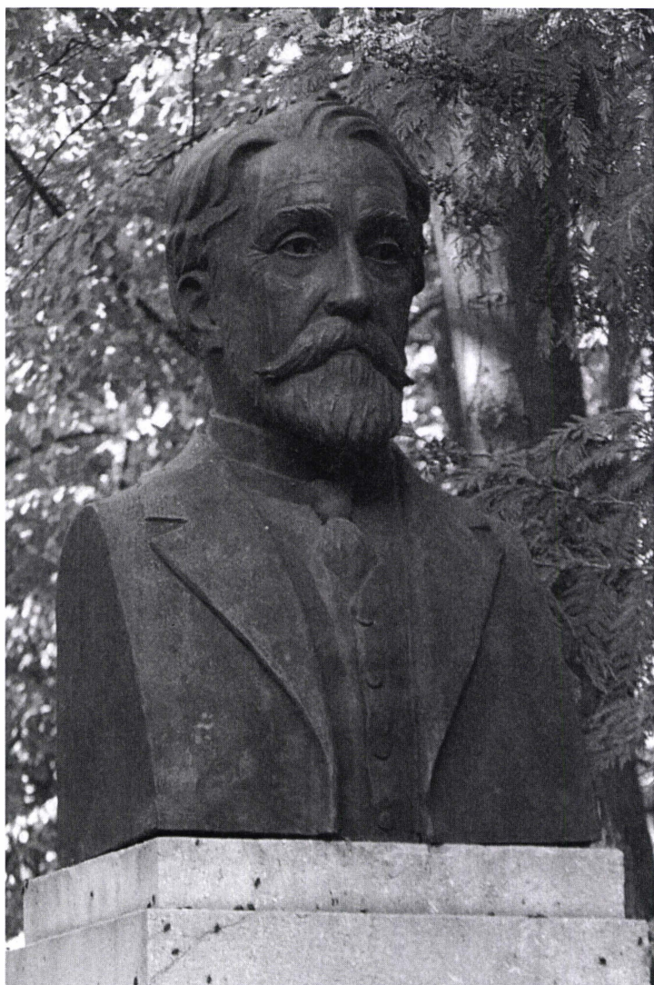
Bustul lui Nicolae Gane, în Parcul Copou, Iași. Autor, R.P. Hette (1943, bronz)