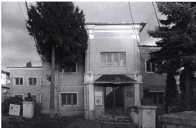
Casa memorială „Nicolae Gane” din Iași