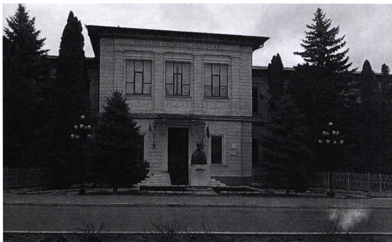
Colegiu Național „N. Gane” din Fălticeni