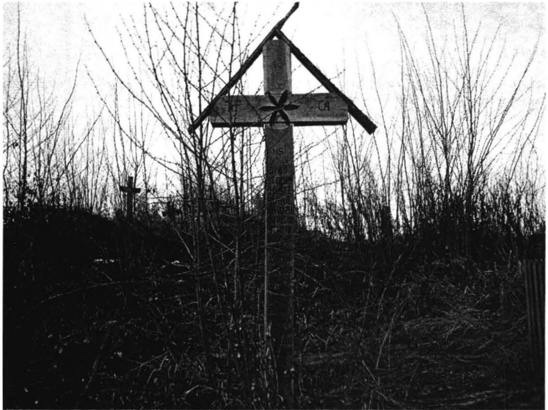
Cimitirul din Vidra (2005)