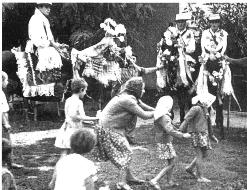
La casa miresei. Chereuș