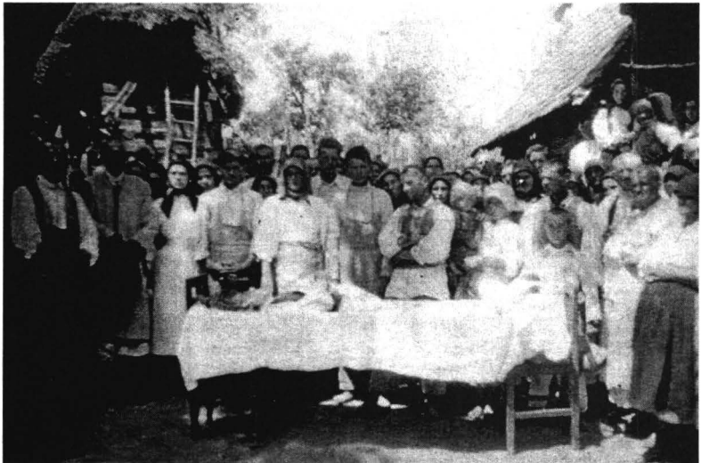
Înmormântare în satul Joia Mare (1/2 sec.XX)