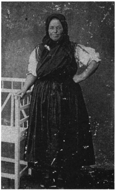
Bătrână în haine negre (1/2 sec.XX)