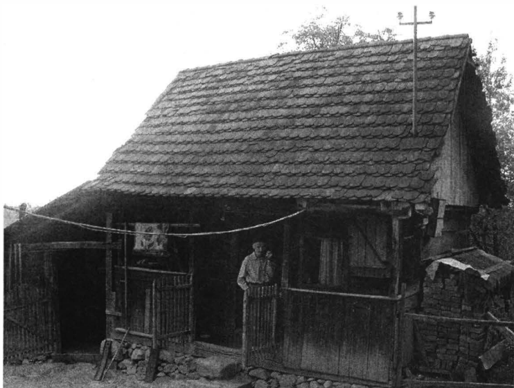
Casă țărănească din lemn. Vidra (2006)