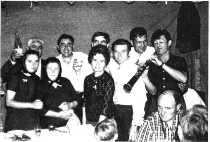
Petrecerea de nuntă. Chereluș (1965)