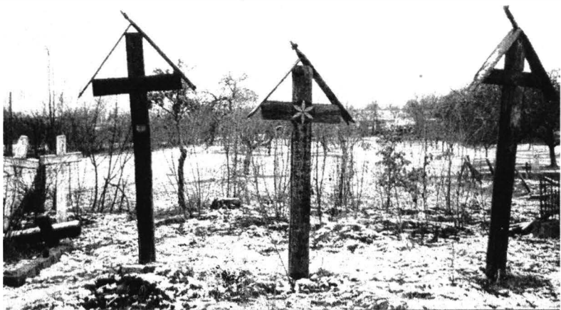
Cruci de lemn.Măgulea (2004)