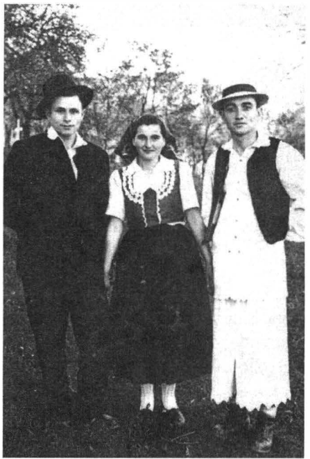
Tineri in costume de sărbătoare. Avram Iancu (1959)