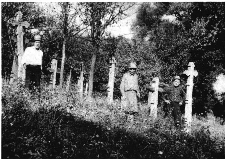
Bătrâni în cimitirul din Iercoșeni (1980).