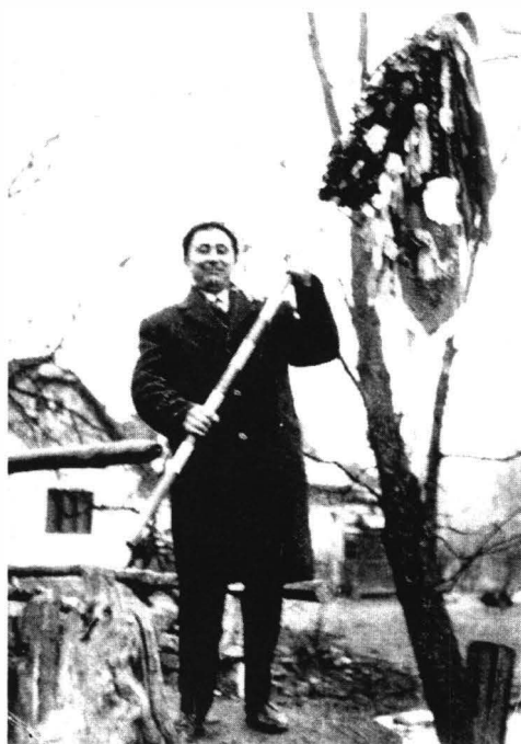
Steag de nuntă. Iacobini