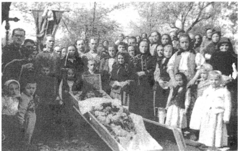
Înmormântare. Avram Iancu