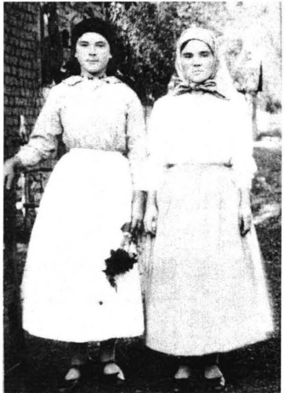
Femei tinere din zona Buteni-Almaș, în costume de sărbătoare