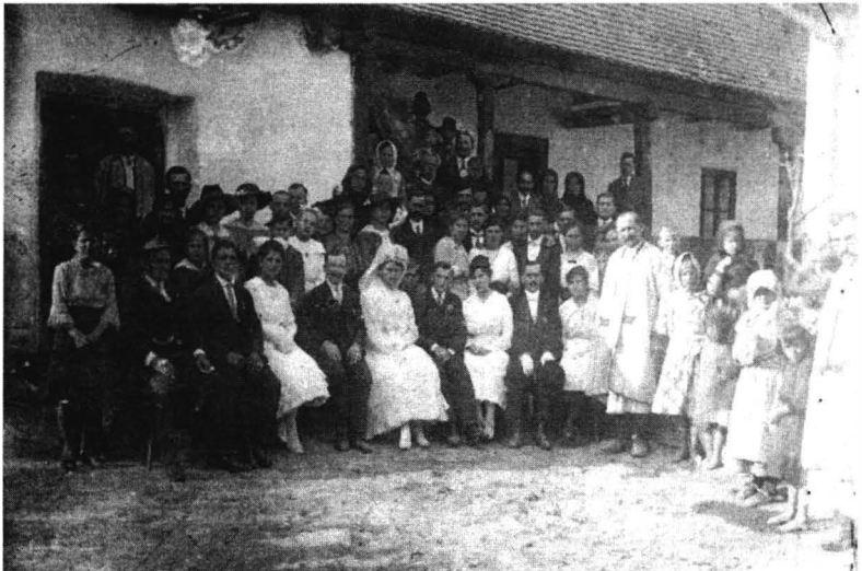
Nuntă în zona Buteni-Almaș (1/2 sec.XX)