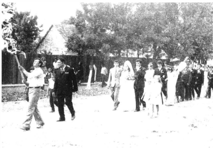
Alai de nuntă. Chereleş