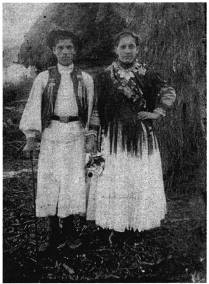
Tineri de la poalele Munților Apuseni în costume de sărbătoare