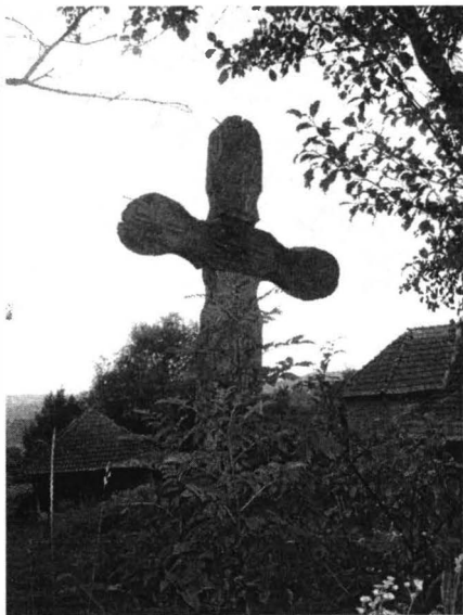
Troia. Vidra (2006)