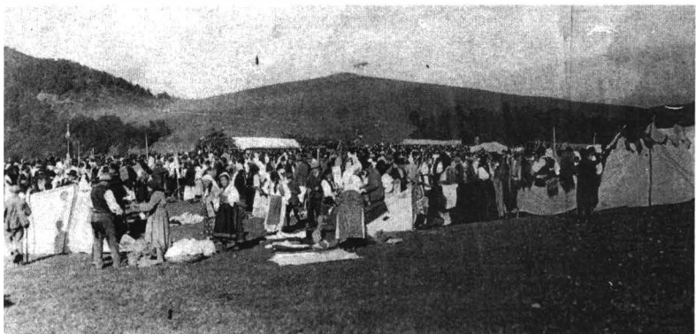
Târgul de la Găina (1929)