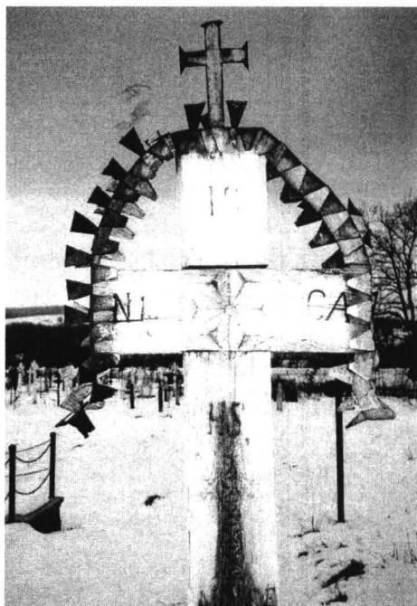
Cruce de lemn, Avram Iancu (2004)