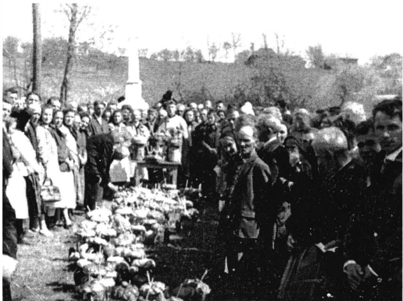
A doua zi de Paști. Ridicarea pauselor. Avram Iancu (1972)