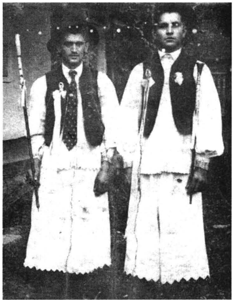
Chemători la nuntă din zona Buteni-Almaș ( 1931)