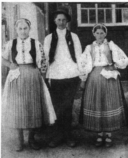
Tineri din Chisindia în costume de sărbătoare (1945)

Nana cu cârpă cu pană Nu dă gura dă pomană. Rochia nani cea –mpănată De șofer îi cumpărată Și-ar duce-o la uliță Da ii frică de șoferiță. 44