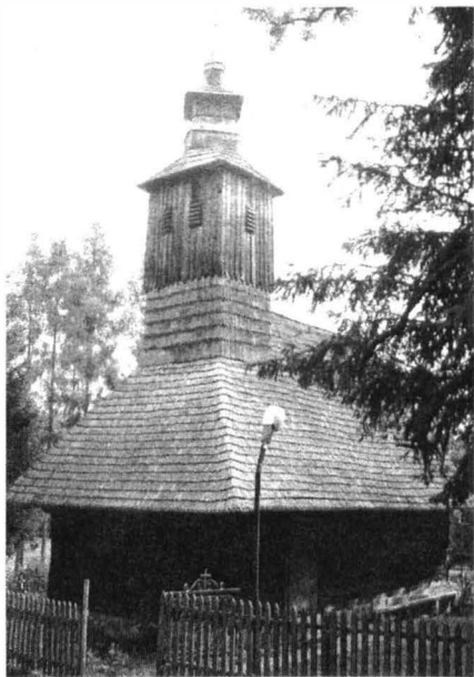
Biserica de lemn. Vidra (2006)