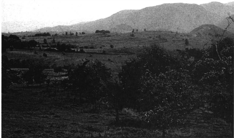
Vedere generală de la poalele Munților Apuseni (2006)