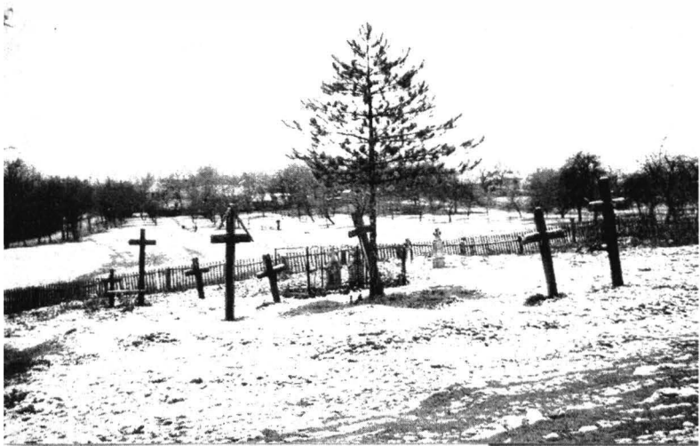
Cimitirul din Avram Iancu (2004)