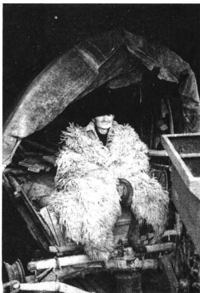
Moț crișan în căruța cu care „drumălește”(2004)