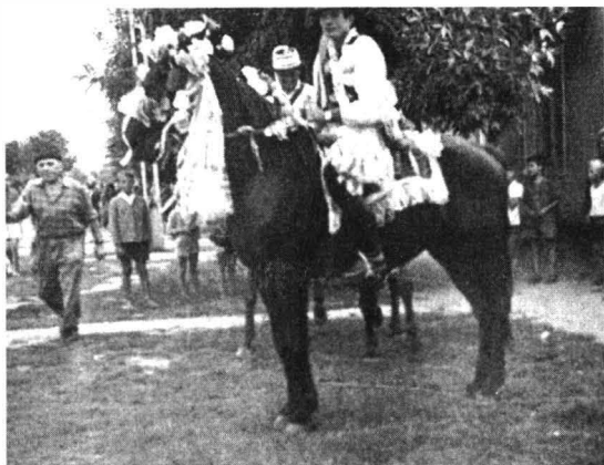
Chemători la nuntă din Chereuș