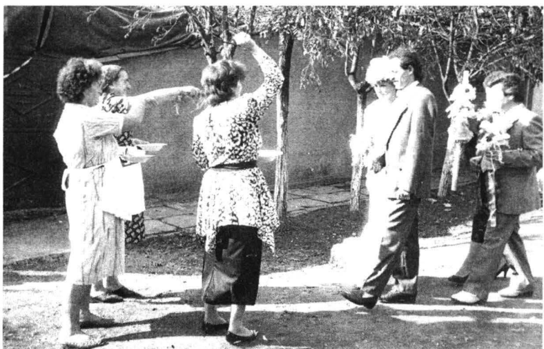
Primirea miresei la casa mirelui. Chereuș