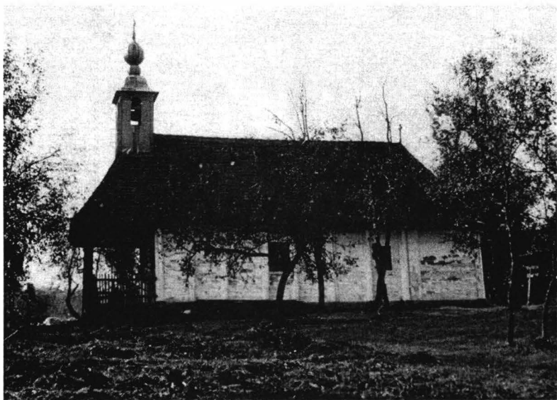
Biserica de lemn din cimitir. Iercoșeni.