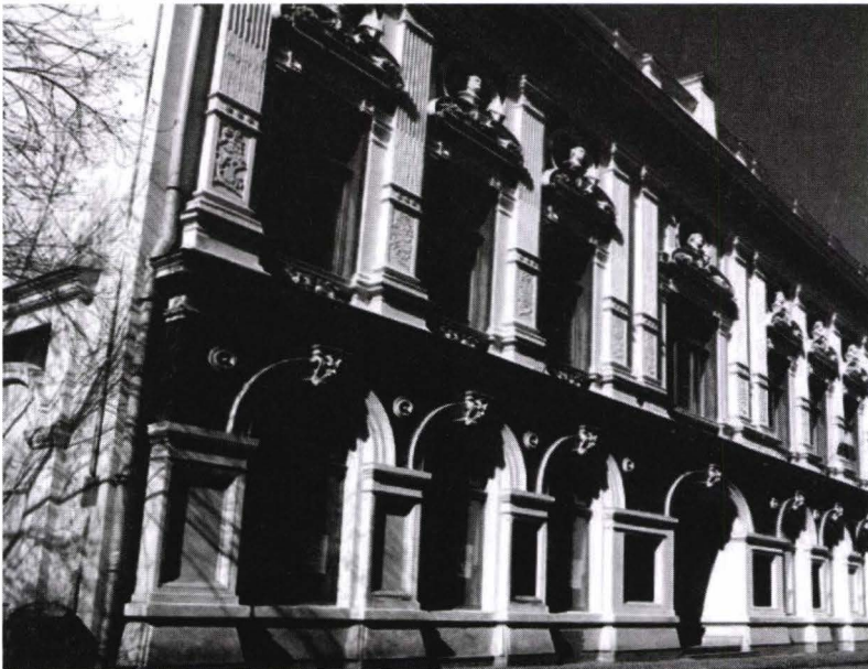
Noua Redută, construită între 1892-1894 pe locul celei vechi