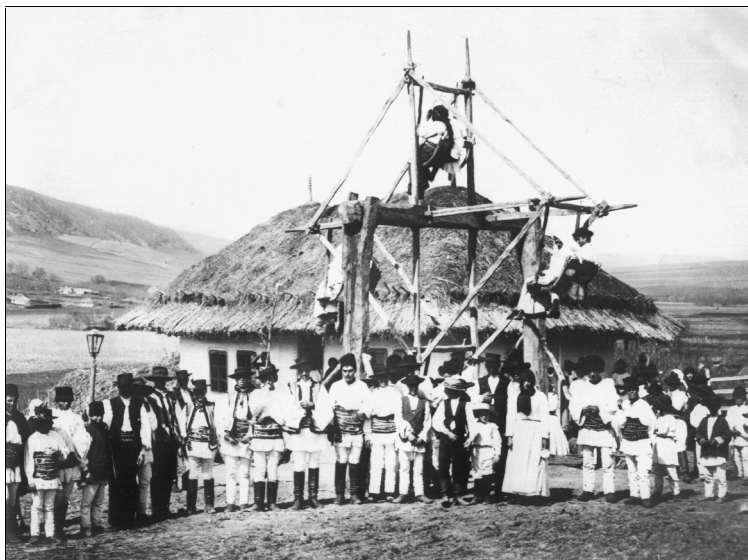
La horă, Cuci-Vaslui, 1904.