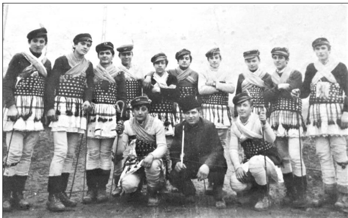
Rândurile, Muntenii de Sus, 1972