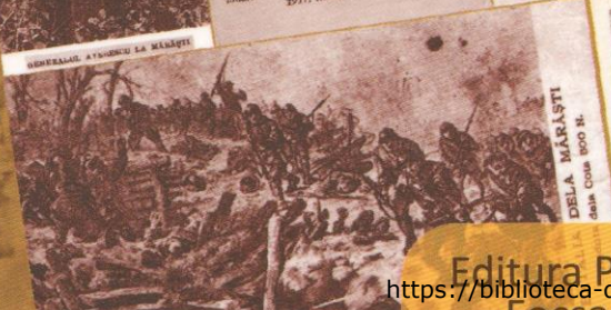
DELA MĂRĂȘTI din zona 1900 m.