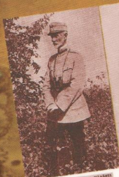
GENERALUL ATANASIU LA MĂRĂȘTI