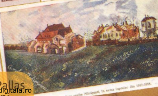
...pe șosea Mărășești, în urma luptelor din 1917-1918.