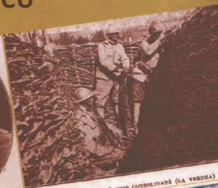
TRANȘEE ROMÂNĂ BINE CONSOLIDATĂ (LA VERDEA)