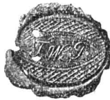
Pecetea lui Tudor Vladimirescu.