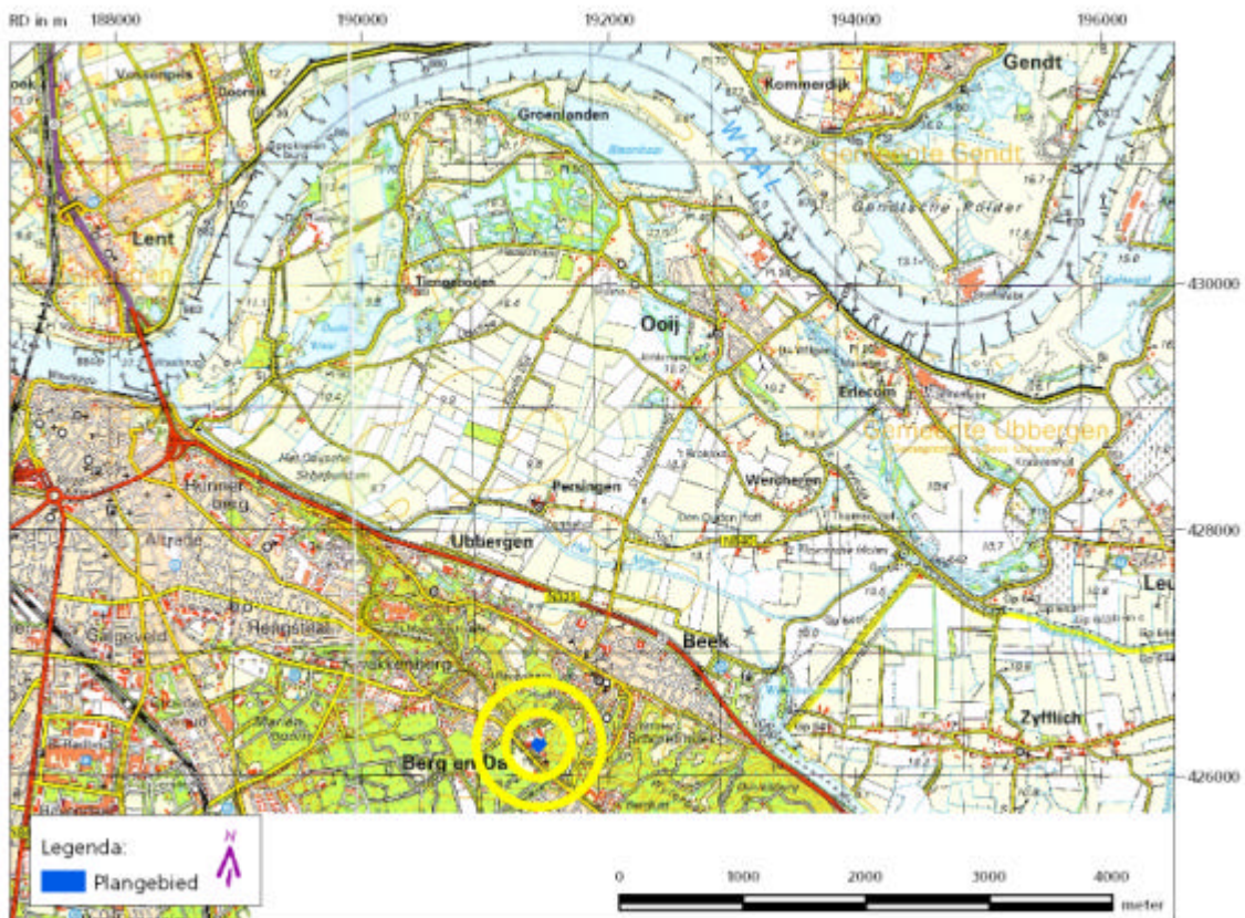
Fig. 1: Ligging van het plangebied in de regio.

Het plangebied ligt ten zuidoosten van de bebouwde kom van Berg en Dal aan de Oude Kleefsebaan 103. De totale oppervlakte van het plangebied bedraagt circa 1,7 hectaren. Het gebied wordt in het zuidwesten begrensd door de Oude Kleefsebaan. In het plangebied zal de huidige bebouwing worden afgebroken en een wooncomplex gerealiseerd worden.