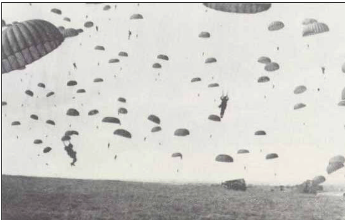
Fig. 4: Landing van het Eerste bataljon 508 PIR bij Berg en Dal.

Ondanks de voorspoedige landing werd de volgende twee dagen hevig strijd geleverd in Berg en Dal, Wyler, Beek-Ubbergen en op de Duivelsberg, waarbij een groep van het Eerste Bataljon onder luitenant John Foly dagenlang werd omsingeld. Vanuit het Duitse Reichswald vonden zware aanvallen plaats. De Duivelsberg ten oosten van het plangebied ("heuvel 75.9") veranderde verschillende malen van bezetter, wat gepaard ging met zware artilleriebeschietingen.