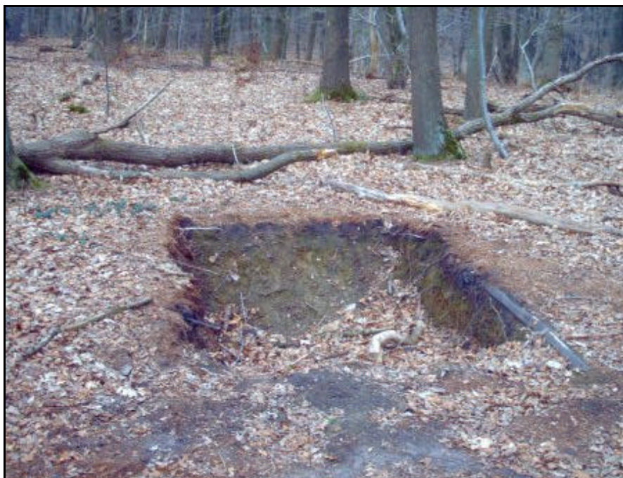
Fig. 5: Schuttersput uit de Tweede Wereldoorlog op de Duivelsberg, direct ten noordoosten van het plangebied.

Ondanks de voorspoedige landing werd de volgende twee dagen hevig strijd geleverd in Berg en Dal, Wyler, Beek-Ubbergen en op de Duivelsberg, waarbij een groep van het Eerste Bataljon onder luitenant John Foly dagenlang werd omsingeld. Vanuit het Duitse Reichswald vonden zware aanvallen plaats. De Duivelsberg ten oosten van het plangebied ("heuvel 75.9") veranderde verschillende malen van bezetter, wat gepaard ging met zware artilleriebeschietingen.