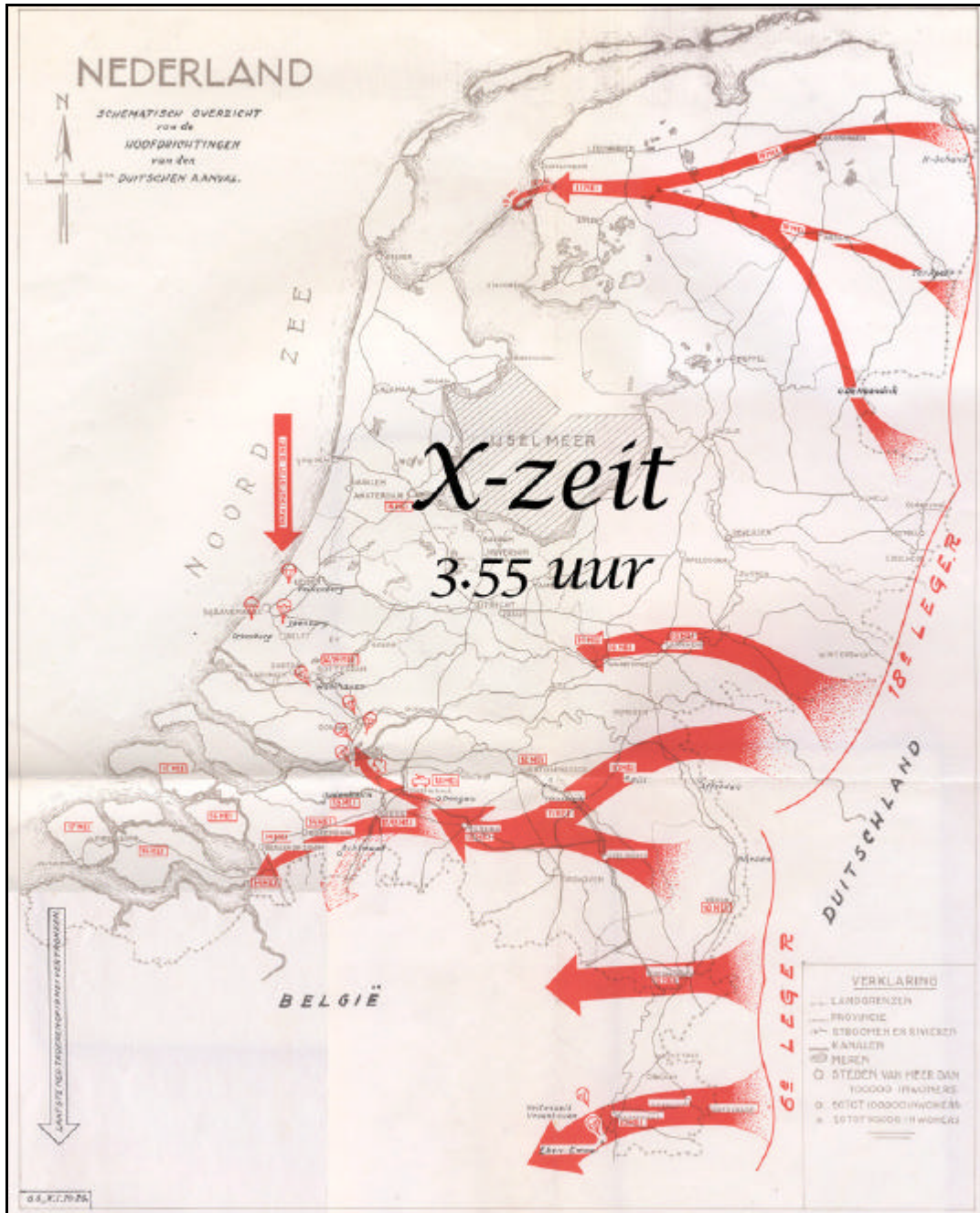
Fig. 2: Voornaamste bewegingen van het Zesde en Achttiende Leger in mei 1940.

Om een snelle doortocht van de Duitse troepen bij de inval op 10 mei 1940 te voorkomen, werden bij Nijmegen direct de verkeers- en spoorbrug over de Waal, de bruggen over het Maas-Waalkanaal en het viaduct over de Graafseweg door Nederlandse genietroepen opgeblazen. Tevens werden de Duitse stellingen bij de Batavierenweg beschoten vanuit Lent 1 . In de loop van de dag viel de stad niettemin in Duitse handen. In de omgeving van Berg en Dal, Beek en Wyler lijken de gevechtshandelingen op 10 mei 1940 beperkt te zijn geweest. Op de Duivelsberg aan het Wylersmeer, net ten oosten van het plangebied, hebben Duitse eenheden verborgen gelegen. Er zijn echter geen gegevens van daadwerkelijke beschietingen bekend.