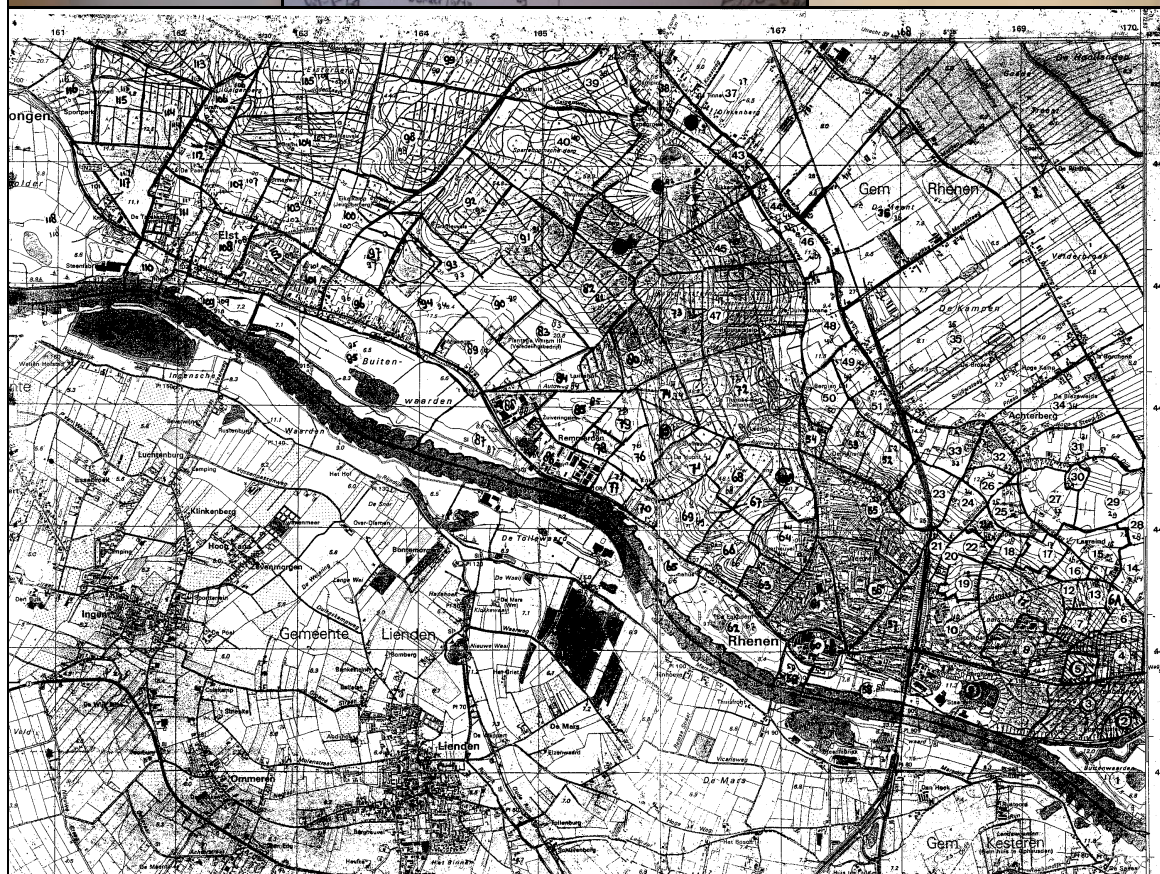
Afbeelding 1: De vondstadministratie van dhr. Mom (vondstkaartjes, mappen en overzichtskaart met vondstlocaties).