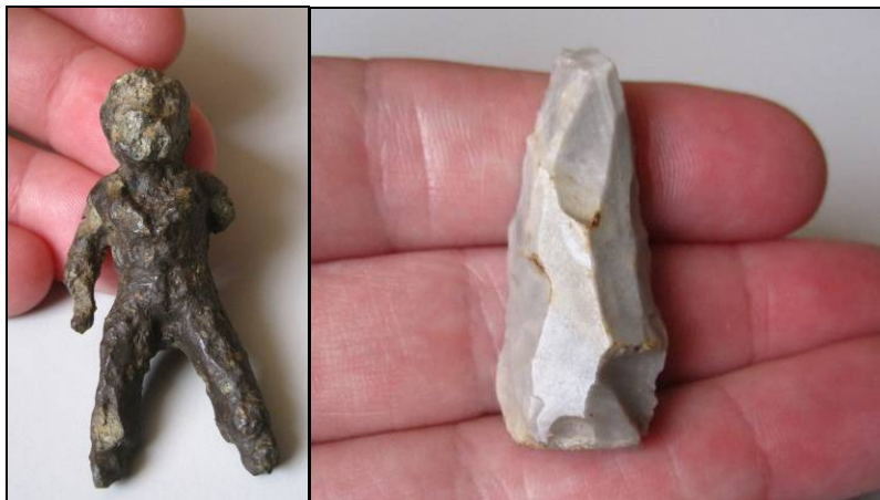
Afbeelding 3: enkele illustratieve vondsten uit de collectie Mom. Linkerzijde: vermoedelijk Romeins(?) beeldje, gemaakt uit een koperlegering; rechterzijde: jongpaleolithisch vuurstenen werktuig, waarschijnlijk een vuurslag.

Een belangrijk deel van de inventarisatie betrof de bewerking van de gegevens van de collectie Mom, die eveneens tot de museumcollectie behoort. Het leeuwendeel van het vondstmateriaal bestaat uit metaal en bewerkt vuursteen (zie afbeelding 3). Als eerste werd begonnen met een administratieve controle van deze gegevens, waarbij werd bekeken welke daarvan reeds in Archis waren opgenomen. Bij de 40 vondstnummers waarvoor dit gold, werd dit alsnog op de oorspronkelijke vondstkaarten aangegeven. De mappen met aanvullende informatie over delen van de collectie werden doorgenomen, waarna bij vondstnummers waar dit van toepassing was, op de oorspronkelijke vondstkaarten verwijzingen naar deze mappen werden aangebracht.