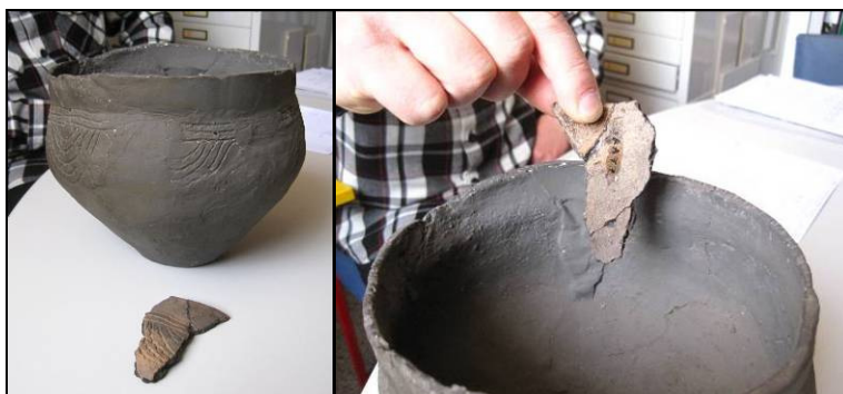
Afbeelding 2: de aangevulde en overgeschilderde urn met het missende fragment.

Zonder dat met het achterhalen van deze koppelingen serieus begonnen was, werd alvast één geval aangetoond en één geval opgelost. Een ongenummerde, met gips aangevulde en vervolgens bijna geheel overgeschilderde(!), urn werd weer herenigd met een onder een nieuw nummer in een museumvitrine aanwezig fragment van diezelfde urn die op dat gedeelte met gips was opgevuld (zie afbeelding 2). De koppeling van deze urn met een van de 147 beschreven vondstmeldingen moet echter nog worden uitgezocht. Hierbij kan vooral de versiering van de urn een bruikbaar aanknopingspunt vormen.