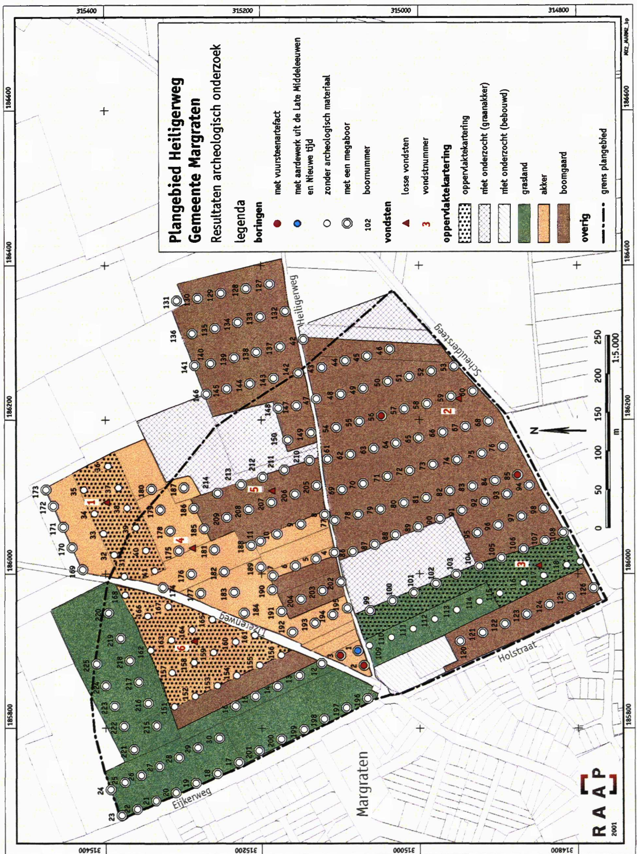
Figuur 2: De resultaten van het archeologisch onderzoek.