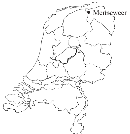
Afbeelding 1 De ligging van het onderzoeksgebied. De locatie Menneweer is het in oranje (voor hoge archeologische waarde) aangegeven rechthoekige terrein met het monumentnummer '5184', links op de kaart.