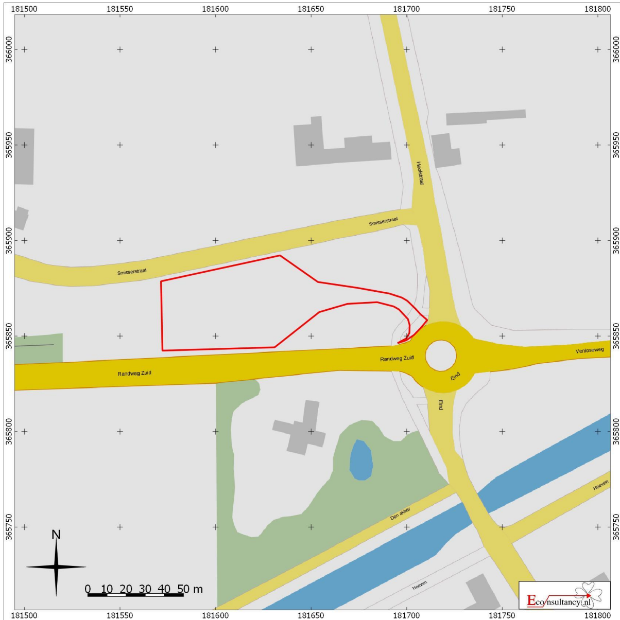
Fig. 1. Ligging van het onderzoeksgebied. Tekening: Econsultancy.

Het onderzoeksgebied is gelegen in de tangent van Smisserstraat en Randweg-Zuid, onmiddellijk ten noordwesten van de verkeersrotonde aldaar.