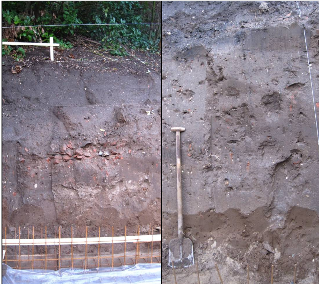
Afb. 3: links: overzicht putwand; rechts: detail putwand met onderin het esdek (beide foto's gezien richting het noordwesten)

Op basis van het noord- en oostprofiel kan aannemelijk worden gemaakt dat zich in de ondergrond van het plangebied een intact esdek heeft bevonden en zich deels nog steeds bevindt. Dit esdek kenmerkt zich als een egale bruine humeuze zandlaag met plaatselijk in de top fragmentjes baksteenpuin en houtskool.