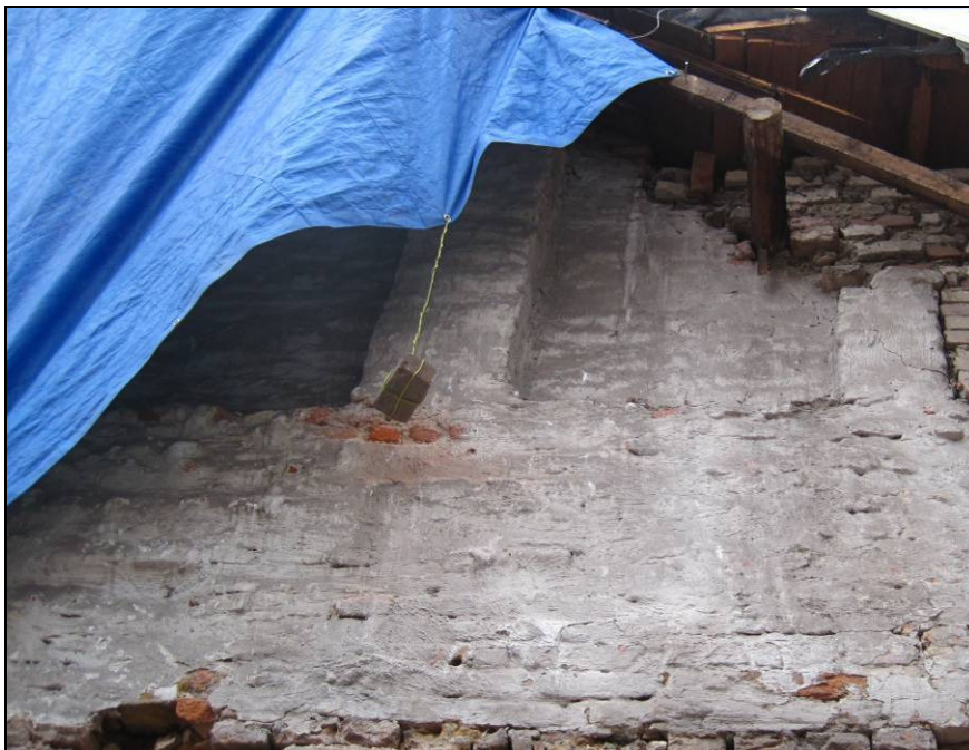
Afb. 6. De ingekorte daklijn ter hoogte van de bakstenen kolommen (locatie schouw?).

Op een hoger niveau is goed te zien dat de gevel terugspringt en dat zich in de (vermoedelijke) as van de gevel twee bakstenen kolommen bevinden (afb. 6). Het is verleidelijk om hierin schouwwingen te zien, maar deze interpretatie is niet zeker. Eventuele roetaanslag is namelijk niet (meer) zichtbaar omdat de gevel bepleisterd is. Tevens is de relatie met het vloerniveau niet waarschijnlijk omdat de wangen dan te hoog geplaatst zouden zijn geweest. Aan de achterzijde van Molenstraat 21A is recentelijk een dakkapel geplaatst. Hierbij is een deel van de oude gevel weggebroken. De huidige daklijn van 21A lijkt niet tot de aanlegfase van het gebouw te behoren want het was duidelijk te zien dat men deze heeft ingekort.