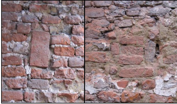
Afb. 5. Voorbeelden van enkele dichtgezette balkgaten.

Op een hoger niveau zijn vervolgens nieuwe balkgaten ingehakt ten behoeve van het opleggen van moerbalken. Boven dit vloerniveau is de muur voorzien van een witte bepleistering. Een medewerker van de aannemer (A. van Engelenhoven en zonen b.v. uit Ede) gaf te kennen dat het gesloopte pand aan deze zijde een eigen zijgevel bezat die naast de zijgevel van Molenstraat 21A was geplaatst. De geconstateerde rijen van balkgaten behoren dus tot twee voorgaande bouwfasen waarin de muur als 'gemene muur' functioneerde. Wellicht dat men voorafgaand aan het plaatsen van de zijgevel van Molenstraat 23 de buitenzijde aan de onderkant van de zijgevel van Molenstraat 21A iets heeft teruggehakt om de tussenruimte zoveel als mogelijk te verkleinen.