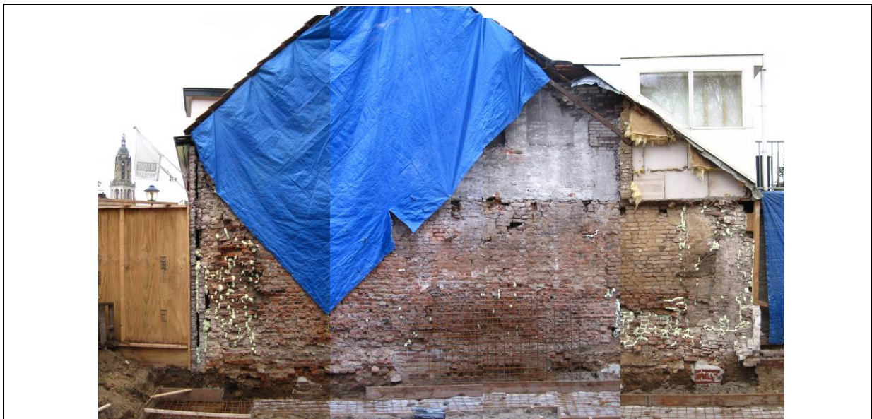
Afb. 4. Compositiefoto muurwerk Molenstraat 21A (gezien richting het zuidwesten)

De oostgevel van het naastgelegen pand Molenstraat 21A viel op omdat deze een flinke ouderdom uitstraalde (afb. 4). De gevel was dermate 'wrak' dat de aannemer, om nog enige samenhang in het metselwerk te verkrijgen, er toe was overgegaan om de kieren op te vullen met polyurethaanschuim (PUR-schuim). Plaatselijk waren tevens poeren ter ondersteuning gemetseld. De muur heeft een huidige lengte van 10 meter. Het is niet duidelijk of dit ook de oorspronkelijke lengte is. De gevel stond iets uit het lood (hellend naar het noordwesten). De bakstenen zijn in wild verband gemetseld met behulp van lichtgrijze en bruingrijze schelpkalkmortel. De bakstenen zijn onregelmatig van vorm, zachtgebakken en in het formaat 25/27 x 13 x 5/6 cm uitgevoerd. De tienlagenmaat is gemiddeld 71,25 cm (vier metingen). Navraag bij dhr. B. Olde Meierink van het Bureau voor Bouwhistorie en Architectuurgeschiedenis (BBA) wijst uit dat de muur op basis van deze tienlagenmaat en de baksteenformaten vermoedelijk in de tweede helft van de 14 e eeuw is te plaatsen. De muur is vermoedelijk eensteens breed en op staal gefundeerd. De fundering sprong beneden het maaiveld enkele centimeters uit. Dit is veroorzaakt door het feit dat men de stenen vanaf het toenmalige maaiveld heeft ingehakt en onder dit niveau niet.