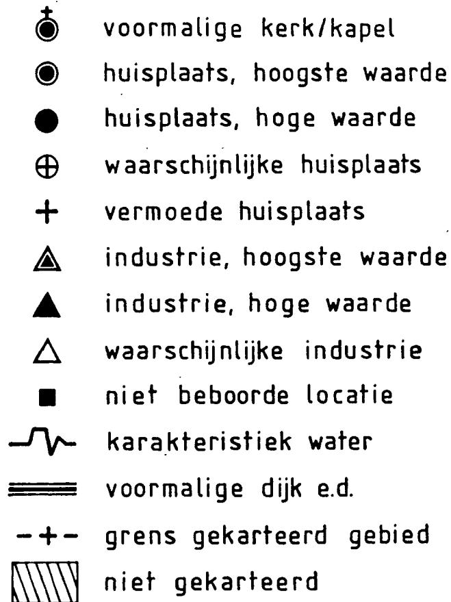
Figuur 2. Legenda.