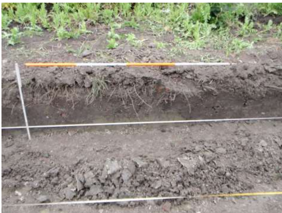
Afbeelding 2. Profiel met de ingravingen vanuit de bouwvoor in de kwelderlagen

Op het niveau van het eerste vlak waren geen sporen te zien. In het tweede vlak zijn een aantal ingravingen aangetroffen en de sloot die ook bij de sloopbegeleiding is gevonden. Het onderzoeksgebied heeft een bouwvoor van circa 60 cm dikte in het zuiden en 20 cm dikte in het noorden. In het noorden ligt de bouwvoor direct op kwelderlagen. Naar het zuiden toe komen er steeds meer ingravingen in de kwelder. Deze ingravingen worden aan de bovenzijde door de bouwvoor begrensd (zie afbeelding 2). Er is dus binnen het onderzoeksgebied geen sprake van echte wierdelagen, maar van afvalkuilen met aardewerk.