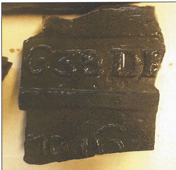
Afbeelding 4. fragment van een grafsteen met de jaartallen (1)638 en 167(?)?

De delen van grafstenen zijn ter plekke beoordeeld op inscripties en/of versieringen. Onbewerkte stukken grafsteen zijn teruggelegd in de grafkuil. De stukken bewerkte grafsteen en de complete grafsteen zijn verzameld en schoongemaakt. De complete grafsteen wordt overgedragen aan gemeente Delfzijl, de overige stukken worden afgestoten nadat ze gefotografeerd zijn.