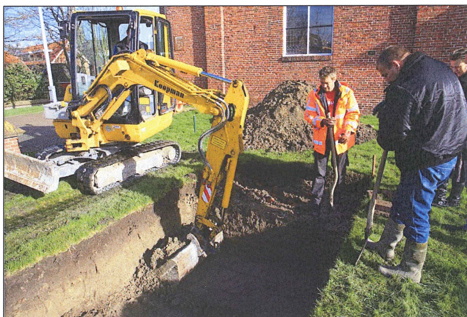
Afbeelding 2. nieuwe grafkuil, aangelegd onder archeologische begeleiding (de kraan is stilgezet voor de foto)

In de zuidwesthoek van het huidige kerkhof is een nieuwe grafkuil gegraven met een omvang van circa 4 bij 2,5 m en een ontgravingsdiepte circa 100 cm. Tijdens het graven van de grafkuil is besloten deze kleiner te maken dan oorspronkelijk de bedoeling was omdat in de NO-hoek van de kuil een stuk van een gemetseld graf zichtbaar werd. Om niet onnodig bestaande begravingen te verstoren is dit graf uitgespaard. De resterende ruimte was precies voldoende om de vijf grafkisten in te kunnen plaatsen.