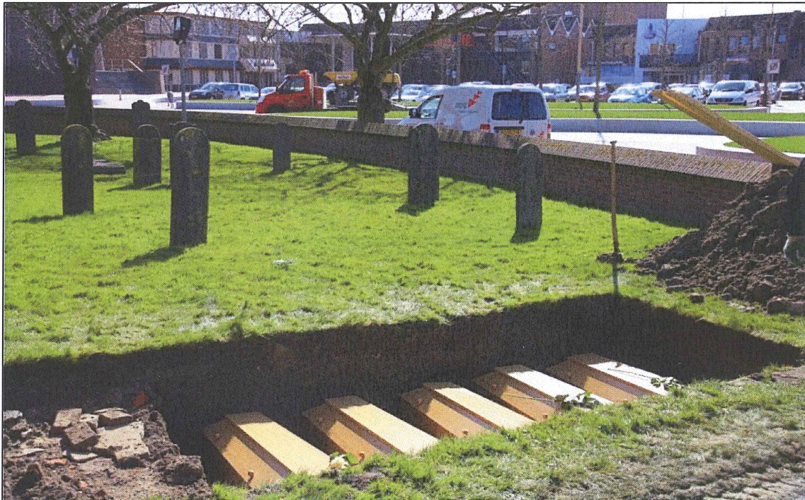
Afbeelding 5. de vijf grafkisten in het nieuwe graf