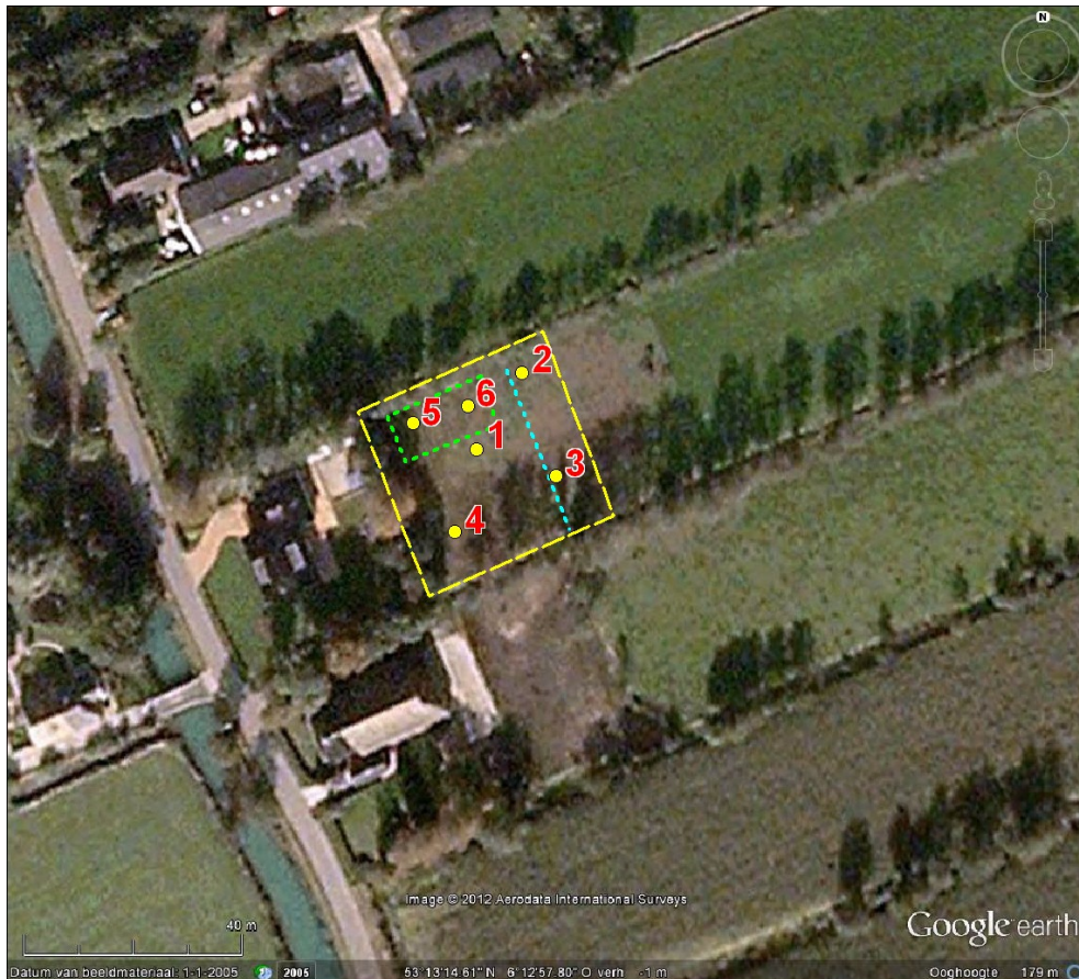
Figuur 6: Surhuizum, Miedwei 64: boorpuntenkaart. Ter plaatse van het groen omljnde deel is de te bouwen schuur gepland. De blauwe lijn geeft ongeveer de lokatie aan van een aan te leggen sloot met erfbeplanting. Als onderzoeksgebied is het grotere, geel omljnde gebied genomen. De genummerde punten geven de lokaties weer van de zes boringen.

Het veldonderzoek is uitgevoerd op 22 mei 2012. Er zijn zes boringen verricht (zie Figuur 6). Boringen 1 tot en met 5 zijn zo gelijk mogelijk verspreid over het onderzoeksgebied. De zesde boring is tussen boringen 1, 2 en 5 gedaan, omdat het pleistocene zand daar het hoogst ligt. De gemiddelde boordichtheid bedraagt veertig boringen per hectare. Deze dichtheid volstaat niet alleen voor een verkennend onderzoek, maar ook voor een karterend onderzoek. De boringen zijn gedaan met een edelmanboor van twaalf centimeter doorsnede. De opgeboorde grond is onderzocht door het laagsgewijs af te snijden in de boorkop. Het zand en het onderste veen zijn ook doorzocht op archeologische indicatoren door het nat te zeven op een zeef met mazen van vier millimeter.