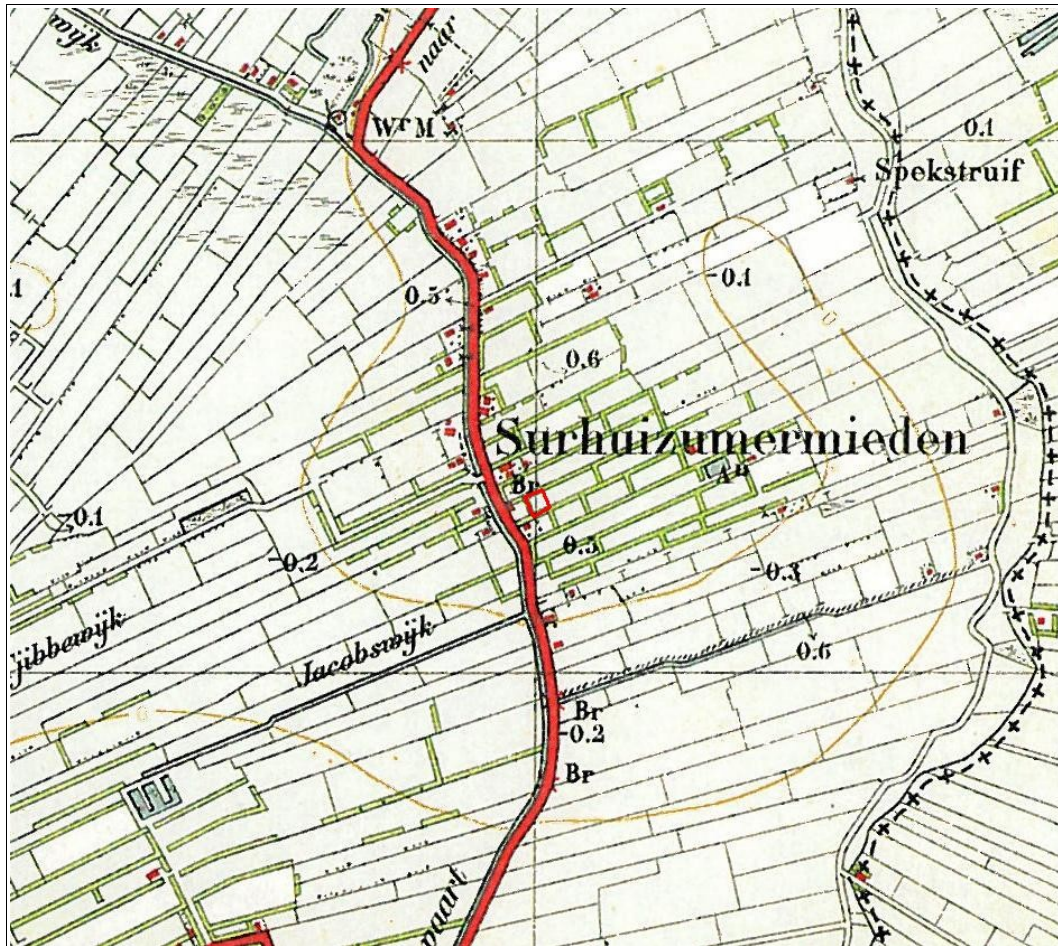
Figuur 5: Surhuizum, Miedwei 64: uitsnede van een topografische kaart uit 1929. Het plangebied is rood omlijnd. De vakken zijn één bij één kilometer.

gelegen gebieden rondom gebeurde dit door middel van sloten. Het land was in gebruik als grasland. Bij Surhuizumermieden stond in de 19 e eeuw al een tiental boerderijen. Ter plaatse van de Miedwei 64 wordt op kaarten tot en met 1953 geen bebouwing weergegeven. Op een kaart uit 1962 is voor het eerst bebouwing aanwezig. In het achter gelegen plangebied is op geen van de historische kaarten bebouwing aanwezig.