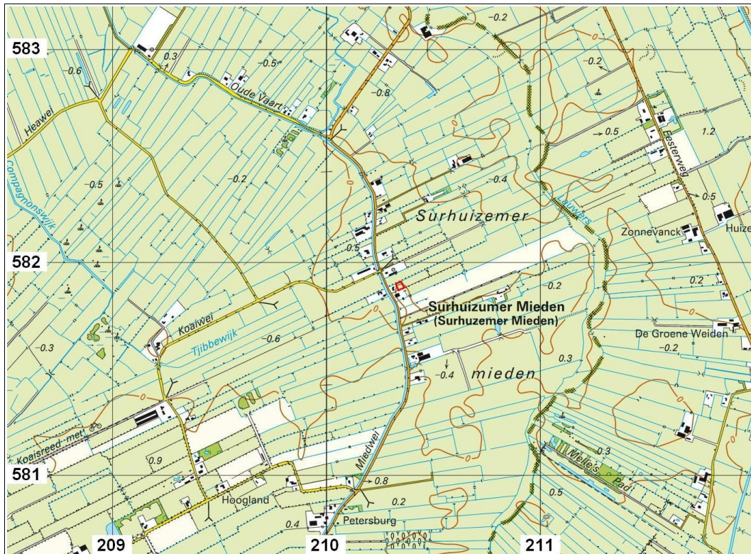
Figuur 1: Surhuizum, Miedwei 64 op een uitsnede van de topografische kaart 1:25.000. Het onderzoeksgebied is rood omlijnd.