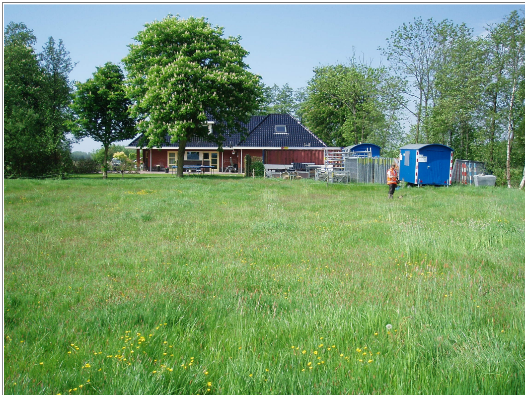
Figuur 2: Surhuizum, Miedwei 64: Foto genomen in zuidwestelijke richting. Rechts op de foto wordt boring 6 uitgevoerd. Daar zal ook de schuur gebouwd worden.

Miedwei 64 ligt in het buitengebied van Surhuizum in het buurtschap Surhuizumer Mieden (zie Figuur 1). Het plangebied ligt vanaf de weg gezien achter het woonperceel dus noordoostelijk van de woning. Tijdens het onderzoek maakte dit terrein nog deel uit van een perceel grasland (zie Figuur 2).