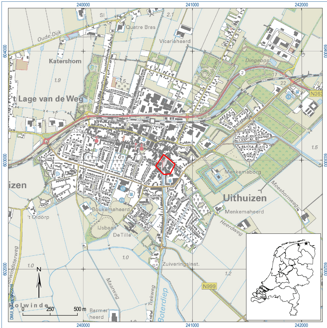
Figuur 1. Ligging van het plangebied (rood omlijnd); inzet: ligging in Nederland (ster).