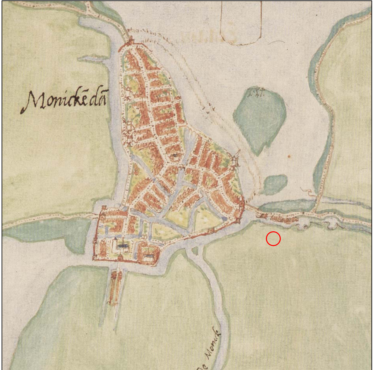
Figuur 2. Plattegrond van Monnickendam volgens Jacob van Deventer met de globale ligging van het plangebied (rode cirkel).