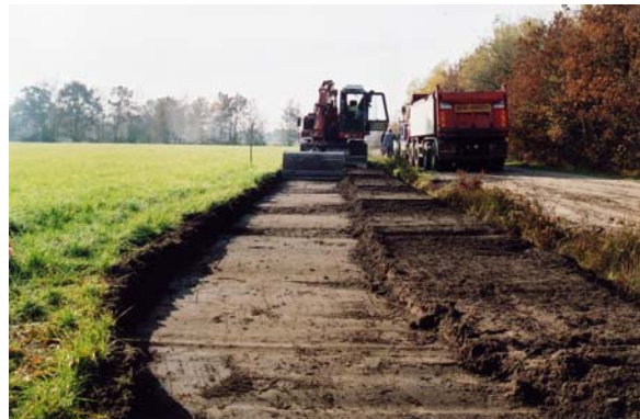
2 en 3. De werkzaamheden vanaf het noorden, waarbij alleen de bovenste 15 cm worden ontgraven