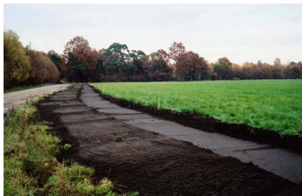
4. Er zijn geen archeologische sporen zichtbaar