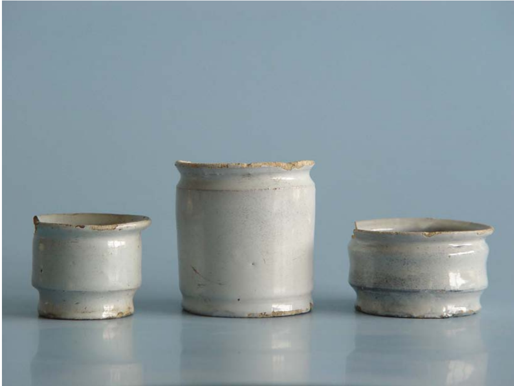
Afb. 7. Brielle, Nobelstraat 7-9-11. Zalfpotten (faience). Afmetingen van links naar rechts: 4.5, 7, en 4 cm hoog; 4.3, 6.3 en 5.9 cm diameter bodem. Uit 18 e (19 e )-eeuwse beerput (zie tekst).