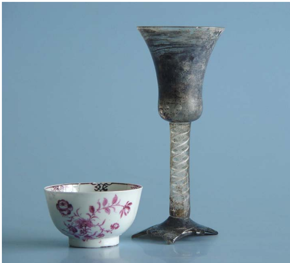
Afb. 8. Brielle, Nobelstraat 7-9-11. Slingerglas (h. 17.7 cm) en kop (porselein, Europees ?); h. 4.8 cm, diameter rand 7.9 cm). Uit 18 e (19 e )-eeuwse beerput (zie tekst).