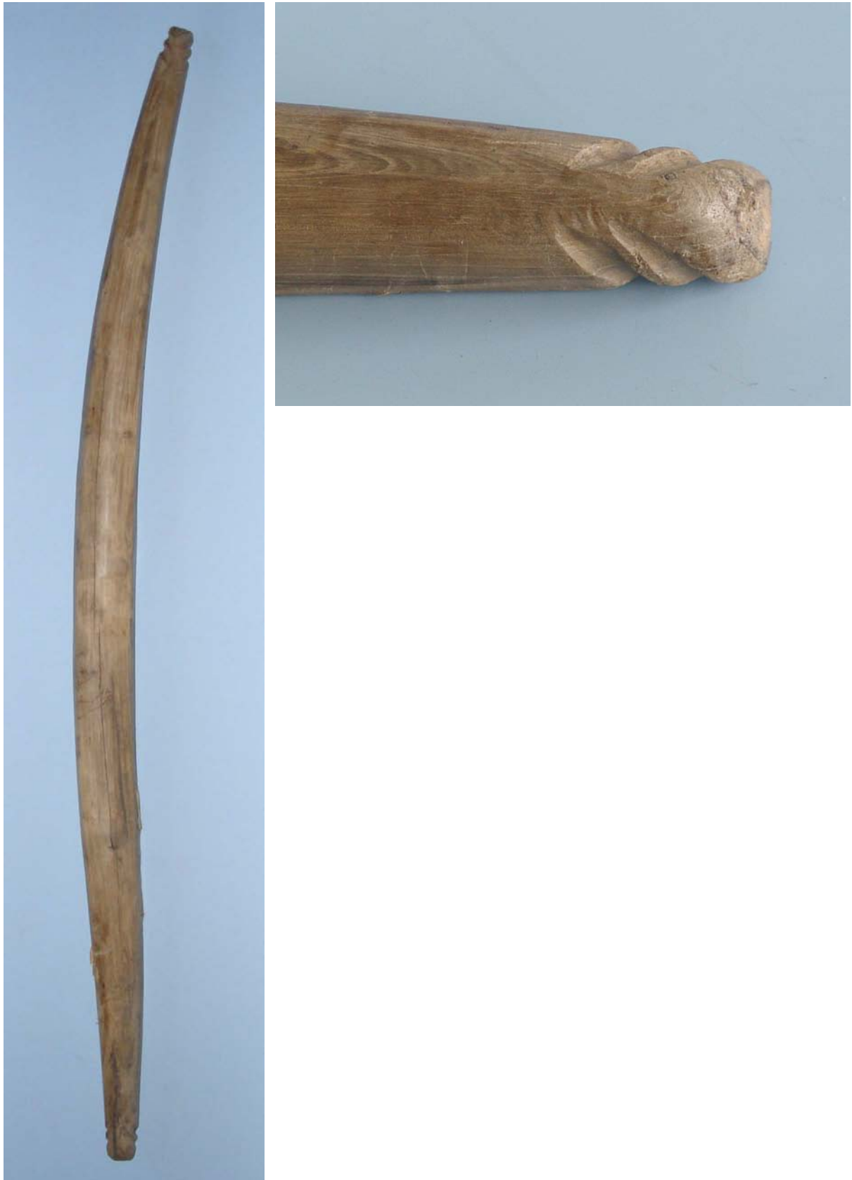
Afb. 5. Brielle, Nobelstraat 7-9-11. Houten juk (lengte 101,2 cm). Uit vuile laag tegen linker zijmuur van achterkamer Nobelstraat 9. Datering: 14 e eeuw (zie tekst).