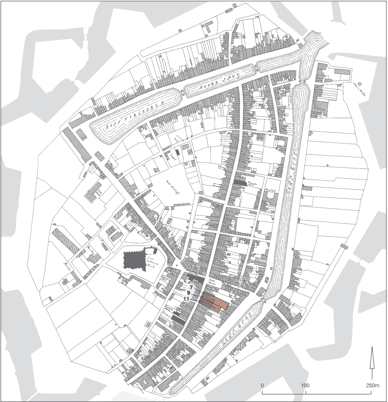
Afb. 2. Brielle, kadastraal minuutplan 1820 (naar Don 1992, afbeelding 23). Schaal 1:5000.