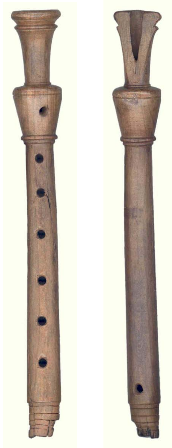
Afb. 6. Brielle, Nobelstraat 7-9-11. Fluit (schaal 1:1). Uit 18 e (19 e )-eeuwse beerput (zie tekst).