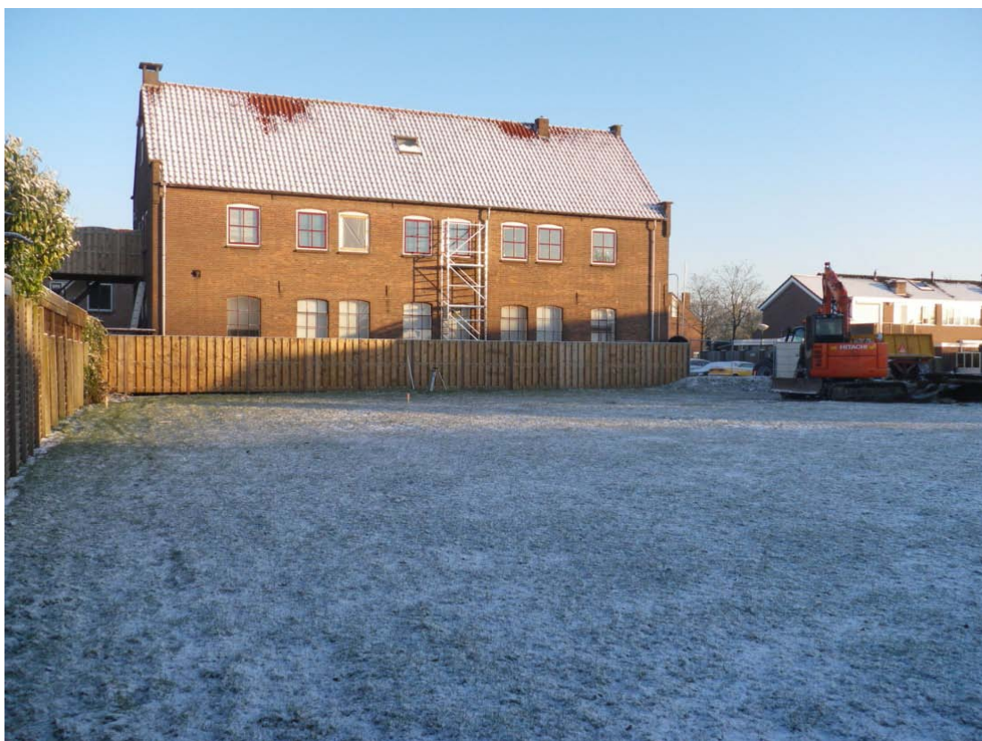
Figuur 2: De onderzoekslocatie voor aanvang van de graafwerkzaamheden, richting het noorden.