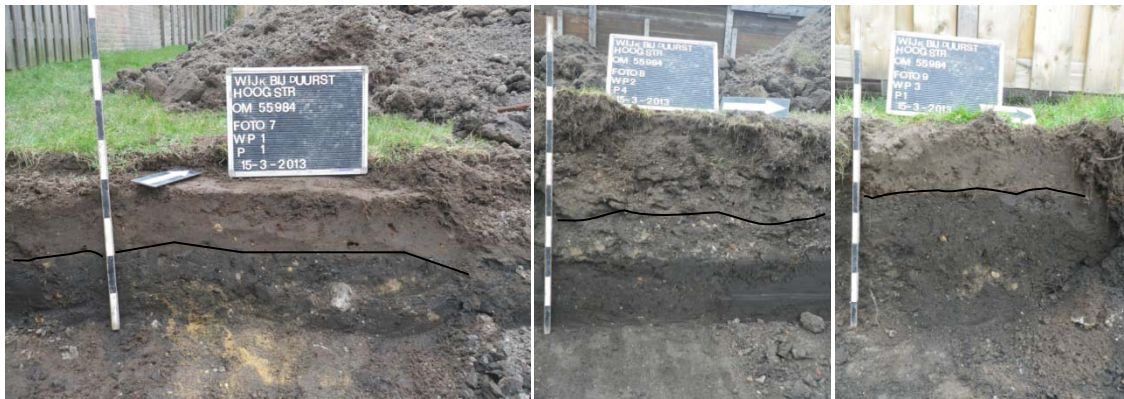
Figuur 4 De profielkolommen van werkput 1 t/m 3. Onder de bouwvoor is duidelijk de donkere laag (S1) zichtbaar.

Door de geringe diepte van de bouwput is in de profielen alleen het onderscheid tussen de bouwvoor (S9000) en de donkere laag (S1) te maken. In figuur 4 zijn de profielen weergegeven. Uit het onderzoek uit 2010 blijkt dat deze donkere laag minimaal 1 m en op sommige plaatsen zelfs 1,50 m dik is (Bouma, 2010). Op sommige plaatsen zijn in spoor 1 kluiten licht bruine sterk siltige klei waargenomen. Dit zijn waarschijnlijk vergraven stukken waarbij de (Karolingische) ondergrond naar boven is geraakt.