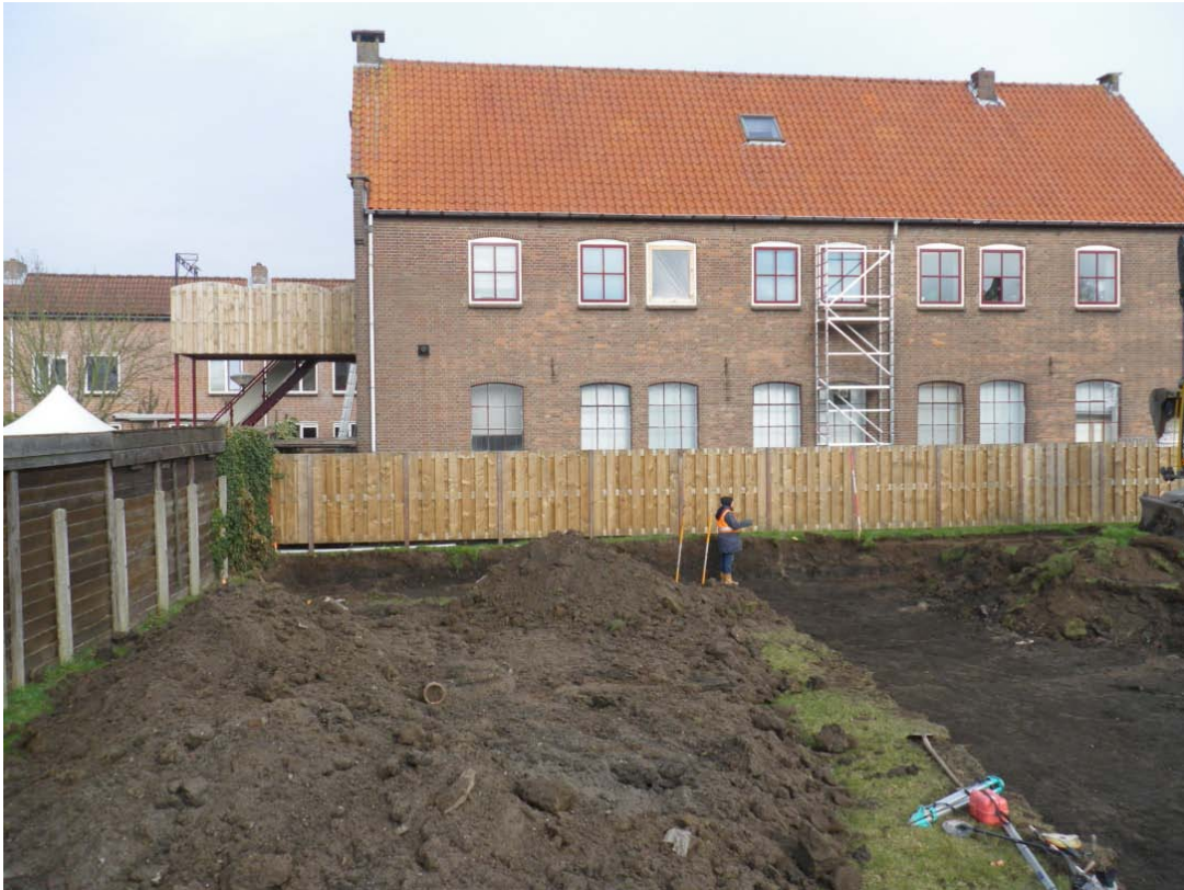
Figuur 3 Het onderzoeksgebied tijdens de graafwerkzaamheden.

De graafwerkzaamheden zijn conform het PvE uitgevoerd met behulp van een graafmachine met een gladde bak. De bouwput is laagsgewijs verdiept, waarbij de bodem van de bouwput als vlak 1 is gedocumenteerd. Het vlak werd op 5,10 m +NAP aangelegd. Het maaiveld bevond zich tussen 5,50 en 6 m +NAP. De bouwput is in drie werkputten (WP1-3) verdeeld. Een deel van het terrein aan de westzijde behoorde niet tot de bouwput en werd opgehoogd (figuur 3 en bijlage 2). De vlakken zijn gefotografeerd en handmatig getekend, schaal 1:50. Tijdens de aanleg van het vlak is vondstmateriaal verzameld (vnr. 1-4) en werd het vlak met behulp van een metaaldetector onderzocht. De vondsten komen uit een donkerbruingrijze humeuze zandige kleilaag. Deze laag heeft spoornummer 1 gekregen. In elke werkput is één profielkolom gedocumenteerd om de bodemopbouw in beeld te krijgen. De profielkolommen zijn gefotografeerd en getekend, schaal 1:20.