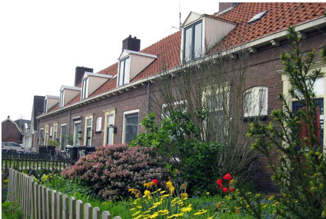
Figuur 1: Zes naoorlogse woningen op het plangebied vóór de sloop, richting het zuidwesten..