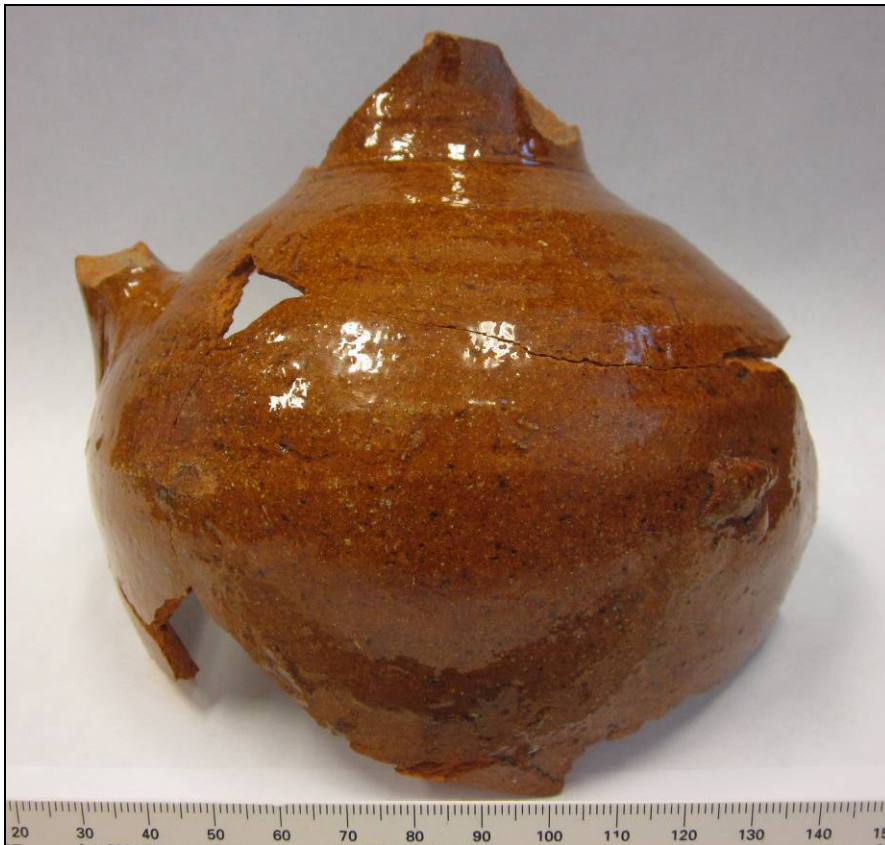
Detail kan van roodbakend loodglazuuraardewerk