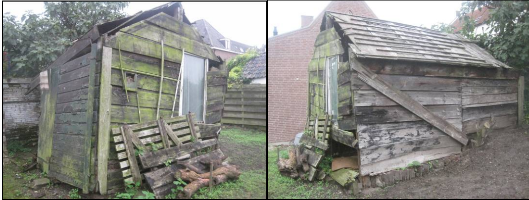
Het onlangs gesloopte schuurtje op 24 augustus 2011: links, gezien naar het zuiden; rechts, gezien naar het oosten

De onderzoekslocatie is gelegen aan de noordzijde van de bebouwde kom van Vianen en op de zuidelijke Lekdijk. Het betreft een perceel waar tot voor kort een bouwvallige schuur stond die kort voorafgaand aan het uitgraven van de bouwput is gesloopt. Volgens de eigenaar (dhr. D. van Rooijen) is dit schuurtje in de jaren '30 van de vorige eeuw aan de noordzijde van een tuinmuur aangebouwd. Het valt op dat het terrein sterk afloopt (zowel van zuid naar noord als lokaal van west naar oost). Bij de bouw heeft men dit aan de westzijde gedeeltelijk gecompenseerd door middel van een fundering van op hun korte kant ingegraven dakpannen.