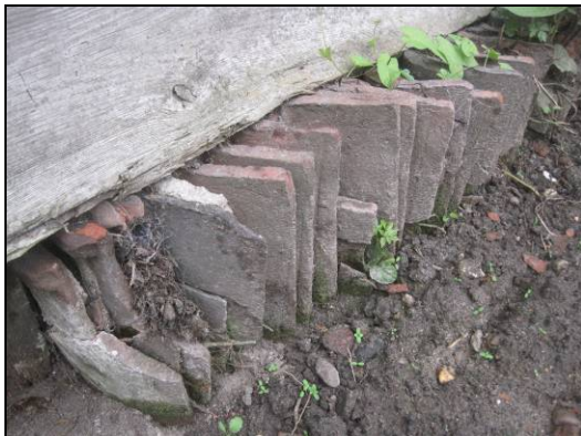
Detail fundering van dakpannen aan de westzijde