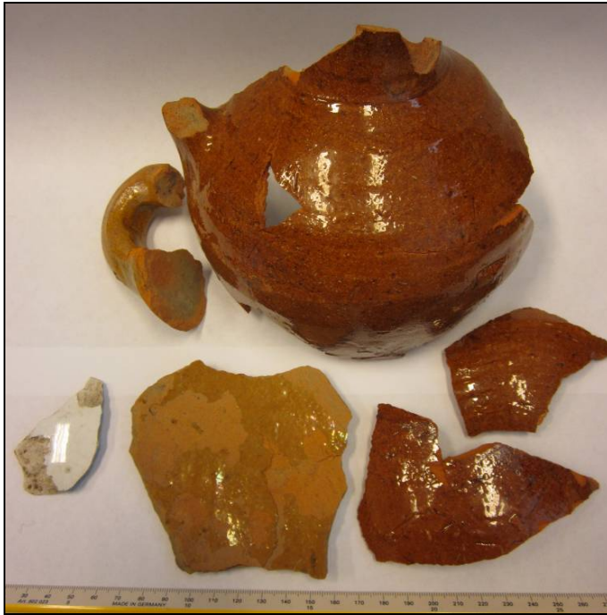
Overzicht van het aangetroffen aardewerk