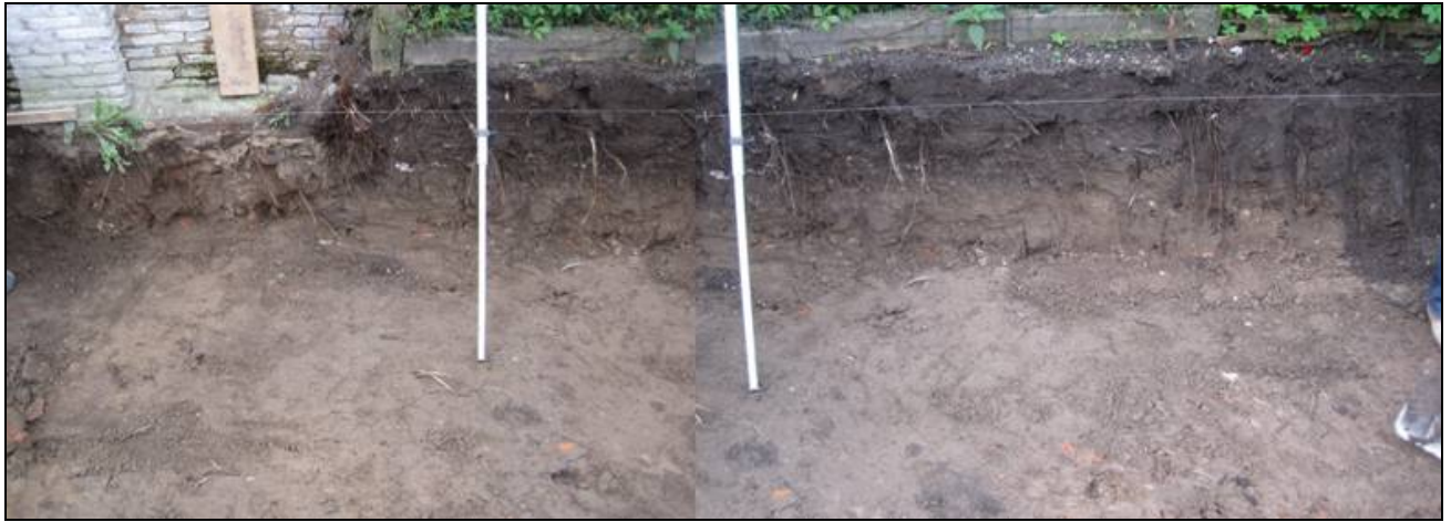
Overzicht zuidprofiel (composietfoto)