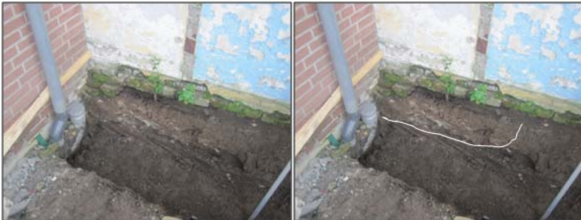
De uitbraaksleuf in het zuidprofiel van de sleuf ten behoeve van de nieuwe tuinmuur ten westen van de nieuwbouw

In het zuidprofiel van het sleufje dat ten behoeve van de aanleg van de tuinmuur was aangelegd, was in het profiel nog juist een rij halve bakstenen zichtbaar (op de foto zijn deze reeds machinaal verwijderd). Hierboven bevond zich veel mortel en baksteenpuin. Het gaat hier waarschijnlijk om een restant van een uitbraaksleuf en een laatste vleilaag van de hier eertijds aanwezige (tuin)muurfundering. Meer westelijk was deze in delen van het zuidprofiel van de bouwput ook nog goed zichtbaar.