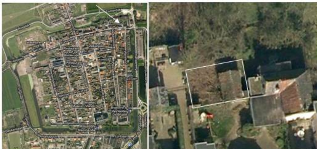
Locatie onderzoeksgebied in Vianen (google maps; raadpleegdatum 23-09-2011).

Beheer en plaats vondsten en documentatie: De vondsten en documentatie worden overgedragen aan het Provinciaal depot voor Bodemvondsten te Utrecht.