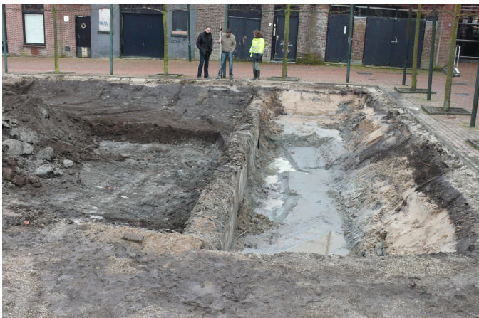
Figuur 4. Het onderzoeksgebied, gefotografeerd vanuit het westen. In het midden ligt de muur van gewapend beton en bakstenen uit 1985.