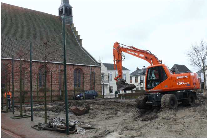
Figuur 2. Dokkum, Kunstwerk op de Markt. Foto van het onderzoeksgebied, genomen in zuidwestelijke richting. Links de St. Martinuskerk.