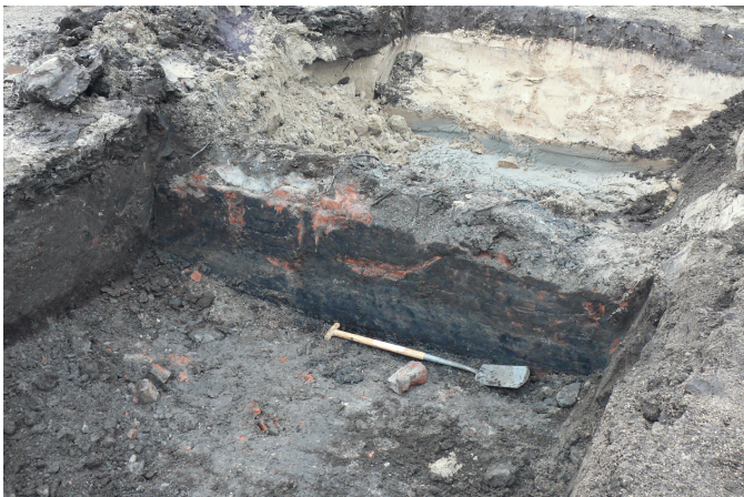
Figuur 3. De muur uit 1985. Foto genomen in zuidelijke richting, met zicht op de tegen de betonnen muur gemetselde bakstenen.