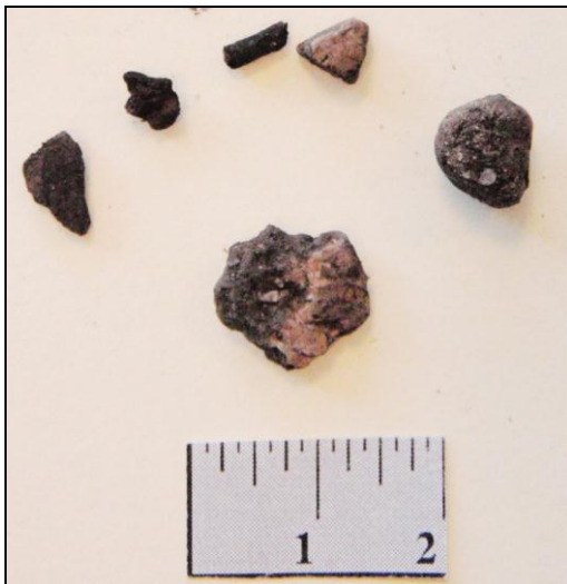
Afbeelding 2. Beeld van de vondsten in boring 6