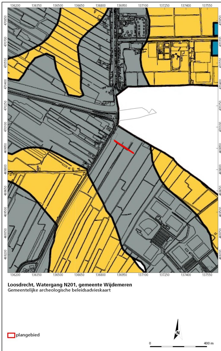
Figuur 1.2: Ligging van het plangebied op de archeologische beleidskaart van de gemeente Wijdmeren. Grijs zone: categorie 5, gele zone categorie 4.

De archeologische verwachting is hier vrij laag (Categorie 5). Het beleid van de gemeente Wijdmeren is in deze zone dat hier men pas rekening moet houden met archeologie als de planomvang 2500 m 2 en groter is.