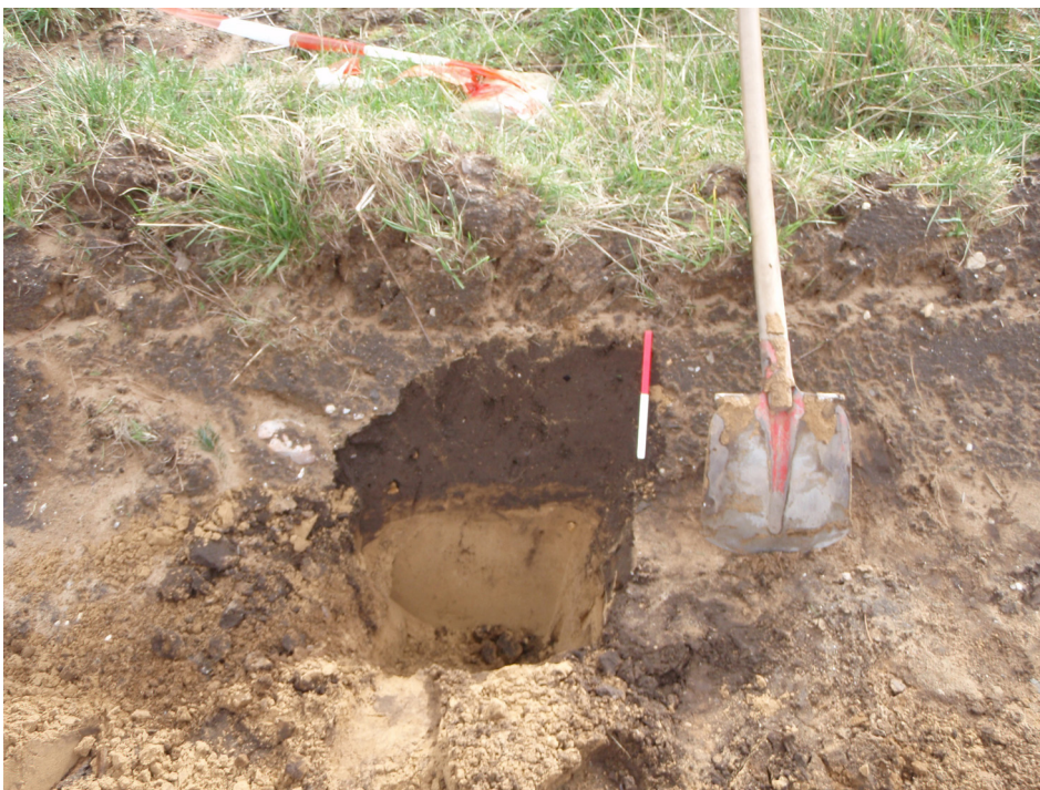
Afb. 5. Profielfoto.