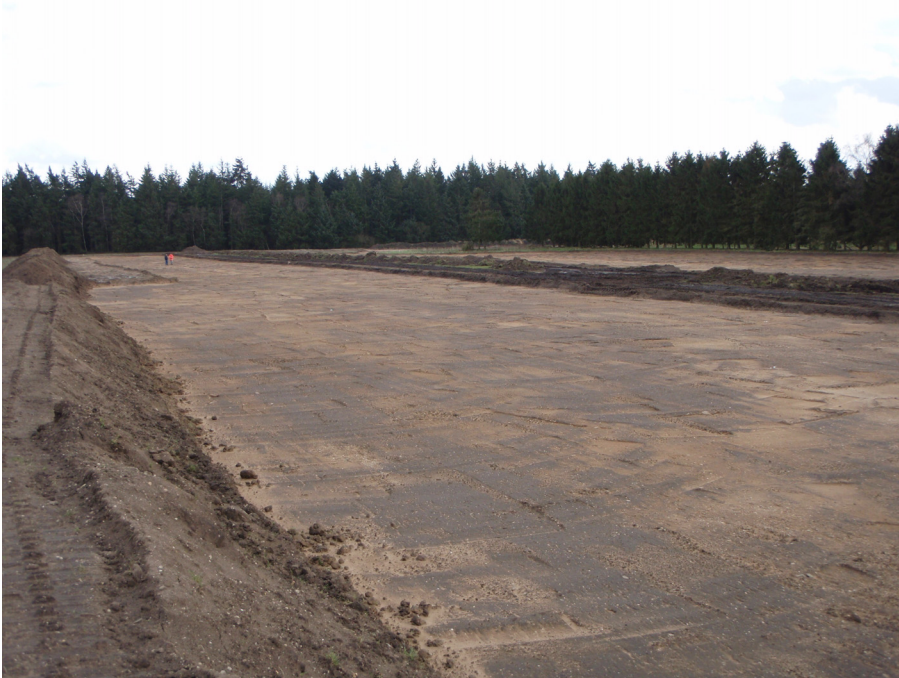
Afb. 2. Overzichtsfoto oostelijke deel afgegraven gedeelte onderzoeksterrein.

Tijdens het veldonderzoek is het gebied dat reeds was ontgraven systematisch afgelopen op sporen en vondstmateriaal. Over een groot gedeelte van het onderzoeksterrein was de bovengrond afgegraven tot op precies de overgang van de bouwvoor naar de top van het dekzand (Afb. 2 en 3). Hierdoor was er sprake van een zogenaamde 'koeienhuid', een gele basis van de top van het dekzand met grote zwarte vlekken van de bouwvoor (Afb. 4). Door deze ontgravingsdiepte was er echter geen sprake van een leesbaar vlak. Voor een goed zichtbaar en leesbaar vlak zou er verdiept moeten worden tot zeker enkele centimeters onder de bouwvoor. Tijdens het systematisch nalopen van het vlak zijn er geen sporen herkend. Wel zijn er enkele vondsten verzameld (met name vuursteen), die na determinatie natuurlijk bleken te zijn. Ook specifieke waarden van het gebied, zoals de walletjes van de Celtic Fields, waren in het veld niet waarneembaar,