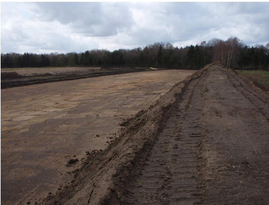
Afb. 3. Overzichtsfoto westelijke deel afgegraven gedeelte onderzoeksterrein.