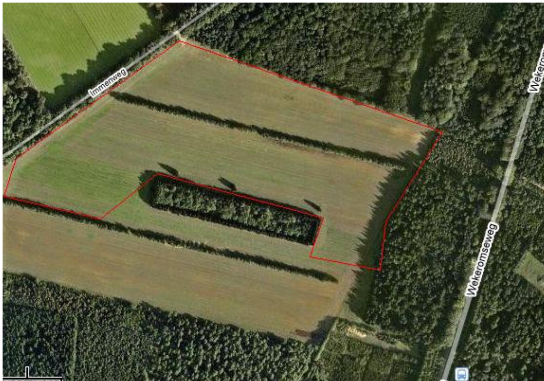
Afb. 1. Locatie van het onderzoeksgebied op de topografische kaart.