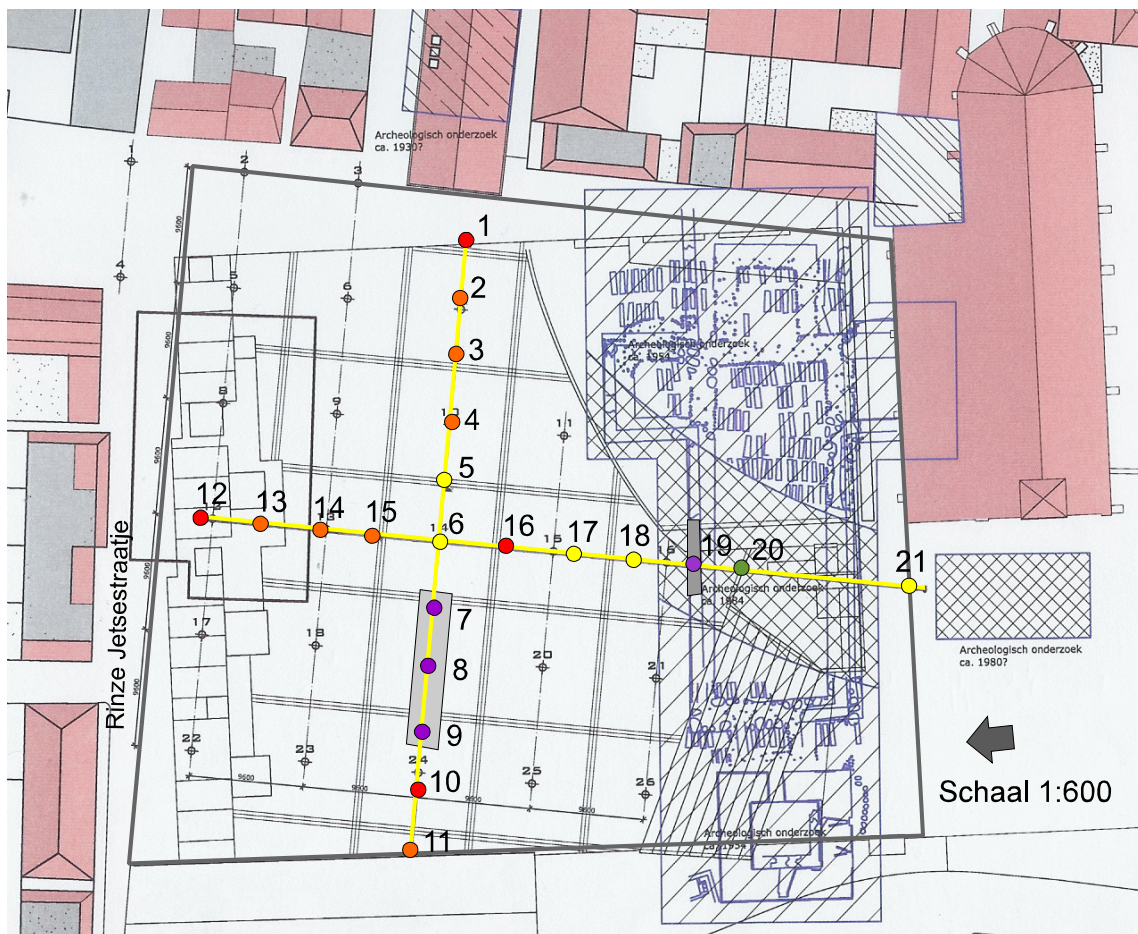
Figuur 3. Dokkum Markt: situatietekening met de boorlocaties. De donkergrijze lijn geeft de begrenzing van het onderzoeksgebied aan. De genummerde punten geven de uitgevoerde boringen weer. Op de rood aangegeven boorpunten is met zekerheid een kist-begruwing aangetroffen. Op de oranje aangegeven boorpunten is waarschijnlijk ook een graf (of grafstructuur) aanwezig. De boringen op de geel gemarkeerde boorpunten bevatten vondstrijke klei. Op de paars aangegeven boorpunten is ondoordringbaar steen aangetroffen. Bij de boringen 7, 8 en 9 lijkt het om een doorlopende structuur te gaan waarvan de bovenkant op ongeveer 3,1m +NAP ligt. Bij boring 19 zijn op deze zelfde diepte muurresten van de hier in 1954 opgegraven kerk met begravingen aangetroffen. De resultaten van deze opgraving zijn zichtbaar in blauw. Het kruislings gearceerde gebied betreft de noodopgraving van 1984. Slechts in boring 20 zijn geen archeologische resten aangetroffen.