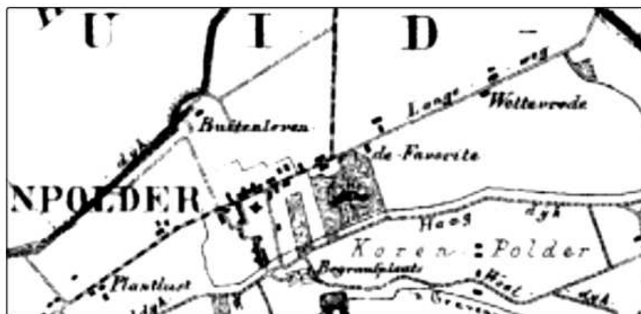
Afbeelding 2 's-Gravenpolder in 1866 (met detail van de situatie aan de Langeweg).