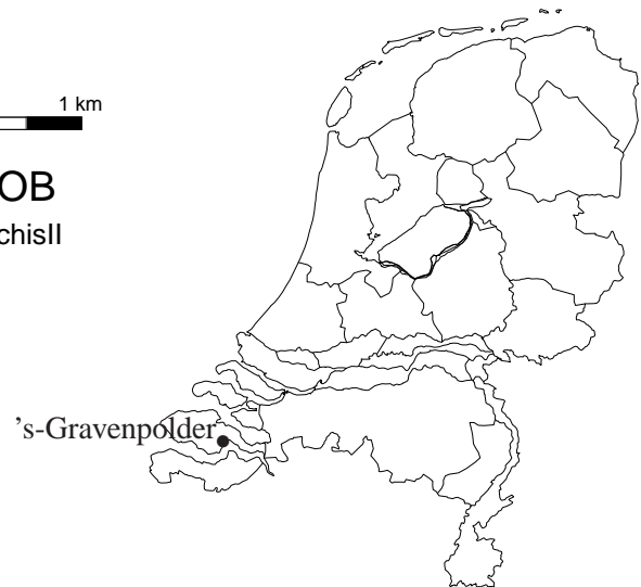
Afbeelding 1 De ligging van de kerk van de Gereformeerde Gemeente (zwarte stip).