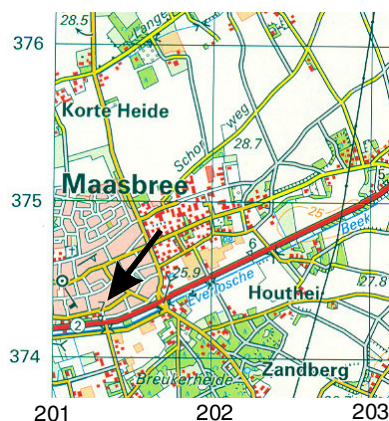
Figuur 1. Maasbree, Broekstraat 65: overzichtskaart. Het plangebied is met een zwarte pijl aangegeven. [Naar: ANWB 2002. Topografische Atlas Nederland - 1:50000 . ANWB, Den Haag].

Het Provinciaal Omgevingsplan Limburg (POL) gaat uit van bescherming van archeologische waarden in situ (in de oorspronkelijke vindplaats) en sluit hiermee aan op internationale afspraken (verdrag van Malta). Aangezien het plangebied een oppervlakte heeft van meer dan 2500 m 2 dient in het plangebied een inventariserend veldonderzoek uitgevoerd te worden dat moet vaststellen of er archeologische waarden aanwezig zijn.