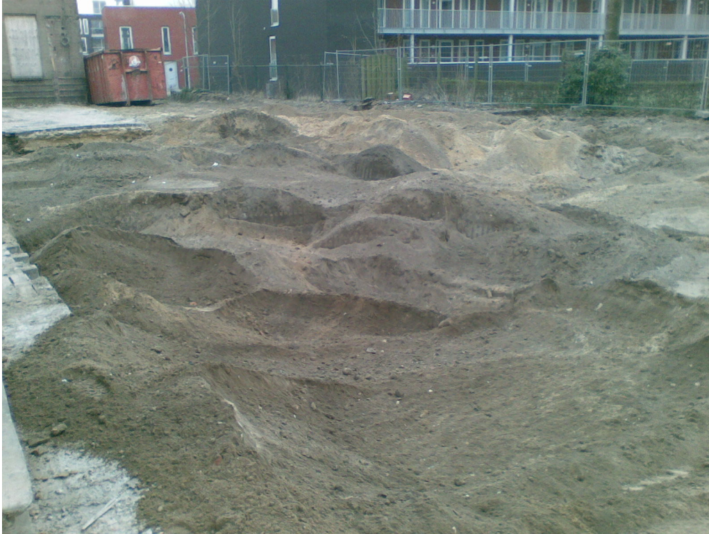
Figuur 2. Impressie van de terreingesteldheid van het plangebied.