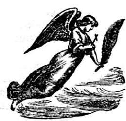
Surulla ilmoitamme että Herran on kuolleen tutunutta rakkaan pienotajamme